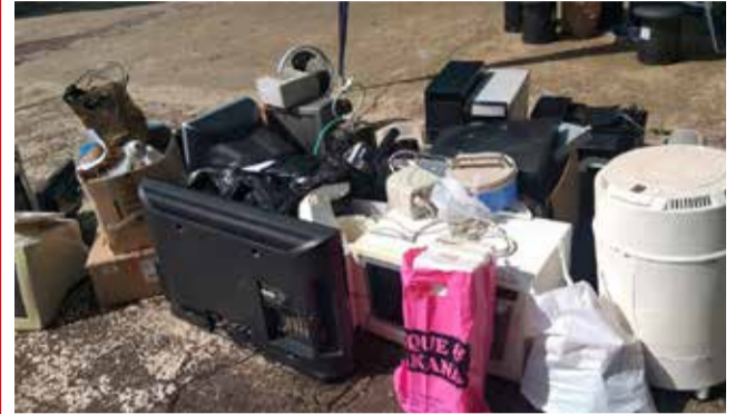
O objetivo é possibilitar o descarte ambientalmente adequado destes materiais