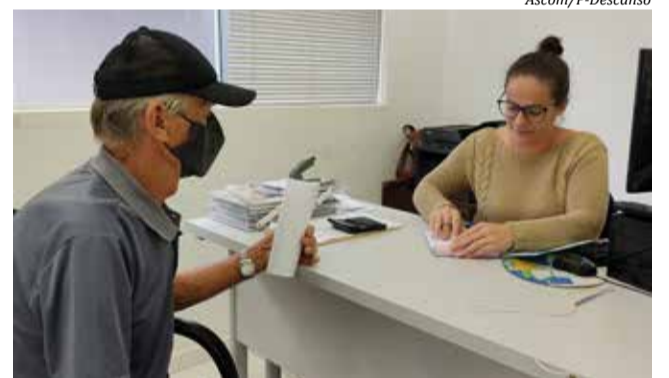
Até o momento foram retirados 71 mil quilos de sementes nas agropecuárias credenciadas