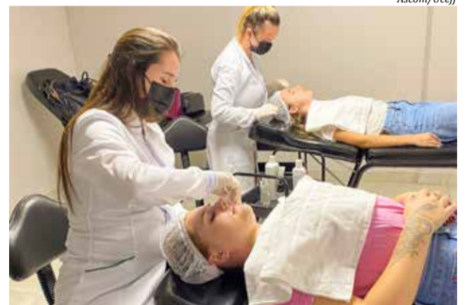
Projeto piloto que visa atender modelos da comunidade com procedimento estético de limpeza de pele