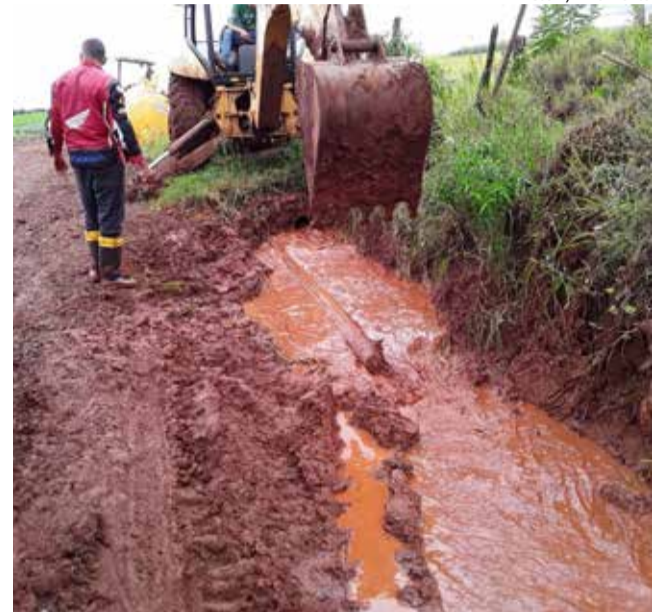
Chuva danificaram estradas e bueiros recentemente recuperados pela equipe de Obras