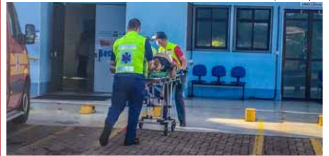
Vítima foi transportada pelos bombeiros ao Hospital Regional, mas a vítima não resistiu