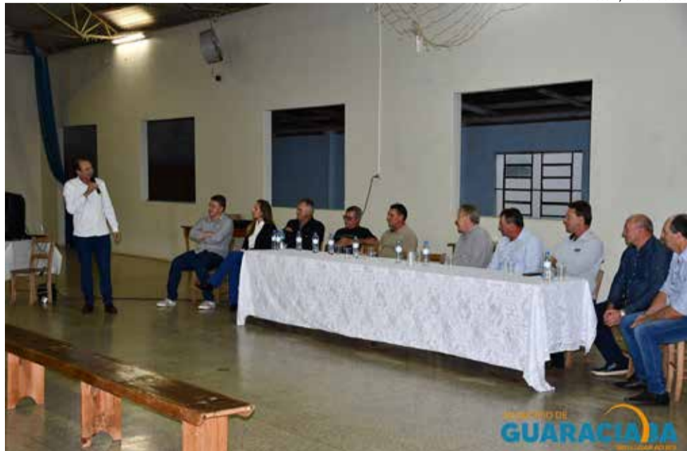
O prefeito Vandecir Dorigon se emocionou ao falar da inauguração dessa obra e de tudo o que passou até chegar aqui

O prefeito Vandecir Dorigon se emocionou ao falar da inauguração dessa obra e de tudo o que passou até chegar aqui. Enalteceu a participação de todos nas conquistas de Guaraciaba sem olhar partidos políticos e sim o