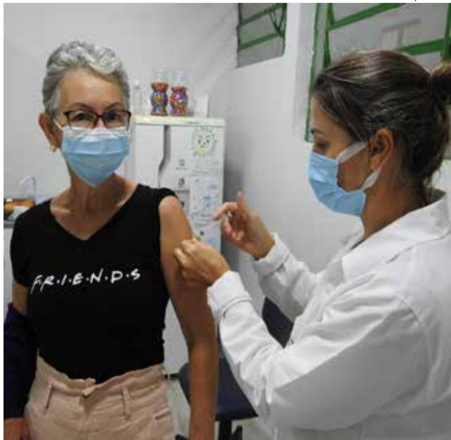
A campanha terá prosseguimento até 03 de junho