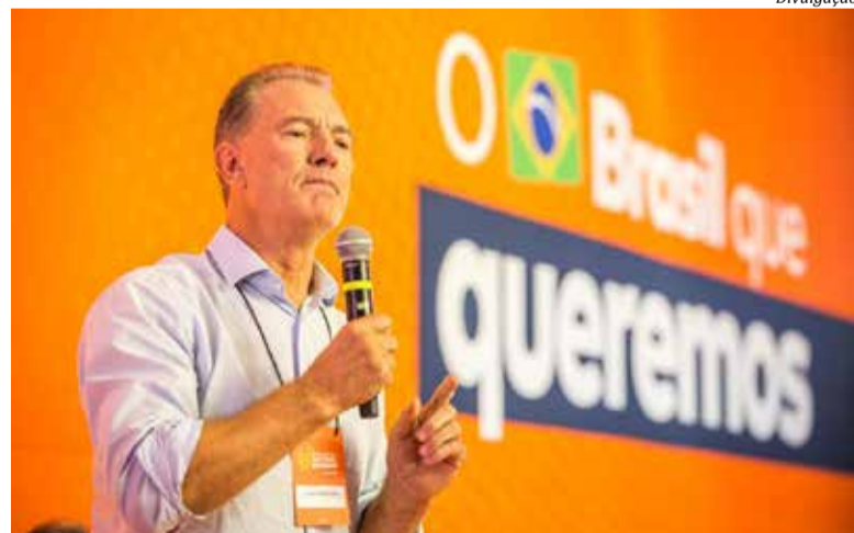
Odair Tramontin estará em São Miguel do Oeste segunda-feira

anos como promotor de Justiça e já foi coordenador do Grupo de Atuação Especial de Combate às Organizações Criminosas (Gaeco) em Blumenau, onde trabalhou no enfrentamento à corrupção. Natural de Campo Erê, mudou-se para Florianópolis, onde se formou em Direito pela Univer-