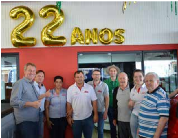
Equipe da Itamar Automóveis espera por você

A loja Itamar Automóveis fica a Willy Barth nº 3356, Fone Telefone: (49) 3622-0800.