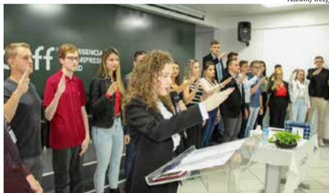
Formatura aconteceu sexta-feira com colação de grau de 170 formandos

Foram entregues os troféus de Mérito Acadê-