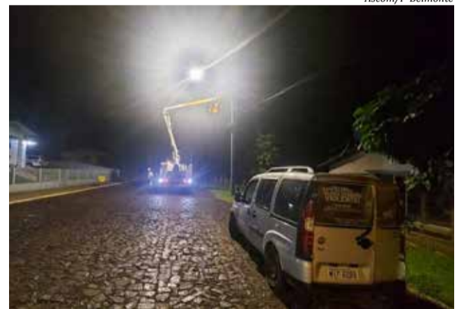
A troca das lâmpadas de vapor de sódio por Led iniciou em dezembro de 2021 e segue em etapas

Segundo o prefeito, Jair Giumbelli, a intenção é de atender a todas as ruas da cidade e assim gerar economia ao município e praticidade aos cidadãos.