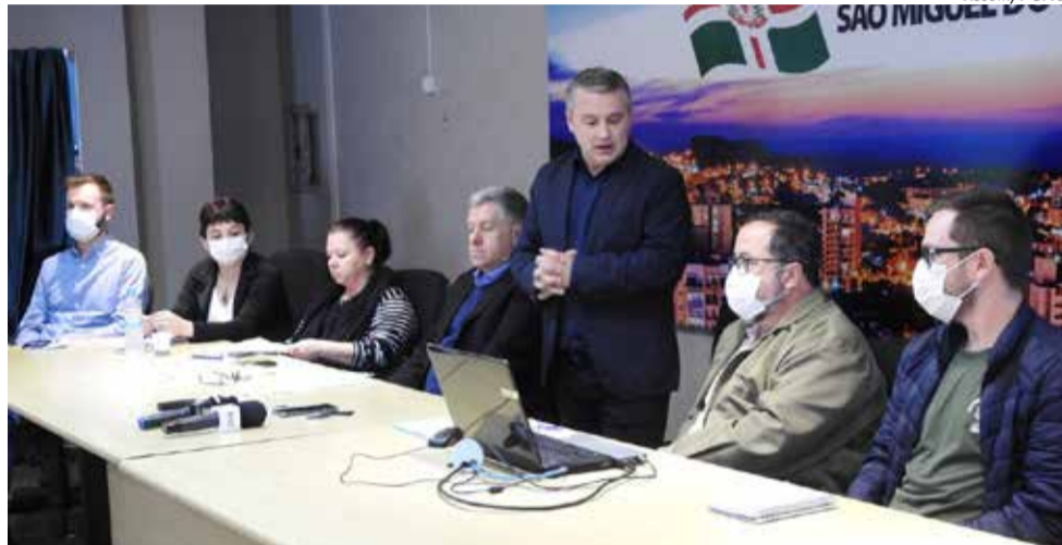
Reunião homologou a reabertura da Sala de Situação, com o envolvimento de entidades