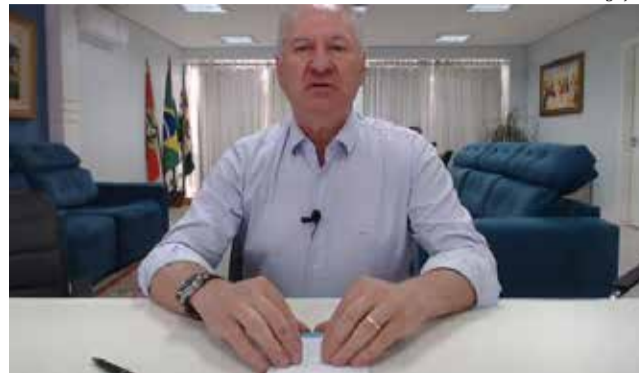
Anúncio foi feito pelo prefeito numa "live" em redes sociais