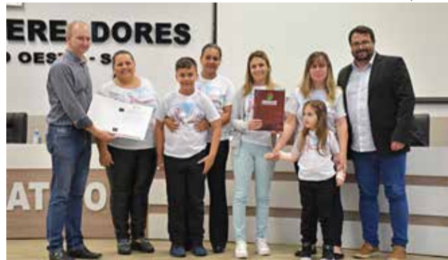
Vereadores entregaram moção de aplauso a membros da Associação de Pais e Amigos de Autistas