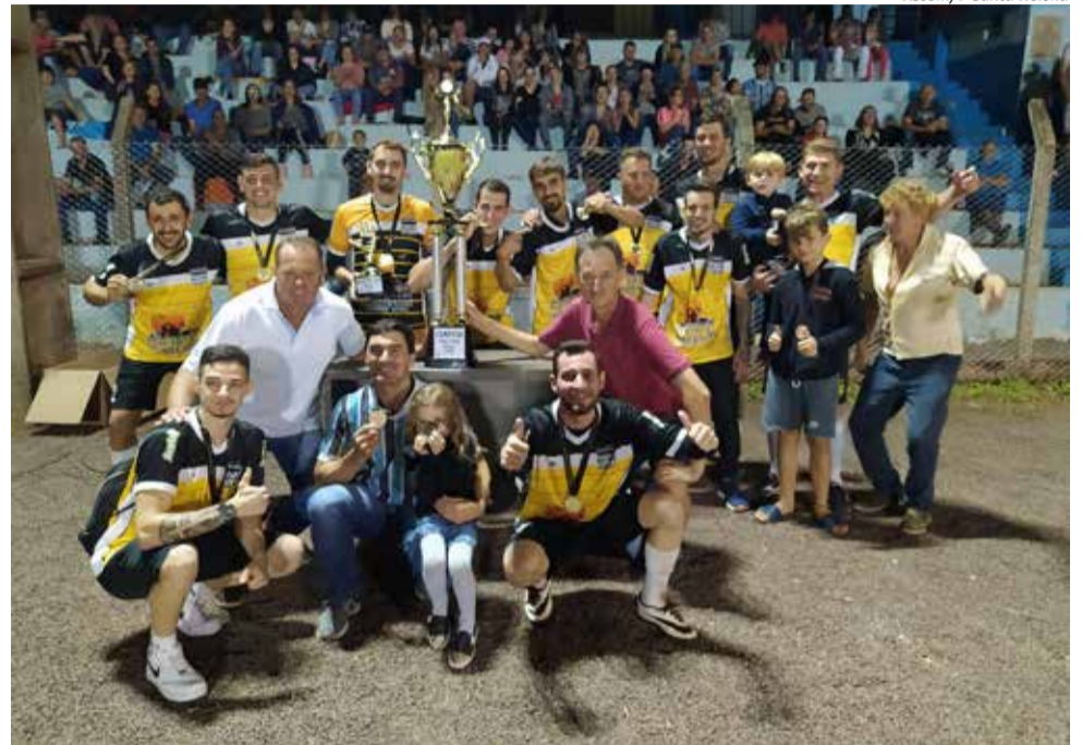
Bela Vista – campeã do Livre