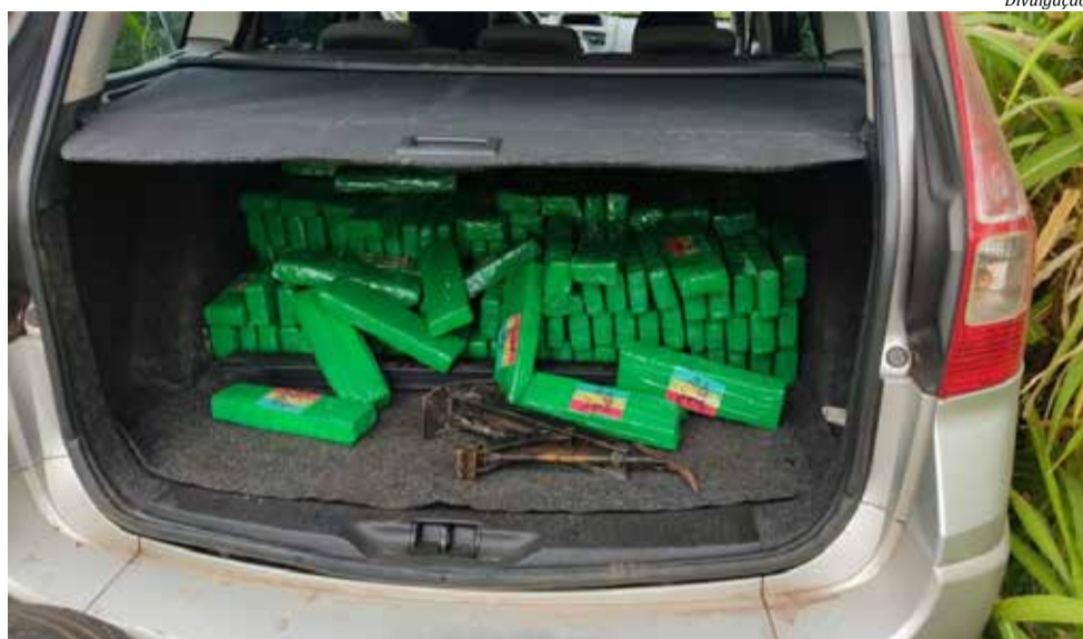
Droga foi apreendida em um automóvel Megane, com placas de São Paulo

Nos bancos traseiros do carro e no porta-malas, foram encontrados mais de