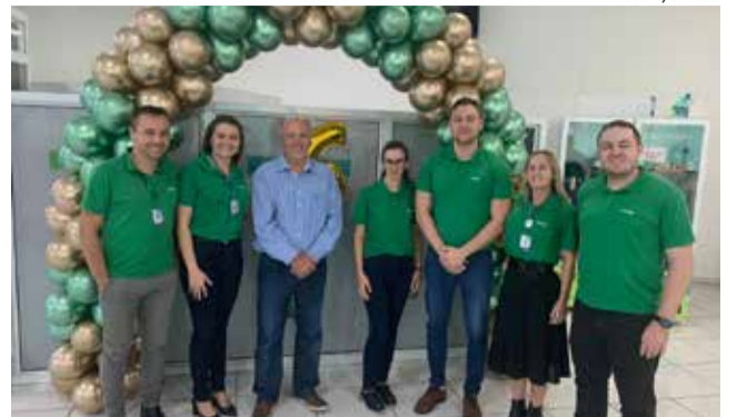
Aniversário da agência foi comemorado segunda-feira