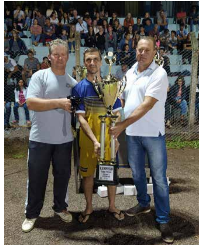
Consultório Triches - Campeão do Veterano