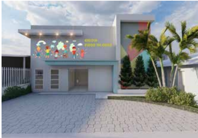
Centro Municipal de Educação Infantil Pingo de Ouro passará por melhorias e adequações