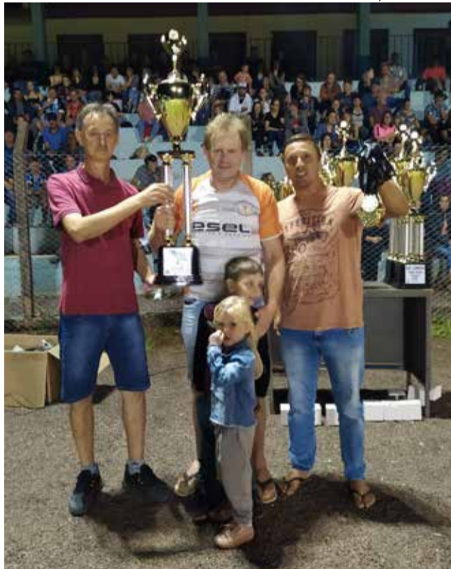
Acerve - Campeão do Master