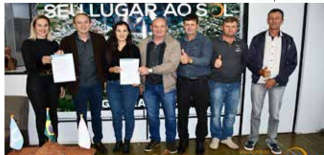
Assinatura das autorizações aconteceu segunda-feira, na prefeitura