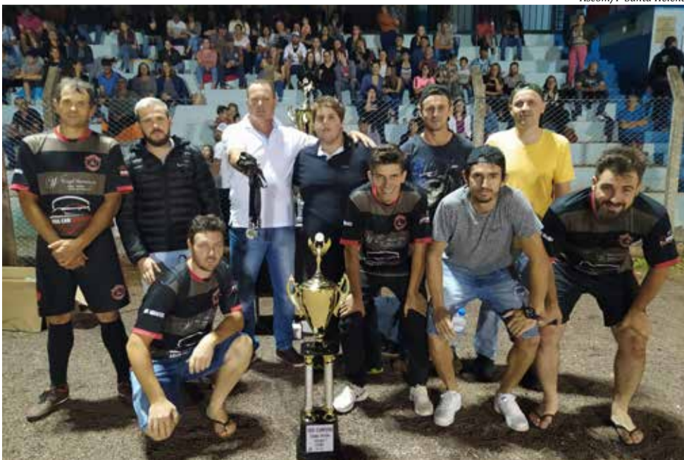
Amigos do Pombo - vice-campeão do Livre