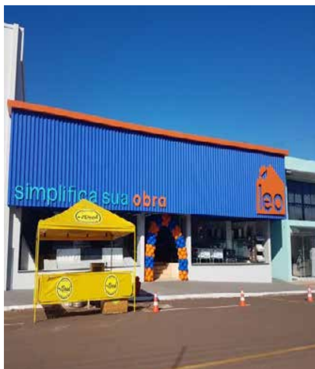
Loja de Descanso

A partir de sábado (02) a antiga Loja Léo Agostini de Descanso e São Miguel do Oeste inovou e o tradicional visual passou simplesmente para Lojas Leo. Segundo os proprietários, os clientes, quando se referiam à loja, já a chamavam somente pelo primeiro nome, ou seja, Léo. (Onde você comprou? - Lá no Léo, era a resposta).