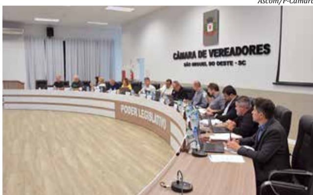
Projeto de Lei foi aprovado por maioria da Câmara

O Programa de Desacolhimento é destinado a jovens que recém completaram 18 anos de idade