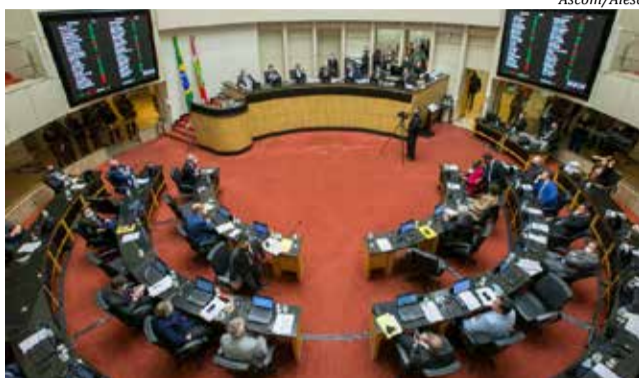
Janela partidária provocou alterações na disputa de forças no parlamento

O Podemos também teve mudanças. A legenda