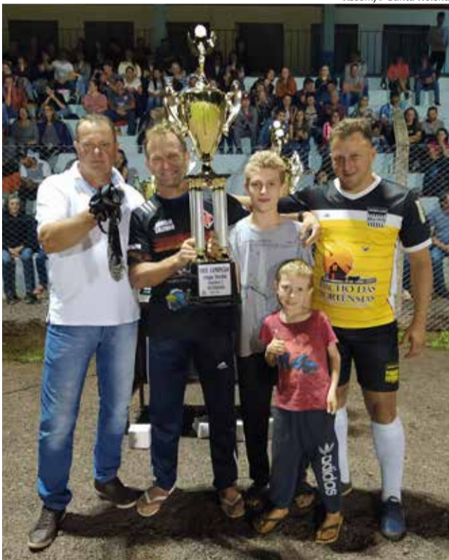
Laticínios Santa Helena - vice-campeão do Veterano