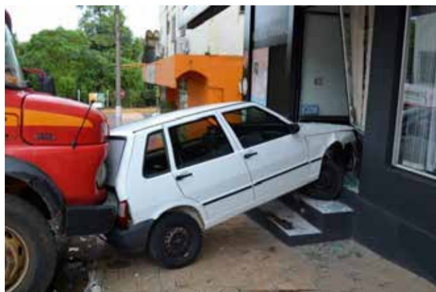
Caminhão esmagou o Fiat Uno contra a loja

Os danos materiais foram de grande monta, apesar de ninguém resultar ferido no acidente. Segundo o proprietário do caminhão, emplacado em Iporã do Oeste, o mesmo estaria carregando sucatas na propriedade do outro lado da rua, quando o caminhão repentinamente começou a andar, atravessou a rua e colidiu no carro em frente à loja.