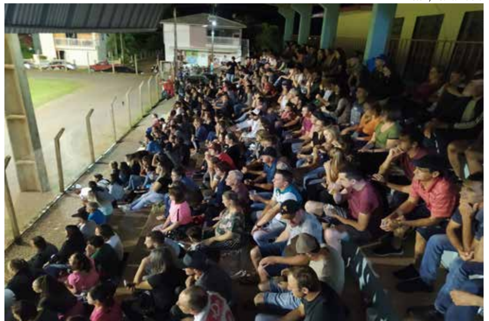
Público compareceu em massa para acompanhar as finais