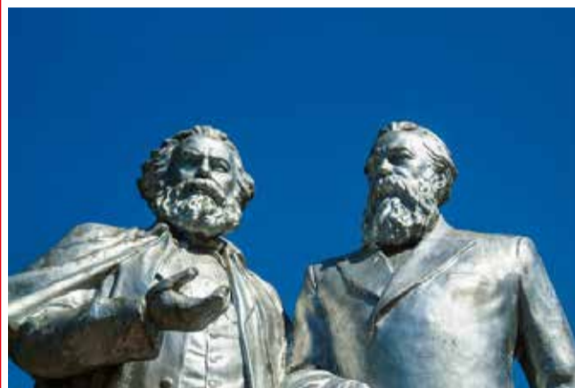
Marx e Engels, os autores do "Manifesto do Partido Comunista", sonhavam com os trabalhadores no centro do poder

No entanto, não é só a invasão covarde da Rússia à Ucrânia. Essa barbárie de todos os dias soma outros ingredientes criminosos do dia a dia: mortes perversas em todos os cantos da cidade, a toda; gente indefesa assassinada por bandidos que nunca são presos e vivem impunes cometendo crimes todos os dias.