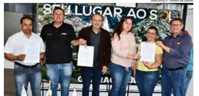
Termo de fomento foi assinado segunda-feira entre a prefeitura e a entidade

O valor repassado será de R$ 40.200,00 em duas parcelas. O Grupo Folclórico Lichtenschein conta com cerca de 100 integrantes e representa o município em vários eventos pela região com a dança folclórica alemã.