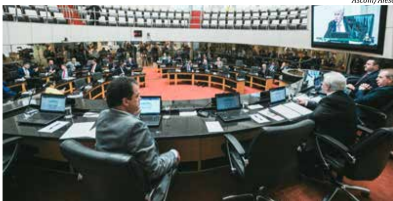
Matéria foi retirada de pauta na sessão de terça-feira

O requerimento foi assinado pelos líderes do MDB, PSD, PT, PP e PSDB, com base no parágrafo pri-