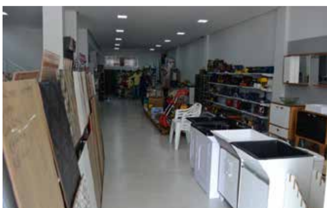
Aspecto do interior da nova loja