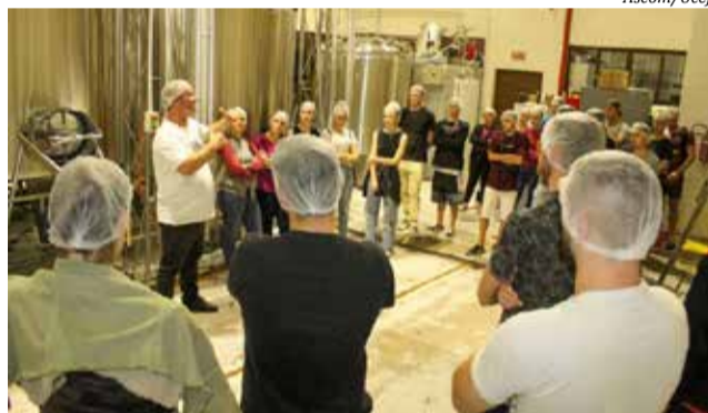
Acadêmicos conheceram os processos de fabricação da marca Lassberg