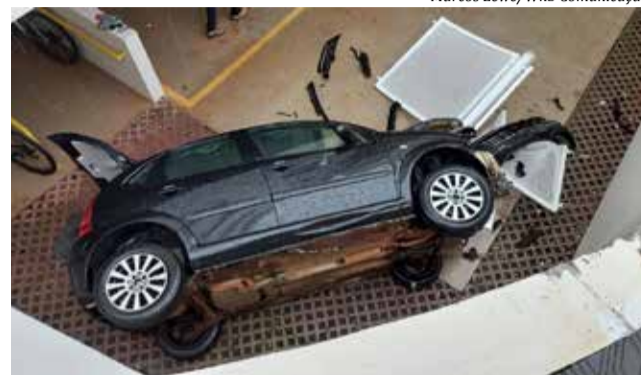
Ocorrência foi registrada na manhã de ontem, no Bairro Agostini