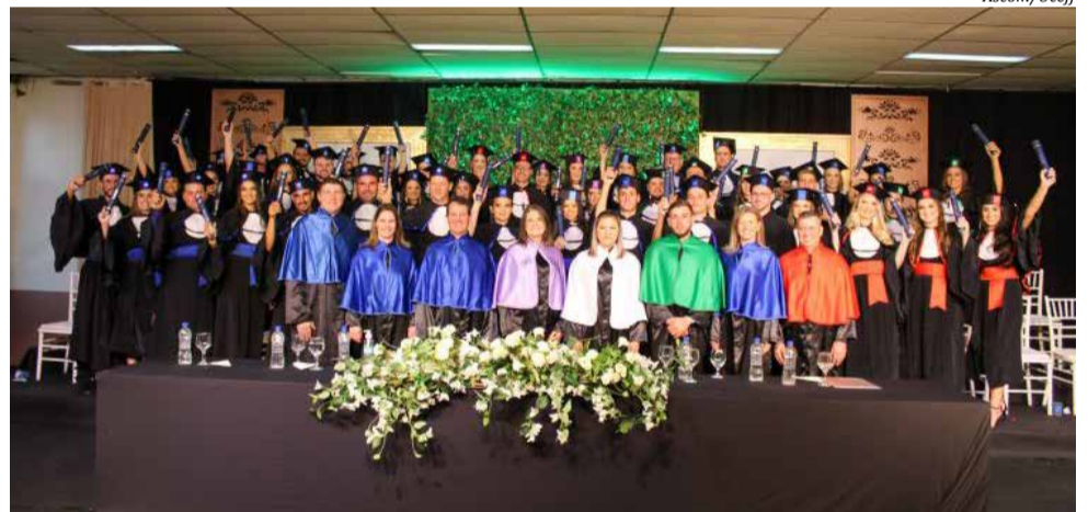
Formatura foi realizada na noite de sábado, no Clube Imigrantes