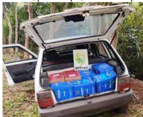
Fim da linha, para vinho ilegal