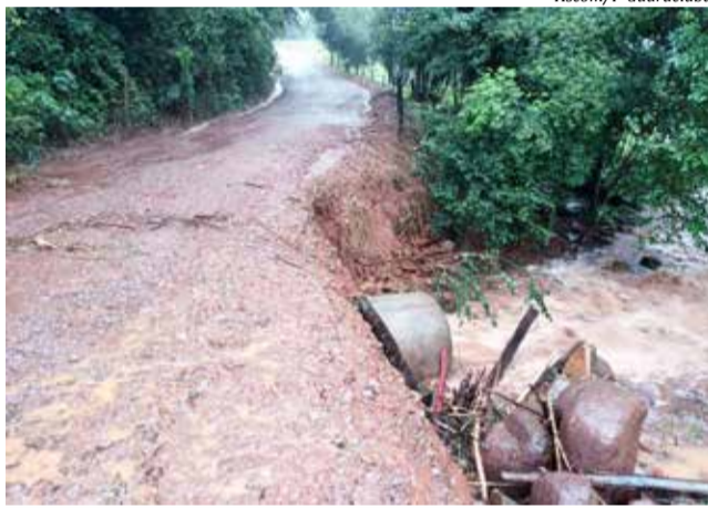
Os cerca de 215 milímetros de chuva provocaram estragos no interior de Guaraciaba