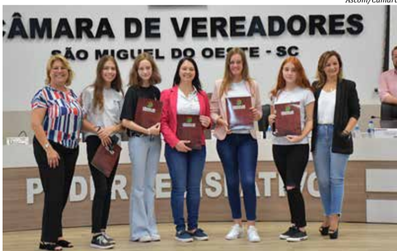
Vereadoras entregaram moção de aplauso a alunas, professora e direção do IFSC

As vereadoras destacam que o edital do concurso foi exclusivo para alunas do ensino médio das instituições federais e a seleção contemplou 20 equipes do país, uma delas do IFSC de São Miguel do Oeste, o único em Santa Catarina, e que irá concorrer com outros projetos dos Estados Unidos. A proposta selecionada do IFSC é do curso Técnico Integrado em Alimentos e foi desenvolvida na disciplina de Biologia.