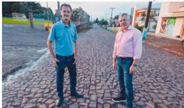
Prefeito Blásio Hickmann e o deputado Fabiano da Luz, um dos autores de emendas para o município

O ginásio de Esportes de Linha Liberdade está recebendo um investimento de R$ 89.552,42, recurso destinado por Mauro de Nadal. No local, será construída uma varanda nova com es-