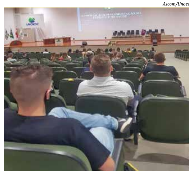
Evento promoveu a integração das turmas de Nutrição e Farmácia da Unoesc