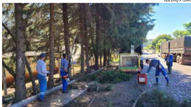
Trabalhos se estendem até o dia 30 de junho

Conforme o secretário adjunto de Urbanismo, Cláudio Barp, os moradores que forem realizar podas em suas propriedades devem observar o cronograma e depositar o material em frente às residências e comércios para que as equipes possam efetuar o serviço.