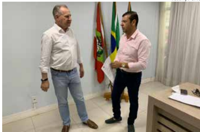
Deputado Maurício Eskudlark (C) entregou emenda de R$ 300 mil na Câmara de Vereadores