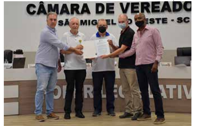
Moção foi entregue a membros do clube de serviço

Os vereadores ressaltam que em São Miguel do Oeste o Rotary Club existe há 53 anos. Durante esse período, já realizou dezenas de projetos de apoio à comunidade, como a construção da nova Casa de Apoio do Hospital Regional Terezinha Gaio Basso e o fraldário, que já distribuiu mais de 14 mil fraldas geriátricas ao longo de mais de 10 anos. "Além disso, o Rotary Club está presente