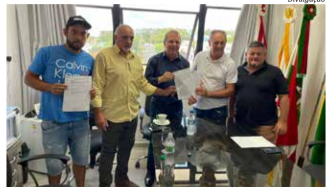
Lideranças emedebistas repassaram ao município emenda de R$ 500 mil do deputado federal Celso Maldaner