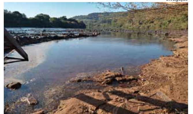
Chuvas foram insuficientes para melhorar a oferta de água

Em relação ao abastecimento urbano, 259 municípios atualizaram as informações junto às agências reguladoras nos últimos dias. Desses, 157 estão com o abastecimento urbano em situação normal, 75 em atenção, nove em alerta e 18 em situação crítica, quase todos no Oeste. Esses números