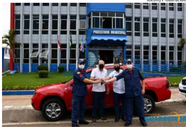
Entrega foi realizada quinta-feira

A aquisição do Veículo Duster Oroch, motor 1.6 ano modelo 2021/2022, foi possível com esforço e economia de recursos do convênio durante os últimos anos. Após a plotagem do veículo nos padrões do Corpo de Bom-