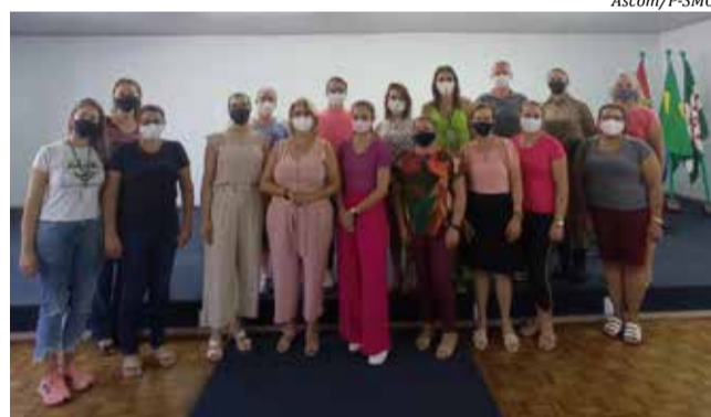
Posse da nova diretoria aconteceu no auditório da Secretaria Municipal de Educação