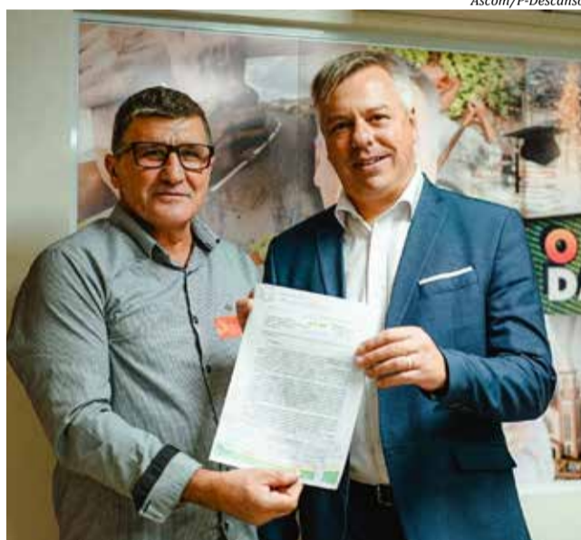
Recursos foram assegurados pelo deputado Fabiano da Luz (D)

Com isso, o município realizou o reequilíbrio orçamentário, faltando cerca de R$ 900 mil para realizar uma nova licitação da obra, motivo pelo qual Bonamigo solicitou auxílio de Fabiano e foi atendido. "Somando os recursos destinados por Fabiano e mais de R$ 240 mil de contrapartida do município, vamos licitar novamente essa importante obra e esperamos que empresas