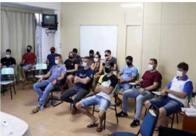
Representantes das entidades durante o Congresso Técnico

Na sexta-feira, 18 de fevereiro, o Governo Municipal de Descanso por meio da Secretaria de Esportes realizou, com a presença de dirigentes de delegações, o congresso técnico para definir os últimos detalhes do regulamento e sorteio das chaves do 28º Jogos Abertos de Descanso (Jades).