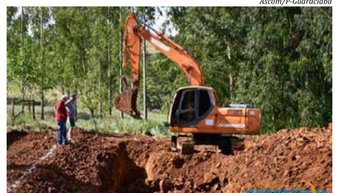
Construção de cisternas ajuda a enfrentar o período de estiagem

O sistema consiste em fazer a escavação, forrar com lonas e captar a água por meio dos telhados das construções. Os agricultores financiam por meio de programas de incentivo do Estado e a prefeitura auxilia com máquinas. Segundo Marangon, outros incentivos também estão acontecendo, como cascalhamento em propriedades, principalmente as