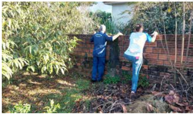
A ação fez um pente fino na cidade e um mapeamento das áreas de risco para posterior fiscalização