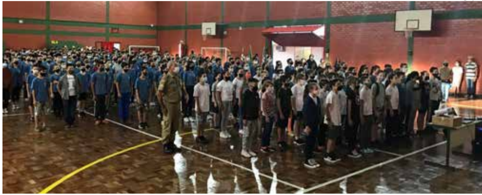
Atividades na semana passada foram dedicadas à comemoração do aniversário do município

A rotina diária da escola inicia com os monitores militares realizando