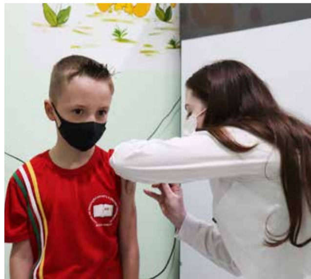
O menino caprichou no visual para se vacinar

“Podemos considerar que está havendo um baixa adesão à vacinação das crianças e isso é preocupante, já que o Brasil tem umas das maiores incidências de mortes de crianças por Covid-19. A vacina é mais uma forma de proteção e é muito importante pois, em caso de infecção, a probabilidade da reação ser grave é bem menor”, destaca o secretário de Saúde, Cleber Rech.