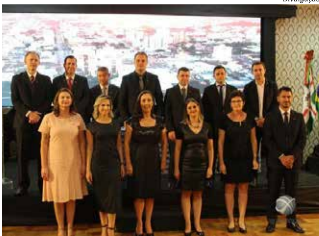
Posse aconteceu na noite de sábado, no Clube Comercial

O evento contou também com a participação de integrantes de diversas outras CDLs de várias regiões do Estado, além da Federação das Câmaras de Dirigentes Lojistas (FCDL). O ato ainda teve pronunciamentos de autoridades, juramento da presidente e entrega de distintivo. Ao final, todos participaram de um jantar.