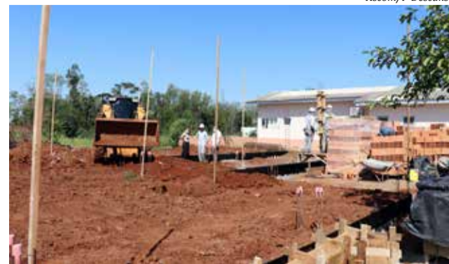
Na obra será investido aproximadamente R$ 440 mil