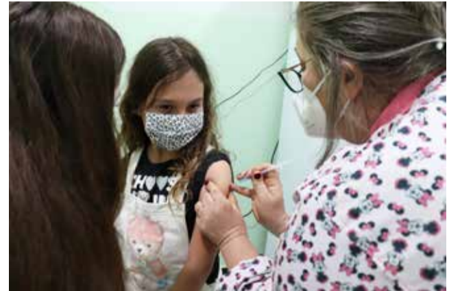
Baixa procura pela vacina preocupa a Secretaria de Saúde