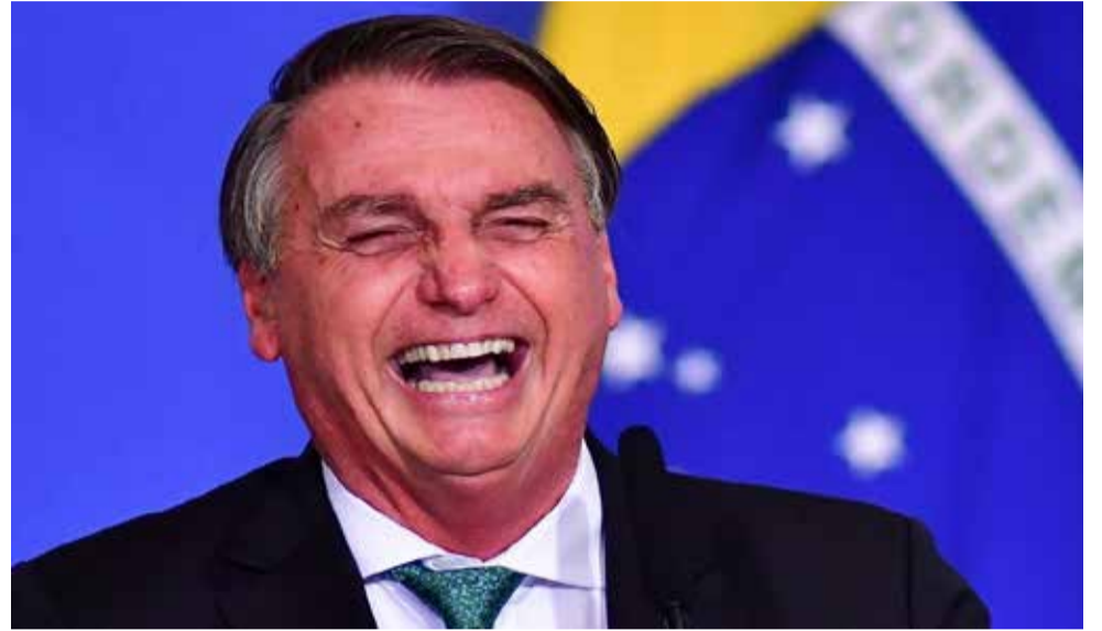
Presidente Jair Bolsonaro afirmou que 'nos próximos dias' vai acontecer 'algo' que vai 'salvar' o Brasil

Quase ao mesmo tempo, o filho do presidente, Eduardo Bolsonaro (PSL), postou um vídeo nas redes sociais dizendo que "vão dar um golpe que vai acabar