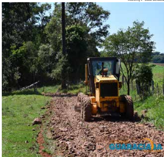
Os investimentos são particulares com o auxílio da prefeitura em terraplenagem, nivelamento, acessos e estradas