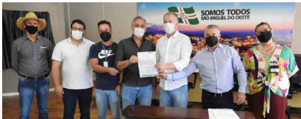
Anúncio foi feito durante solenidade no Salão Nobre da prefeitura

Somente em obras executadas no ano passado e outras que devem iniciar ainda este ano, o Município já tem a confirmação de cerca de R$ 75 milhões em investimentos. "Com uma gestão equilibrada e firme, estamos transformando São Miguel do Oeste, com obras e ações ousadas, que proporcionam muito mais qualidade de vida no dia a dia das pessoas", salienta o prefeito.