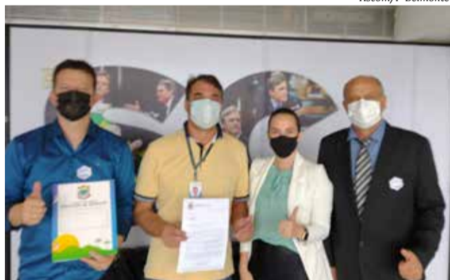
Pedidos foram protocolados em Brasília na semana passada

Já para os senadores, foram protocolados pedi-