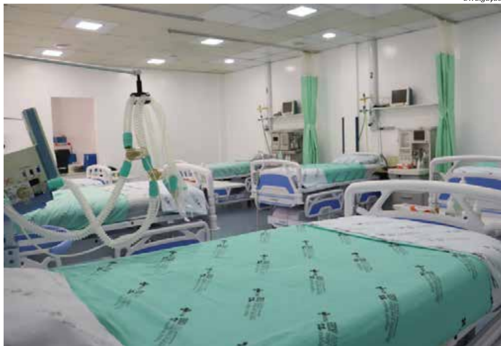
A ampliação dos leitos de UTI é a principal necessidade neste momento