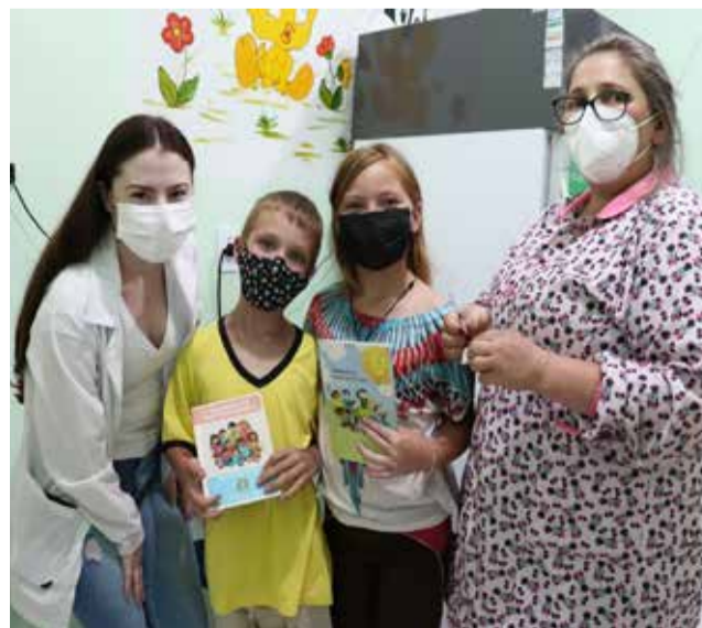
Enquanto alguns posam com orgulho da vacina, outros desafiam a ciência

Rech cita ainda que os agentes comunitários de saúde estão realizando a busca ativa do público alvo e que na quarta-feira, 16 de fevereiro, a Secretaria realizou a vacinação da primeira dose para todas as crianças de 6 a 11 anos de idade.