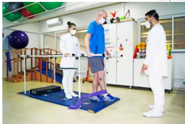
Clínica-escola tem uma estrutura ampla e moderna para o desenvolvimento das atividades

Viviane acrescenta que a Clínica-escola oferece um espaço de integração do ensino com o serviço, permitindo a aproximação do acadêmico com a comunidade. "A clínica-escola oferece para o acadêmico a vivência de um serviço de fisioterapia, um cenário de