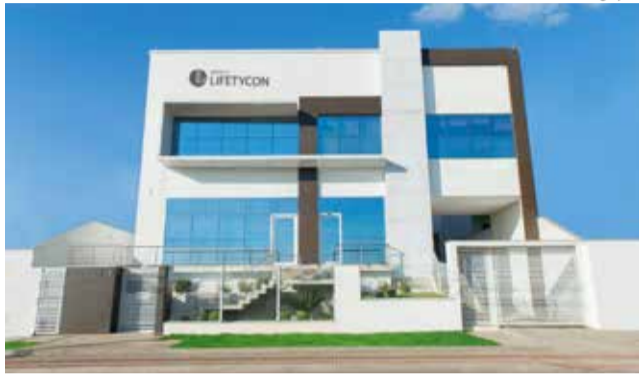
Lifetycon tem sede em Chapecó e escritório em São Miguel do Oeste

A demora na movimentação do dinheiro entre aplicativo e conta corrente, no entanto, acabou preocupando alguns consumidores. A demora na liberação dos saques acabou rendendo uma onda de dezenas