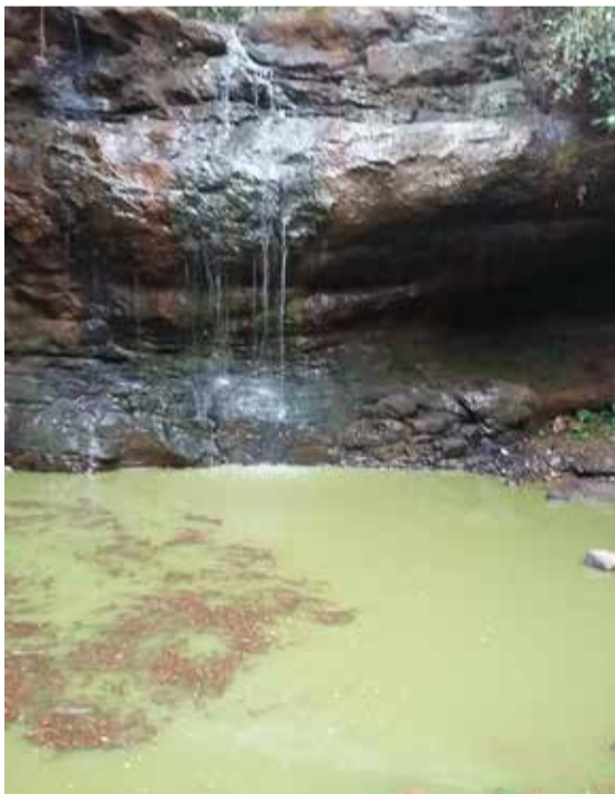
Rio Pirapó foi transformado em esgoto

O fato inviabilizou a água até para o consumo animal. As pessoas que utilizam o rio para suprir a grande falta de água, ficaram revoltadas e solicitam providências das autoridades ambientais para responsabilizar quem teve a iniciativa de poluir o rio sem pensar nos vizinhos.