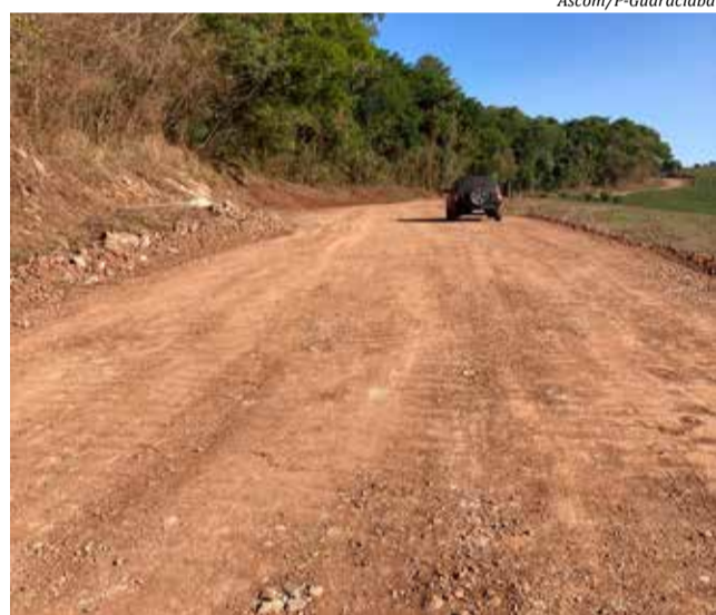
Pavimentação asfáltica da estrada geral da Linha São Roque é um dos investimentos previstos