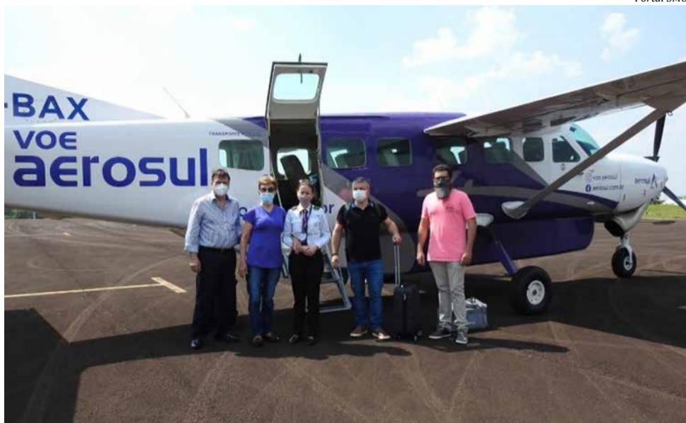
O voo inaugural entre São Miguel do Oeste e Florianópolis aconteceu no dia 27 de setembro de 2021

O voo inaugural entre São Miguel do Oeste e Florianópolis aconteceu no dia 27 de setembro