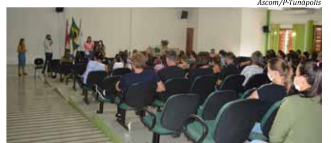
Palestra aconteceu na manhã de segunda-feira

De acordo com a secretária de Educação, Cultura e Esporte de Tunápolis,