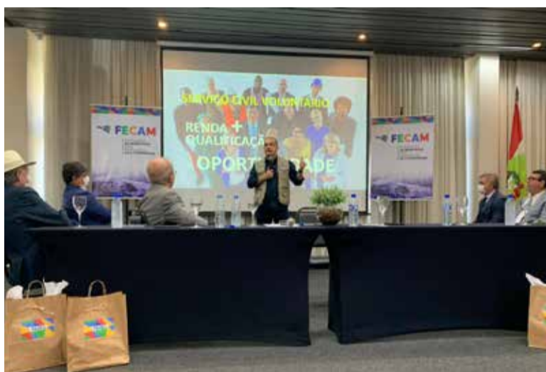
Apresentação do programa aconteceu na última segunda-feira (7)