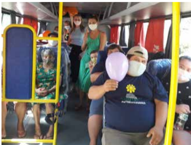
Os alunos da APAE comemoram a novidade

O ônibus foi adquirido por meio de um projeto chamado "SC mais inclusiva". O programa "SC Mais Inclusiva" é um pacote de investimentos inédito na área da Educação Especial, lançado em julho do ano passado e que beneficia mais de 25 mil pessoas com deficiência atendidas por instituições como Apaes, Amas, associações de surdos, de deficientes físicos e visuais.