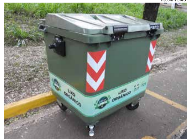
Neste primeiro momento cerca de 300 unidades foram distribuídas na área central da cidade

Os contêineres têm tampas que impedem a proliferação de odores e também o acesso de animais. Periodicamente, uma equipe também realiza a sua higienização. Cada