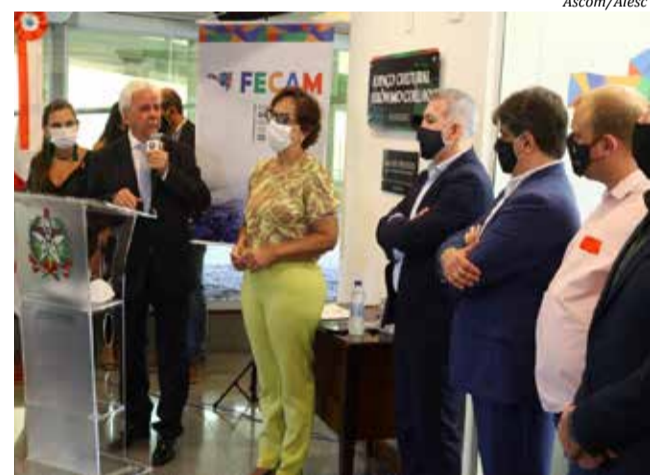
Posse da nova diretoria aconteceu terça-feira