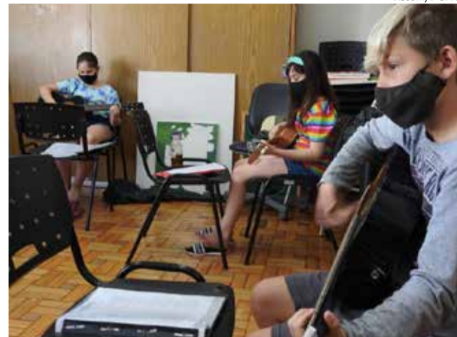
Atividades em várias áreas devem começar em breve