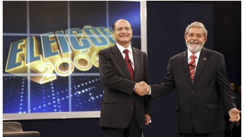
O eleitorado sabe o que todos fizeram nos verões passados

Levianamente antecipada sucessão presidencial de 2022 ainda vai produzir “tretas” inimagináveis. A oposição perdida e sem proposta para melhorar o Brasil, tem a certeza de que Jair Messias Bolsonaro é o candidato a ser batido. Se as pesquisas, no mínimo suspeitas, estivessem com resultado minimamente verdadeiro, os variados postulantes contra o presidente não estariam se comportando com tanto desespero em relação à febre para formar alianças impensáveis e estratégica-