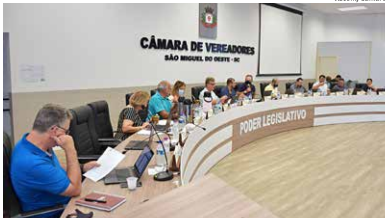
Vereadores aprovaram contas de 2020 em sessão exclusiva