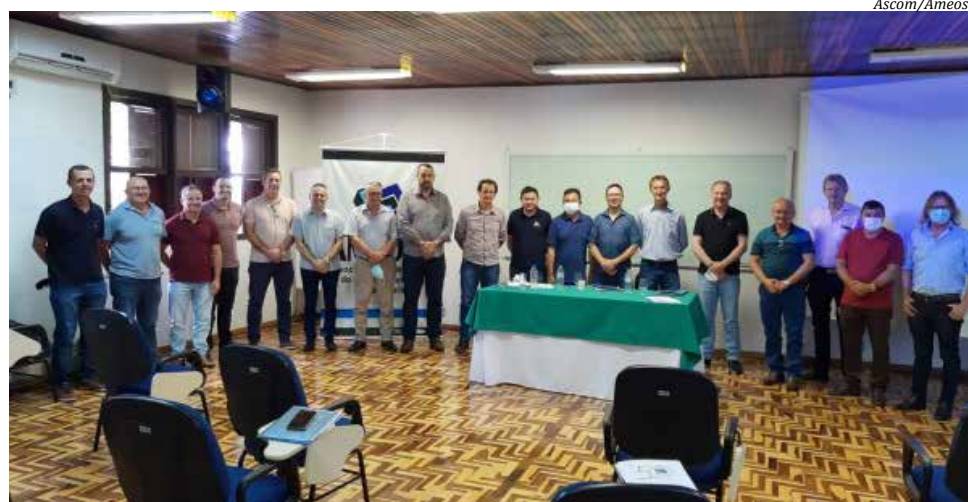
Assembleia foi realizada quinta-feira no Cetresmo

CLUBE ESPORTIVO GUARANI CNPJ 83.829.580/0001-51 Rua Marcílio Dias, 907, Centro. São Miguel do Oeste - SC CEP 89900-000