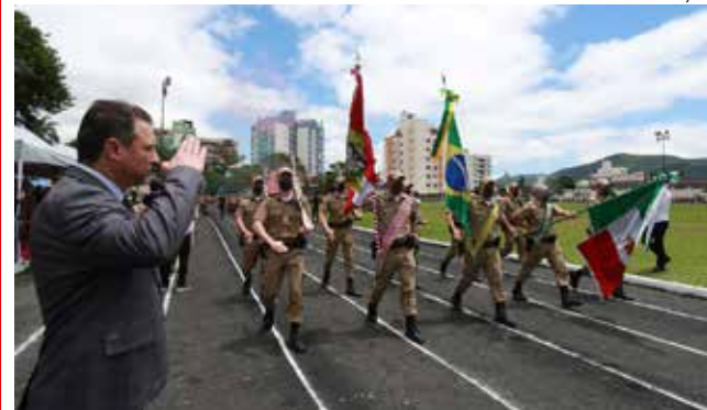
Formatura dos novos policiais aconteceu em Florianópolis, com a presença do governador Carlos Moisés