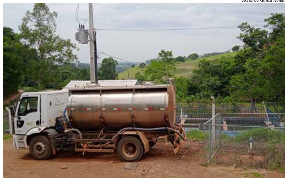
Caminhão pipa faz pelo menos 15 viagens diárias para levar água até a Estação de Tratamento

De acordo com a administração, a água que chega até a residência do morador de Santa Helena é de boa qualidade, graças ao esforço de toda a equipe