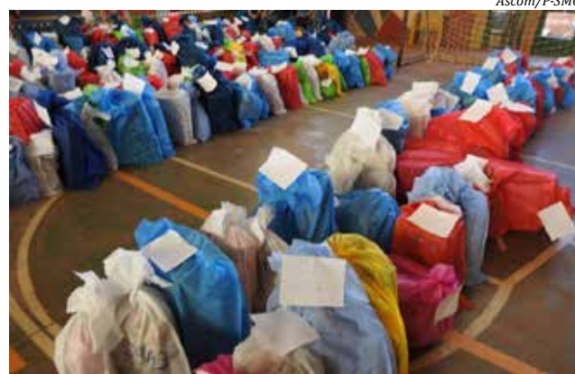
Presentes já estão prontos para serem entregues às crianças

Cada criança receberá o presente sugerido por ela própria e sua família no momento da inscrição, entre as opções de bola, carrinho, boneca ou