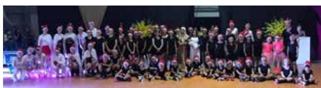
Grupo Magia sobre Rodas

Mesmo com o ingresso voluntário, foi arrecado o suficiente para 16 cestas básicas que foram distribuídas a famílias carentes pelo Papai e Mamãe Noel ontem antes da noite.