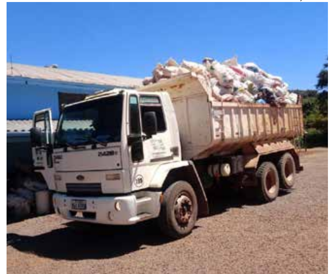
Próxima coleta de materiais recicláveis no interior de São Miguel do Oeste está prevista para o mês de março de 2022.