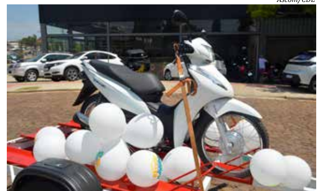
Carreata percorreu as ruas da cidade para divulgar os prêmios

A carreata de divulgação contou com a participação do Corpo de Bombeiros e da empresa Deny Gambatto Motors, patrocinadora da moto do sorteio final. Iniciada no dia 15 de outubro, a campanha diariamente está premiando diversos consumidores. Ao todo serão distribuídos entre as 279 empresas participantes, 963 vales compras instantâneos nos valores de R$ 50,00 e R$ 100,00, que totalizam mais de R$ 60 mil.