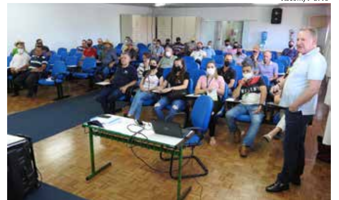
Decreto foi assinado durante reunião do Comder

"Percebemos que grande parte dos produtores não necessitavam, por exemplo, de serviços de máquinas em suas propriedades, ou de outros programas da Secretaria de Agricultura, e acabavam não obtendo o incentivo do Município. Agora, todos que emitirem notas receberão este retorno, por meio de um cartão que será disponibilizado aos beneficiários, e que poderá ser reinvestido no comércio local naquilo que realmente precisarem, e fazendo girar em nossa