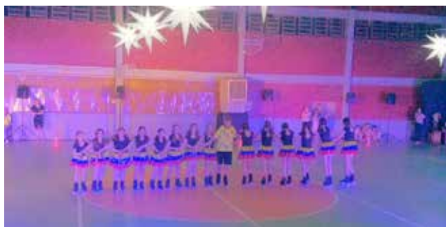
Grupo de Patinação Magia sobre Rodas em apresentação

A cidade de Descanso foi dividida em dois grandes eventos no último sábado à noite. Enquanto mais de 400 pessoas prestigiavam o Jantar Anos 60 da APAE no Clube Paroquial, outras 500 assistiram ao Show de Patinação do Grupo Magia Sobre Rodas e apresentações do Coral ECOAR no ginásio do Bairro Jaroséski.