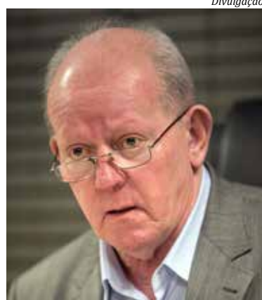
Deputado Marcos Vieira é o relator dos projetos de lei

A estimativa de receita total prevista para o próximo ano alcança R$ 37,1 bilhões, um acréscimo 21,64% em relação a 2021, com a despesa alcançando o mesmo montante. Conforme o relator, deputado Marcos Vieira (PSDB), o texto traz previsão de crescimento nas aplicações em áreas como educação e saúde, além de investimentos em habitação popular, na construção do complexo hospitalar de Florianópolis e no pagamento de R$ 150 milhões em bolsas de estudo para alunos do ensino médio da rede pública estadual. No relatório aprovado, o parlamentar incorporou um total de 1.903 emendas parlamentares