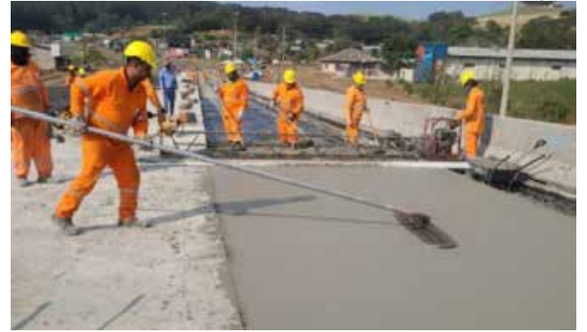
Referentes às obras da BR-163, os valores já pagos são de R$ 4.022.243,12