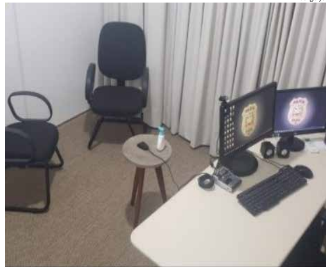
Sala é usada para depoimentos de crianças e adolescentes