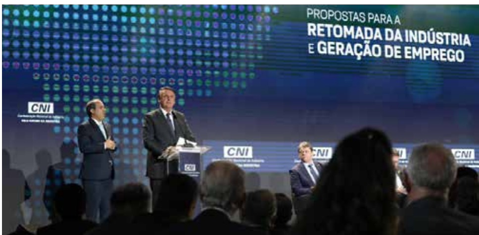
Empresários apresentaram propostas ao presidente Jair Bolsonaro, em Brasília