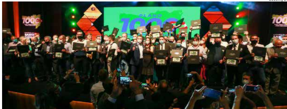
Novos investimentos do Estado foram apresentados a prefeitos, vereadores e demais autoridades

Segundo o governo, o evento de lançamento do 'Plano 1000', no Teatro do CIC, em Florianópolis, entra para a história como o início deste que é o maior projeto municipalista para Santa Catarina. Na primeira etapa, serão contempladas as 70 maiores cidades, mas o programa contemplará todos os municípios.