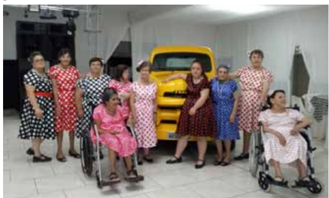
Alunas caracterizadas - Anos 60