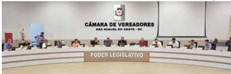
Câmara está realizando sessões esta semana e encerra as atividades de 2021

O orçamento para 2022, é 15% maior do que o valor projetado para este ano. A lei orçamentária de 2021 previa receita e despesa de R$ 192, R$ 36 milhões a menos. Como tradicionalmente, a Educa-