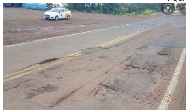
SC-163, no trecho de Iporã do Oeste a Itapiranga, está incluída no pacote

"Santa Catarina infelizmente tem um histórico de abandono das estradas, que resultou em vias até sem condições de trafegabilidade. Muitas delas