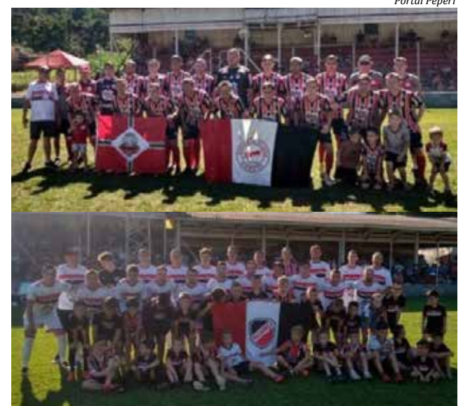
Cometa e Aliança decidem o título no Estádio da Montanha

Cometa perdeu para o Ouro Verde pelo placar de 1 x 0. Com a derrota, o Cometa ficou com três pontos na competição. Mais tarde, jogaram Aliança x Grêmio União. Neste jogo, o Grêmio União não conseguiu suportar a força do Aliança e o placar final foi 1 X 0, com gol de Boca. O Aliança é a única equipe com 100% de aproveitamento. Por critérios de desempate, a final será contra o Cometa.