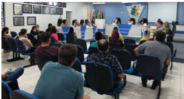
Sessão do Legislativo de segunda feira, dia 22

Já a oposição via no projeto mais uma oportunidade de o executivo vender os lotes e galpões a estranhos com quem os empresários de Descanso não podem competir, além de diminuir o patrimônio público.