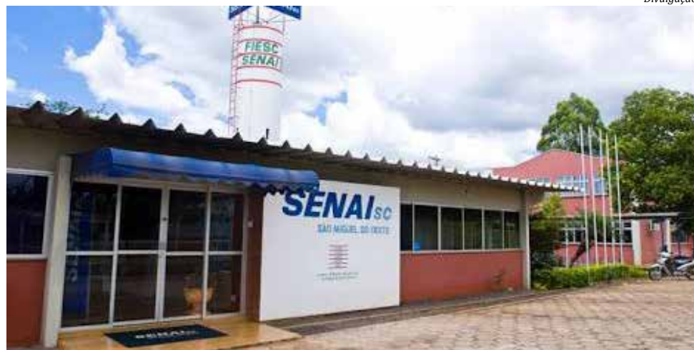
Unidade de São Miguel do Oeste oferece os cursos de Eletromecânica, Eletrotécnica e Segurança do Trabalho

No Estado, o Senai oferece cursos nestas áreas e também nas áreas de metalmeccânica, gestão, mecatrônica, celulose e papel, química, alimentos e bebidas, tecnologia da informação, segurança do trabalho, logística, polímeros, cerâmica e afins, construção civil, automotiva, refrigeração e clima-