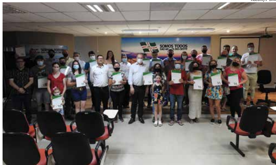
Matrículas de imóveis foram entregues às famílias beneficiadas segunda-feira