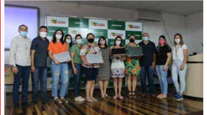
O ato simbólico da entrega ocorreu no auditório do Cemeg