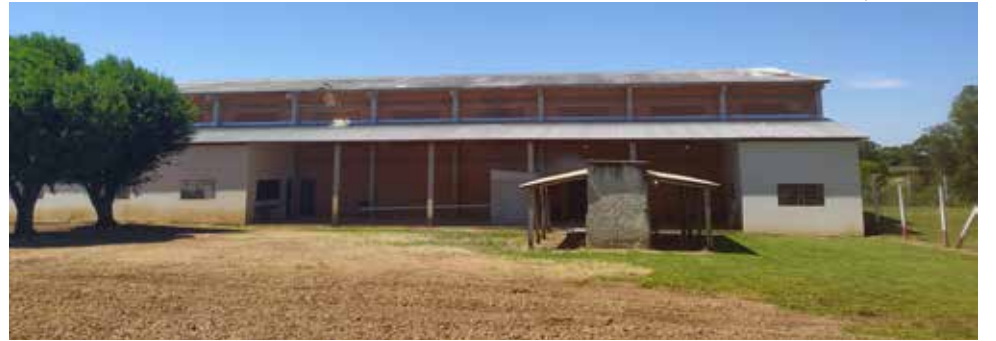
Ginásio Municipal de Esportes enfrenta problemas com goteiras

Hickmann informa que o município foi contemplado com transferência especial destes recursos, indicados pela deputada Luciane Car-