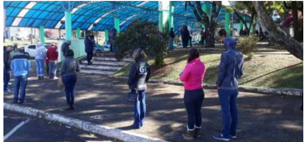
Vacinação aconteceu na Praça Valnir Bottaro Daniel durante todo dia de sábado