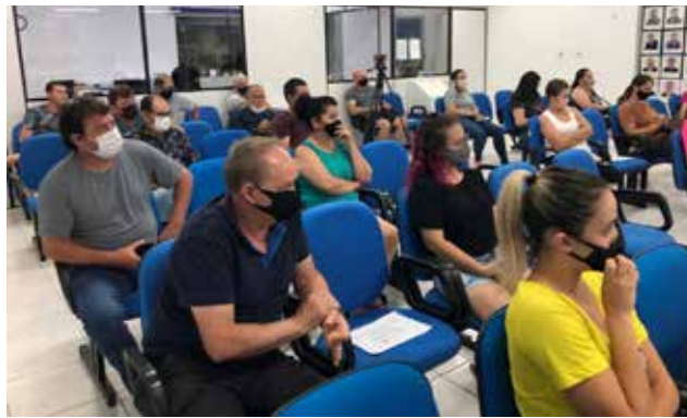
Auditório da Câmara estava lotado

O Projeto de Lei que é de 2018, já previa as possibilidades da Cessão Onerosa; Cessão não Onerosa, Incentivo às Empresas Locais e agora a possibilidade de venda dos Pórticos em construção.