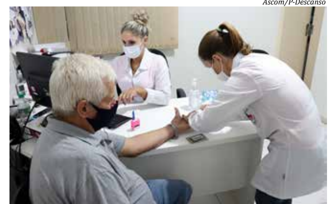
A ação foi realizada em parceria com o Lions Clube Descanso Mulher

Segundo ela, a ação teve por objetivo reforçar a conscientização a respeito da doença que afeta milhões de pessoas e principalmente evidenciar a