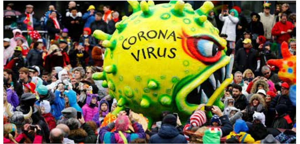
Apesar do vírus já estar circulando, Carnaval aconteceu em 2020

Todo mundo só é obrigado a fazer alguma coisa por força de lei. Você pode até questionar a legitimidade da legislação, mas é fundamental que, no mínimo, prevaleça a legalidade. Nosso ordenamento jurídico não tem regras obrigando alguém a tomar