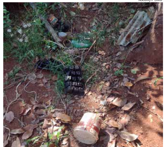
Nas visitas, ainda foram localizadas larvas em caixas d'água, potes e outros recipientes abandonados

"É apenas uma questão de capricho. Se cada um fizer um pouco, todos ficam seguros. Se houver um surto de mosquitos Aedes Aegypti, correremos sérios riscos, já que municípios vizinhos têm registro de casos da Dengue", afirmam os agentes.