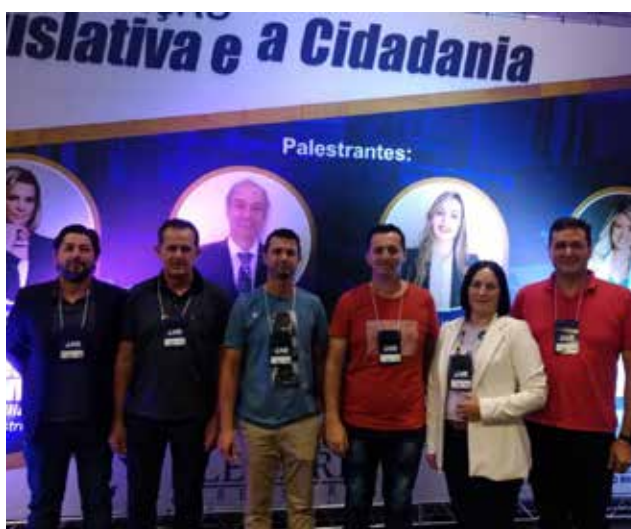
Vereadores de Descanso, integrantes da comitiva que esteve em Brasília