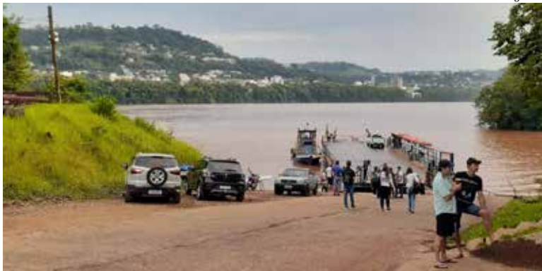
Atualmente, a travessia entre os dois estados é realizada com uma balsa

Antes disso, o governo federal precisa federalizar a SC-163, entre São Miguel do Oeste e Itapiranga, para viabilizar a construção da ponte. O trecho pertencente