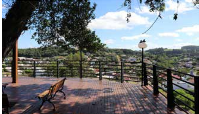
O projeto prevê a revitalização do acesso ao ponto turístico e da gruta