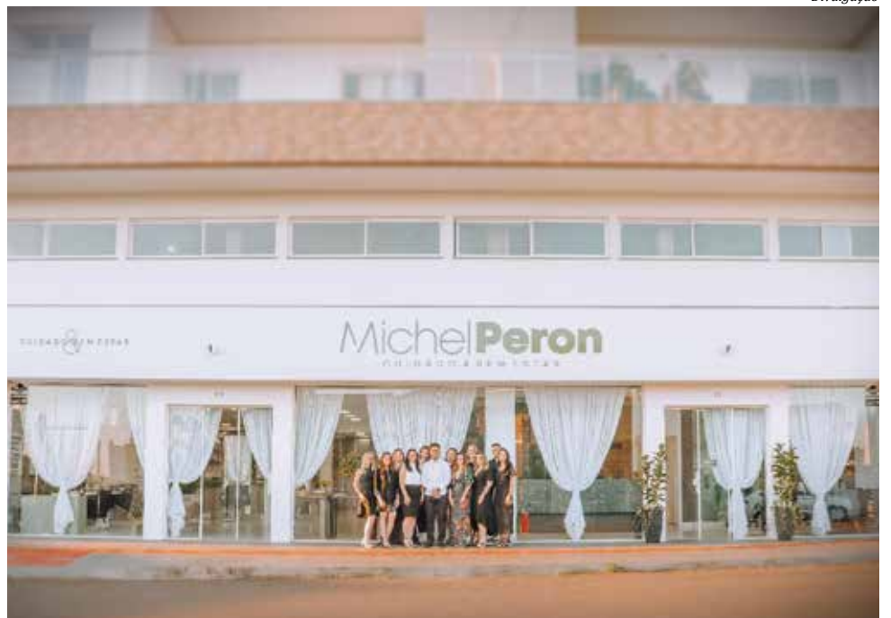
Salão está instalado na Rua Hélio Wassum, 316, sala 17