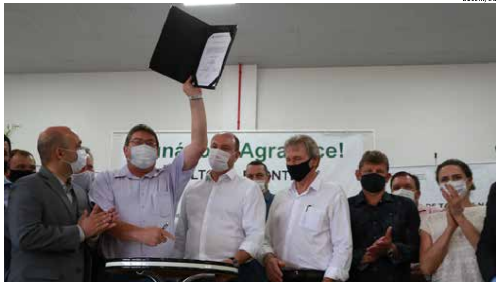
O prefeito de Tunápolis, Marino José Frey, comemorou a destinação de R$ 22 milhões para a obra