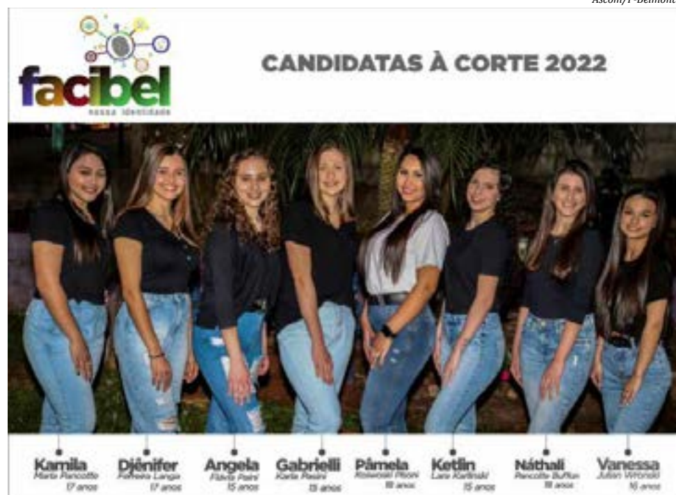
Oito meninas subirão na passarela, em busca das coroas de rainha e princesas

Um caminhão telão fará a exibição simultânea na praça central, onde familiares, torcidas e a população poderão se reunir para acompanhar o evento. As três escolhidas irão representar a Feira e o município a partir do dia 21 de novembro.