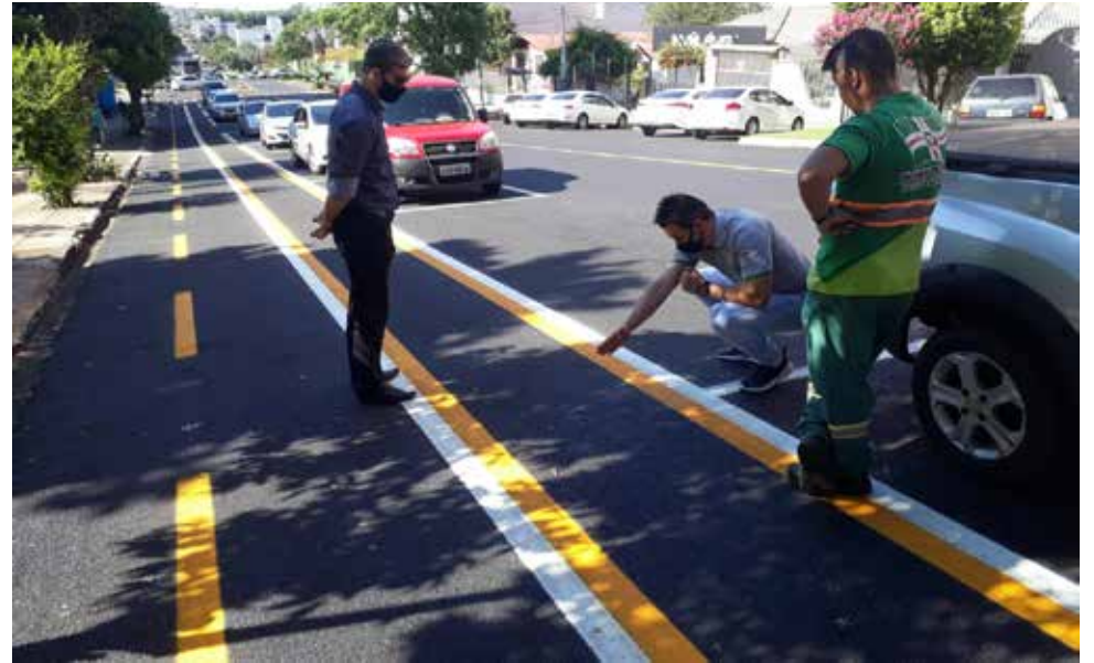
Antes de estender a ciclofaixa para a Rua Marcílio Dias, o município realizou a recuperação asfáltica total deste trecho