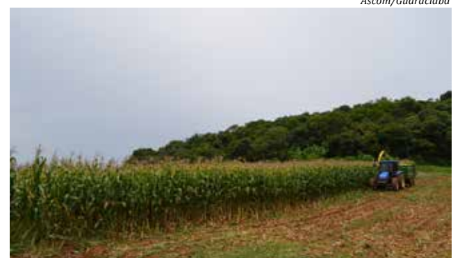
Os agendamentos para a silagem serão realizados até o dia 10 de dezembro

Os produtores precisam obrigatoriamente realizar esse agendamento, pois as horas de silagem precisam ser licitadas e a Secretaria necessita se basear nos dados dos agendamentos para