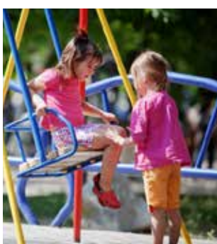
A atividade mais importante das crianças é brincar

Rosin destaca que as crianças têm direito a um mês de