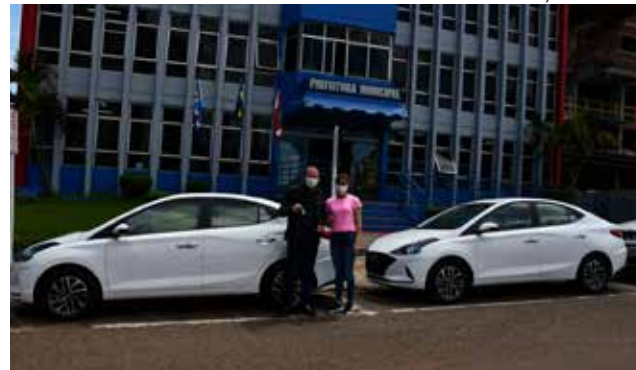
Os dois novos veículos têm investimentos de cerca de R$ 180 mil