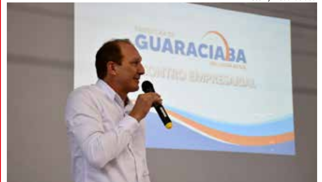
Prefeito Vandecir Dorigon explanou sobre os principais investimentos para 2022