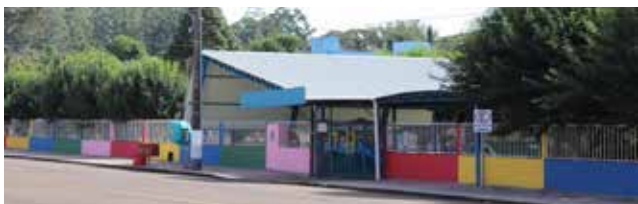
Moderna estrutura da creche Professora Gracinha

O objetivo é atender pais que trabalham e não tem com quem deixar seus filhos