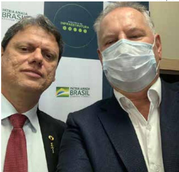
Garantia da federalização da SC-163 foi dada pelo Ministro da Infraestrutura, Tarcísio de Freitas, ao prefeito Wilson Trevisan

Para isso, o ministro solicitou aos prefeitos da região que mobilizem seus parlamentares para a destinação de emendas que garantam o custeio destes projetos, estimados em R$ 10 milhões a R$ 15 milhões. “O ministro compreendeu a relevância desta obra, tanto para a questão turística quan-