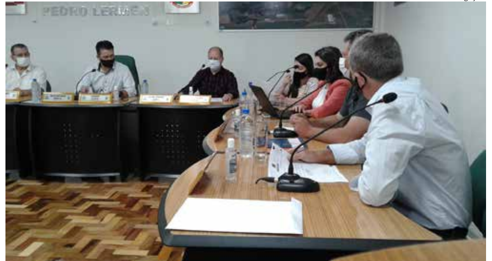
O projeto foi aprovado com três votos favoráveis e cinco abstenções

Várias cidades do Brasil estão exigindo o passaporte da vacina, assim como outros países e com a obrigatoriedade, segundo o autor do projeto, os moradores de Paraíso não terão restrição quando realizarem qualquer viagem mais longa.