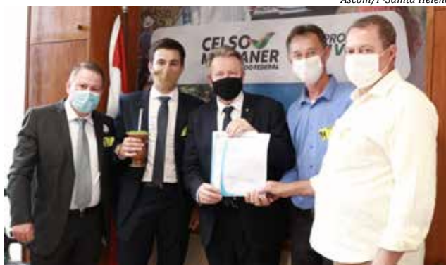
Comitiva entregou pedido de recursos ao deputado federal Celso Maldaner (C)

O pedido maior foi para os deputados Pedro Uczai (PT) e Celso Maldaner (MDB). O pleito encaminhado foi de emendas para garantir a aquisição de um trator de esteira. "Esses dois deputados já contribuíram muito com Santa Helena e