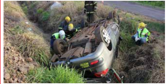
Carro capotou à margem da rodovia e teve perda total