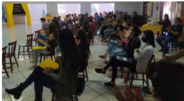
Plenária da Conferência Municipal de Educação-CONAE de Santa Helena.

Os trabalhos dos grupos de estudo possibilitaram os debates sobre a implementação do Plano Municipal de Educação (PME), analisando o cumprimento das metas e estratégias estabelecidas, bem como os avanços e desafios; além de propor emendas para a elaboração e aprovação do novo Plano Nacional de Educação 2024-2034.