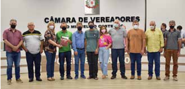
Membros da Associação dos Feirantes de São Miguel do Oeste receberam moção de aplauso da Câmara de Vereadores