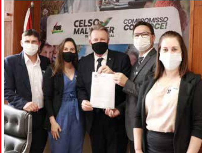
Comitiva entregou reivindicações no gabinete do deputado federal Celso Maldaner