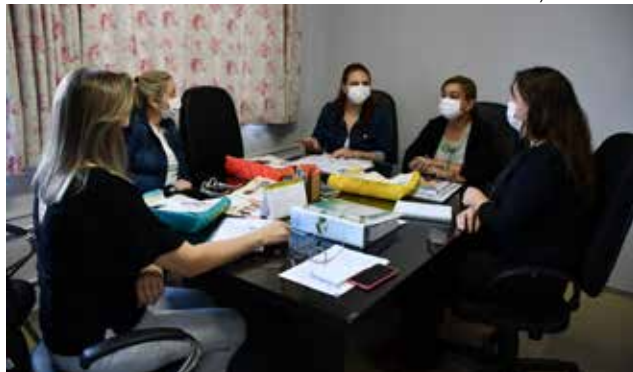
Adoção dos materiais da Editora Aprende Brasil foi tema de reunião

Após a análise desse material pela equipe pedagógica, o mesmo será apresentado para todos os