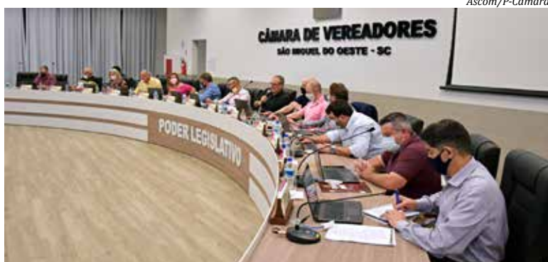
Projeto foi aprovado por maioria dos votos na sessão de terça-feira

A prefeitura notificou a cooperativa para encerrar o contrato e deixar local em razão do desvio de finalidade, já que a estrutura vinha sendo utilizada para beneficiamento de grãos apenas para pessoas jurídicas. Como a Oestebio não aceitou, o município ingressou com uma ação de reintegração de posse, que foi deferida