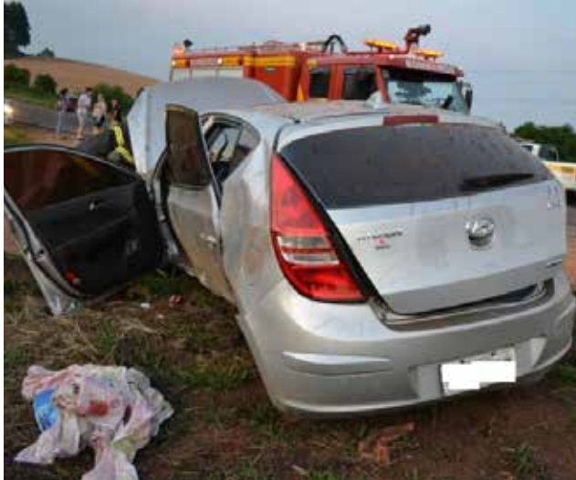
O carro ficou destruído.

As consequências poderiam ter sido piores. A saída de pista seguida de colisão em barranco deixou um homem ferido na noite desta segunda-feira (27), por volta das 18h15, na SC-163 na comunidade de Linha Campinas, no município de Descanso.