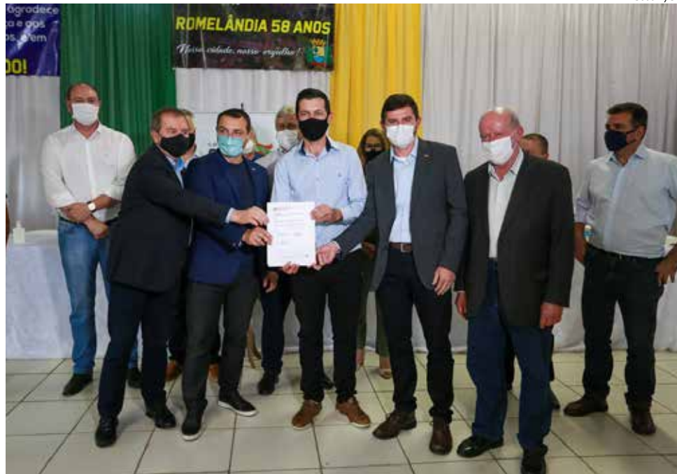
Junto a outras autoridades, Carlos Moisés fez a liberação de recursos para a região

Durante o ato, o governador Carlos Moisés oficializou ainda mais de R$ 22,8 milhões para 11 municípios da região. Os projetos das cidades incluem obras de infraestrutura, educação, serviços de saúde, desenvolvimento social, entre outros.