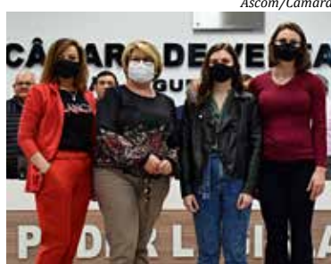
Integrantes do órgão foram empossados quinta-feira

O como objetivo principal é a defesa dos direitos da mulher, estimular o empoderamento da mulher, a igualdade de participação de gênero no parlamento, a implementação de políticas para as mulheres, audiências públicas, pesquisas e estudos sobre violência e discriminação contra a mulher.