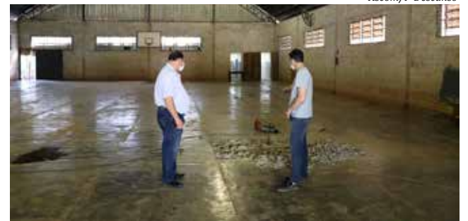
Obra irá abranger ampliação dos banheiros, nova quadra, pintura e outras melhorias

A obra irá abranger a ampliação dos banheiros, melhorias na estrutura, nova quadra, pintura de paredes, troca de portas e janelas internas e melhorias nas instalações elétricas.