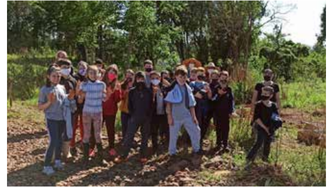
Estudantes do 5º ano da Escola Municipal Cinderela participaram das atividades