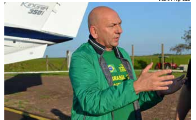
Luciano Hang esteve na cidade na semana passada

em seu jato particular no Aeroporto Hélio Wassum e deu entrevista a órgãos de imprensa da cidade. Ele disse que o local de sua preferência para instalação da Havan é o terreno localizado no entroncamento das BR's 163 e 282. Entretanto, essa área foi vetada pelos órgãos ambientais por ser local de mata nativa.