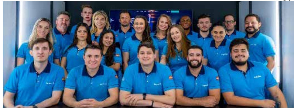
A Iopoint tecnologia, de São Miguel do Oeste, foi uma das eleitas para expor no evento

Nesta edição foi disponibilizado pelo Sebrae o espaço "Deu Match" para acolher startups que foram contempladas com estande para participação como expositoras na Mercopar 2021. A Iopoint tecnologia, de São Miguel do Oeste, foi uma das eleitas neste processo