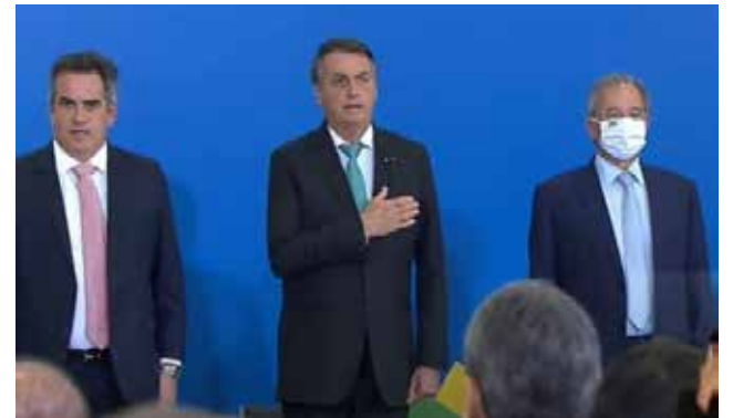
O presidente Jair Bolsonaro ao lado dos ministros Ciro Nogueira (Casa Civil) e Paulo Guedes (Economia), em evento que marcou os primeiros mil dias de seu governo

Em comparações indiretas, sem citar os nomes de