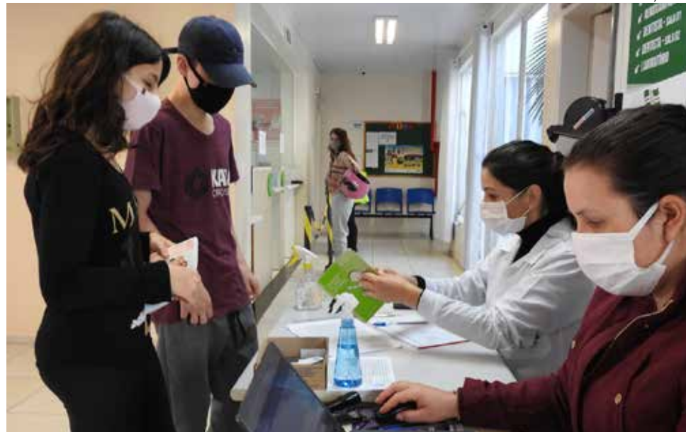
Foram imunizadas 943 pessoas no sábado

Para receber a vacina, os pacientes devem ir até o posto que pertencem, observando o intervalo de pelo me-