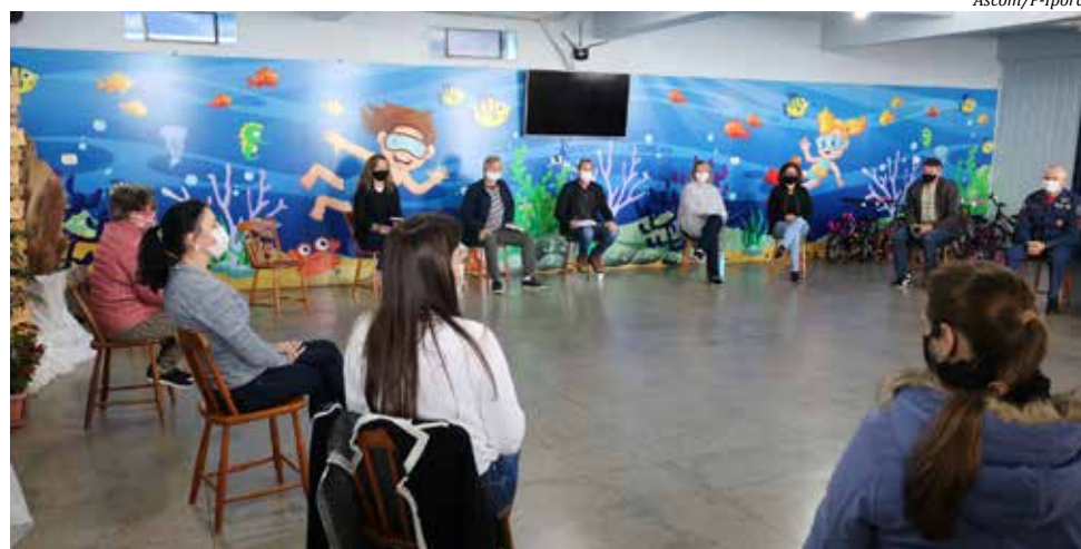
Programação foi discutida em reunião conjunta

Para o dia 07 de Setembro, a programação inicia com alvorada festiva, pela Fanfarra Muni-