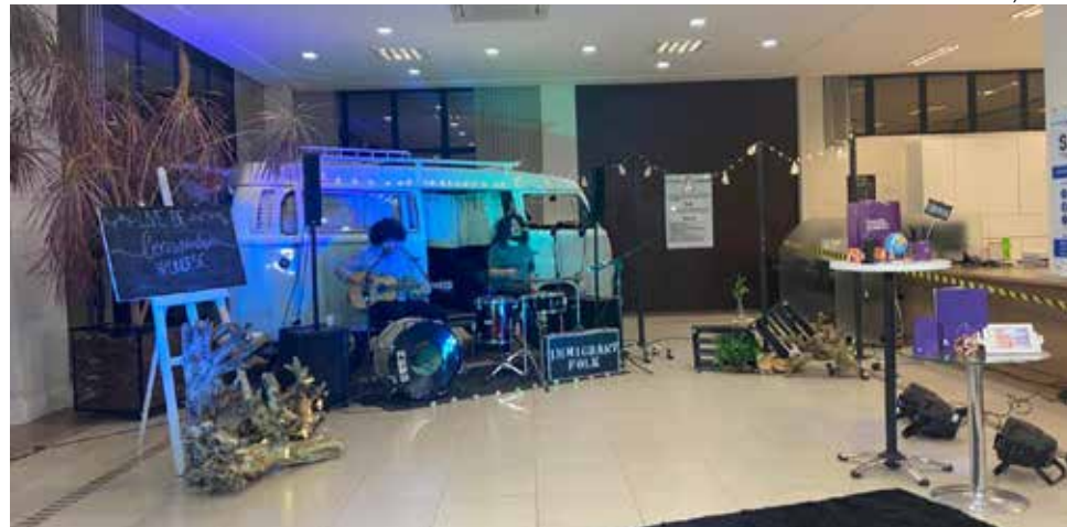
A live contou com a animação da banda Immigrant Folk