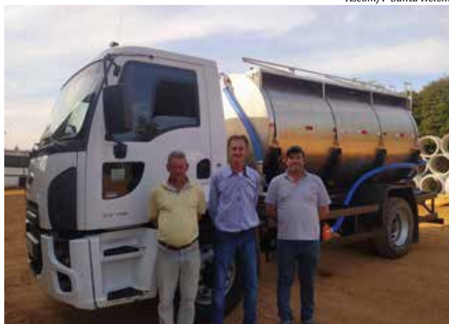
Tanque para o transporte de água foi instalado em um caminhão que a prefeitura já possuía