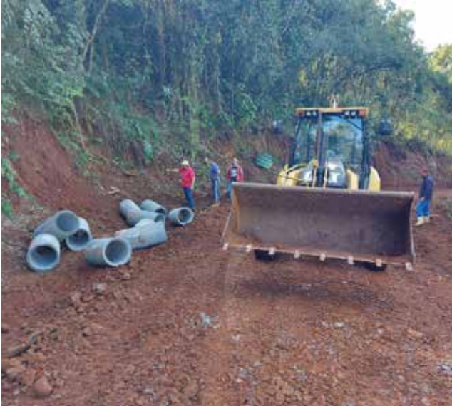
Obras de infraestrutura no interior alavancam a produção