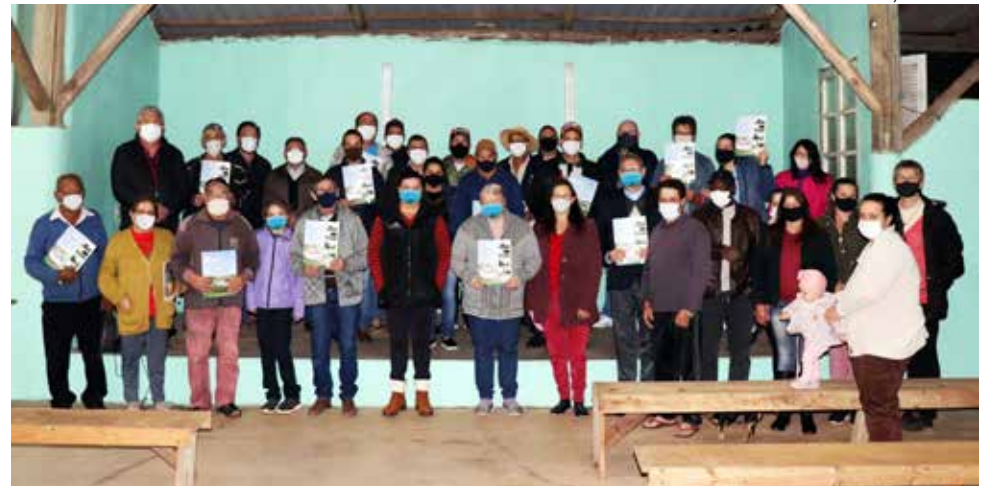
Com a escritura em mãos, os proprietários poderão acessar financiamentos e solicitar melhorias na infraestrutura do Bairro