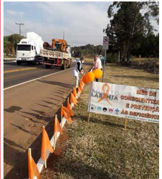
A entidade iniciou o mês com colocação de cartazes, faixas e bandeiras na cor laranja no trevo e praças da cidade