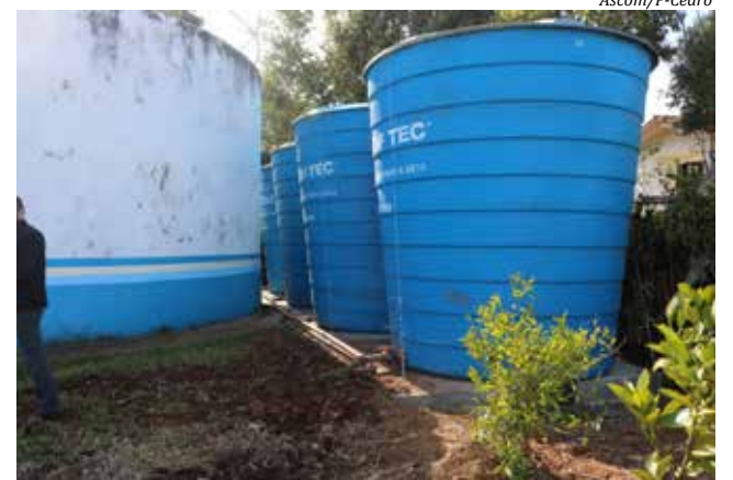
Administração fez estudos e decidiu ampliar para mais um reservatório de 20 mil litros, totalizando 80 mil litros de reserva

Ele destaca que a equipe vem analisando o crescimento do município e exigindo caixas de reserva também em novos lotea-