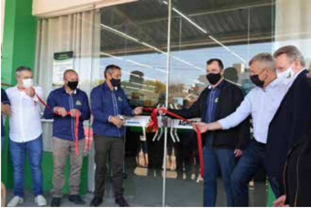
Inauguração do novo empreendimento aconteceu na manhã de sábado