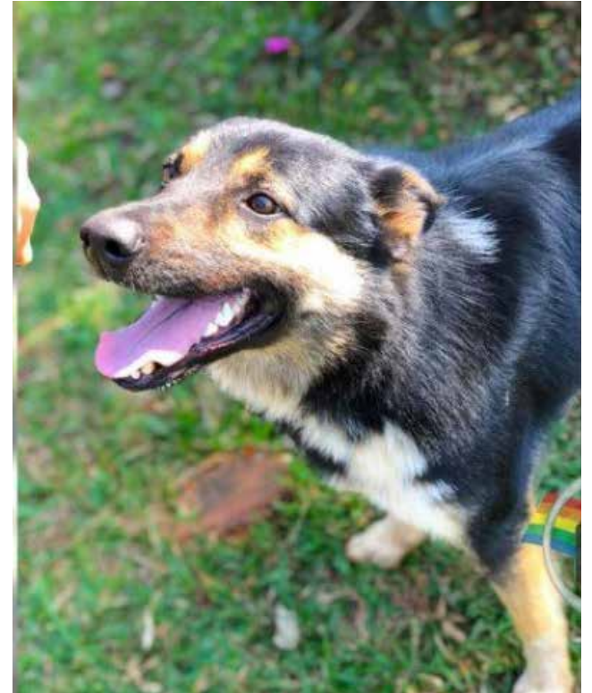
Cão abatido havia sido adotado pela família há cinco anos