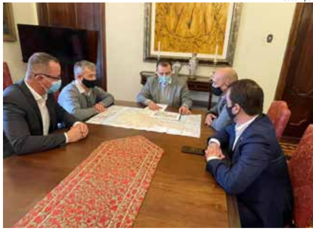
Projetos foram discutidos em reunião nas secretarias de Estado da Infraestrutura, Fazenda, Administração e Casa Civil

Também foram discutidos os investimentos estaduais nas BRs-163, 470 e 280. Há dois meses, o governo do Estado propôs, com aprovação da Assembleia Legislativa, um aporte de R$ 350 milhões para acelerar as obras nessas rodovias federais. Pela proposta, os investimentos se concentram nos trechos considerados prioritários pelas lideranças regionais, como os lotes 1 e 2 da BR-470, para os quais estão previstos R$ 200 milhões.