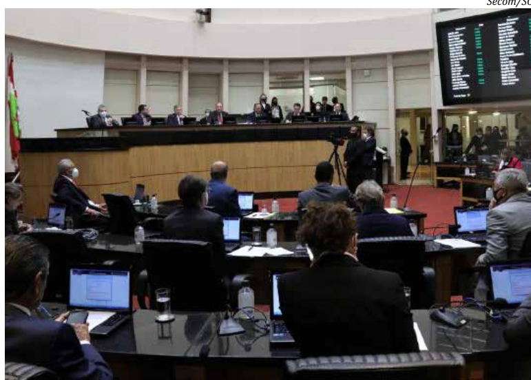
Reforma da Previdência foi aprovada por ampla maioria pelos deputados

Antes da aprovação, a proposta, que foi objeto de discussão em uma audiência pública,