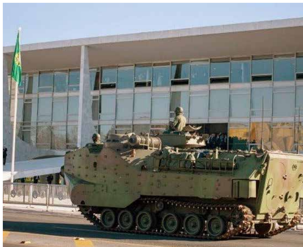
Uma clássica sala de aulas nos idos tempos da "Ditadura"

A passagem de tanques pela Esplanada e o estacionamento em frente ao Palácio do Planalto é simbólica, sim. Pela demonstração de que a Constituição tem que ser obedecida e que o presidente da República é o comandante das Forças Armadas, como sempre, e que não há o que temer. Os tanques, carros de combate e equipamentos militares foram aplaudidos por onde passaram na região do Distrito Federal, mas assustaram o Congresso e o