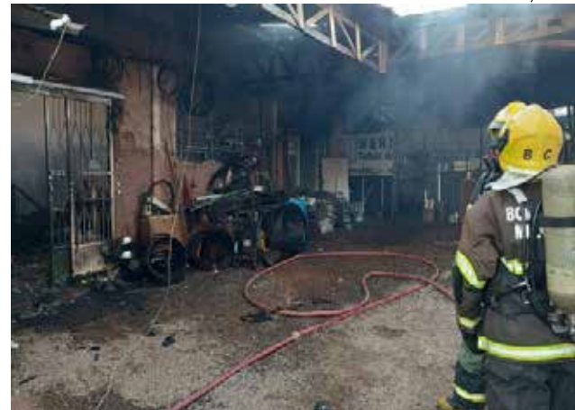
Incêndio ocorreu por volta das 6h30, no Bairro Salete