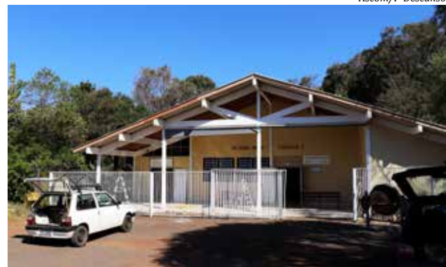
Obra deve ser finalizada em outubro deste ano

Conforme o prefeito Sadi Bonamigo o governo municipal sempre buscou atender os idosos da melhor maneira possível, dando condições para que envelheçam com saúde e alegria, pensando sempre em seu bem-estar. "Temos um compromisso com a terceira idade pelo trabalho e dedicação ao nosso município. Em reconhecimento a suas trajetórias