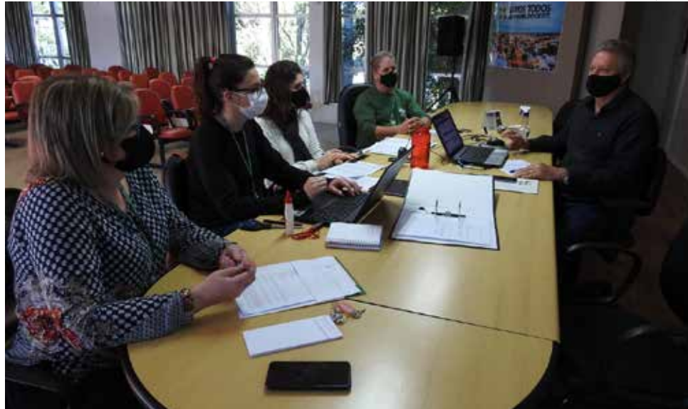
Comissão formada irá analisar os pedidos de auxílio

Para enquadrar-se, a família deve possuir somente um imóvel e residir nele. Além disso, deve estar inserida no Cadastro Único, possuir renda máxima de três salários mínimos entre todos os moradores da casa e ter algum integrante acometido por doença grave, listada na Lei 7.811/2021.