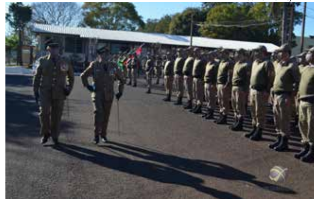
Solenidade de passagem de comando foi realizada terça-feira