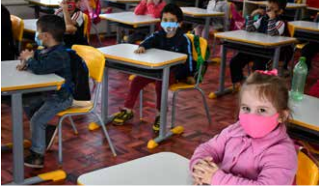
Alunos voltaram às salas de aula cumprindo os protocolos de segurança