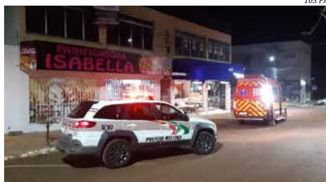
Polícia foi chamada após a ação, mas bandidos não foram encontrados

Após praticar o crime, eles fugiram a pé. Uma câmera de videomonitoramento flagrou o momento em que a dupla entrou na panificadora. A Polícia Militar atendeu a ocorrência e fez buscas junto com a Polícia Civil, mas os suspeitos ainda não foram localizados.