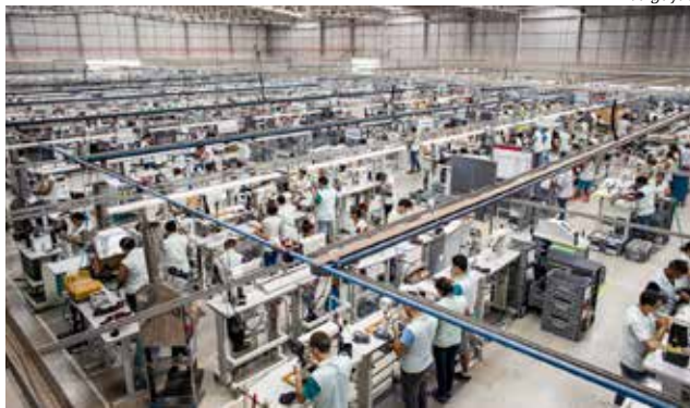
No saldo acumulado do ano, a indústria geral registrou 55.962 novas vagas

“O resultado demonstra a força da indústria e da construção catarinense na manutenção do ciclo de expansão da atividade econômica. O número também reflete a importância do setor para a economia catarinense, uma vez que somos responsáveis por 27% do PIB estadual, e acabamos induzindo o desenvolvimento do nos-