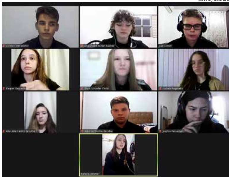
Sessão foi realizada terça-feira de forma remota