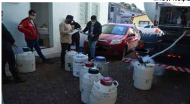
Abastecimento mensal aconteceu segunda-feira