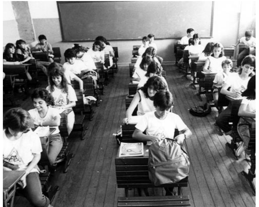
Uma clássica sala de aulas nos idos tempos da “Ditadura”

2. O segundo deles mescla as áreas do conhecimento com a qualificação profissional, via Novotec Expresso, e permite aprofundamento curricular em uma das áreas do conhecimento e dois certificados profissionalizantes durante o ano. São cursos de 150 horas relacionados a programação, design, da-