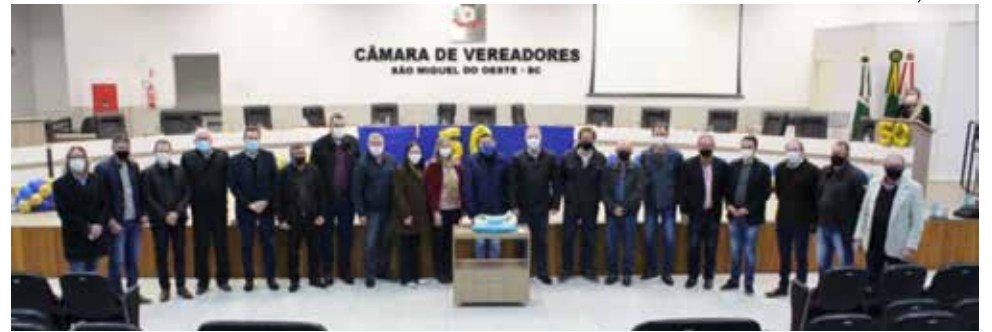
Solenidade comemorativa aos 50 anos da entidade foi realizada sexta-feira, na Câmara de Vereadores

Ele destacou em sua fala que é importante a proximidade entre a Federação e os municípios e