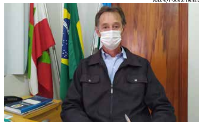
Prefeito Blásio Hickmann

Para viabilizar a instalação da rede, projeto