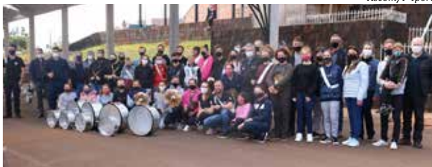
Entrega dos novos instrumentos ocorreu na tarde de sábado

A entidade recebeu 12 novos equipamentos, entre bumbos, caixas de guerra e pratos bronze. Somando a manutenção que já havia sido feita anteriormente e as novas aquisições, o investimento foi de R$ 7.578,00. Foi realizada também a promoção de integrantes