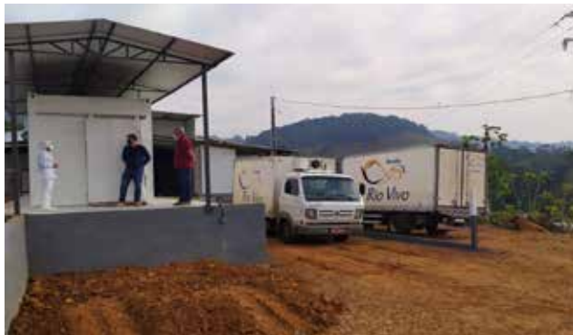
Investimento na indústria de pescados