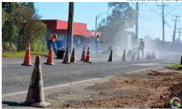
Trabalhos para instalação dos redutores iniciaram domingo

Em dezembro de 2020, os equipamentos haviam sido removidos devido a suspensão do convênio firmado entre a prefeitura e o Dnit. Sete meses depois, o trecho urbanizado da BR-163 contará novamen-