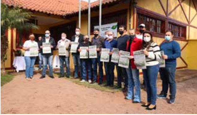
Autoridades da região participaram do ato realizado sexta-feira