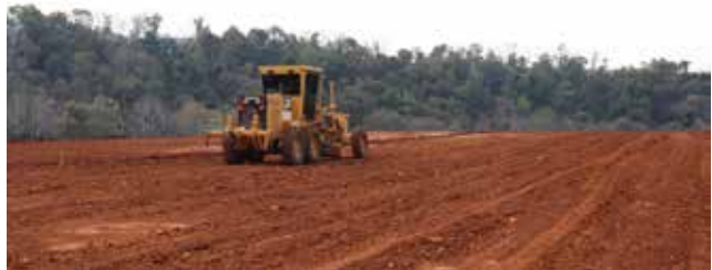
Programas de incentivo fortalecem os investimentos no município