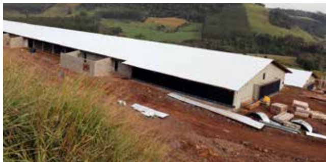
Moderna granja de suínos em construção

Já o setor da Indústria e Comércio também cresceu exponencialmente, chegando a um aumento de 24,12%. O valor total em 2020 foi de R$ 43.985.576,53, o que representa um aumento de R$ 10.609.310,07 em relação a 2019.