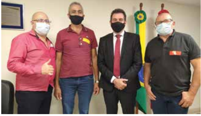
Comitiva foi recebida pelos deputados nos gabinetes