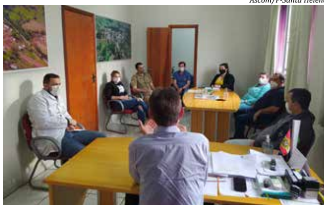
Medidas foram definidas em reunião na semana passada

A concentração de pessoas em espaços públicos de uso coletivo, como parques, praças e afins também está proibida, assim com a prática do comércio ambulante de porta em porta. O decreto também estabelece mudanças no