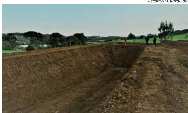
Um dos empreendimentos visitados nos últimos dias fica localizado em Linha Liso Baixo

Dorigon destaca que esses investimentos por parte dos produtores rurais animam a administração. “É um sinal de que os produtores rurais estão acreditando na força do agronegócio e também na força do nosso município, uma vez que é aqui em Guaraciaba que estão investindo”, ressaltou Dorigon.