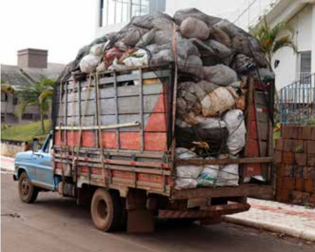
A campanha foi realizada entre o dia 21 de junho e 02 de julho e atendeu todas as comunidades do interior