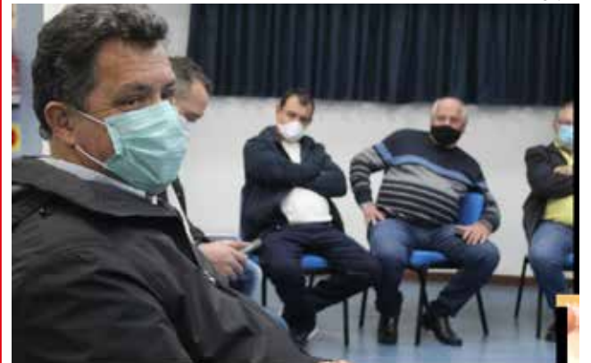
Encontro aconteceu no Hotel Solaris, na noite de segunda-feira