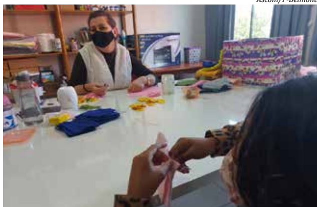
Os trabalhos também atenderão o Serviço de Proteção e Atendimento Integral à Família

O atendimento é realizado para turmas pela manhã e a tarde, com 1h30 cada grupo, formado com, no máximo, cinco alunos e respeitando as determinações de prevenção à Covid-19.