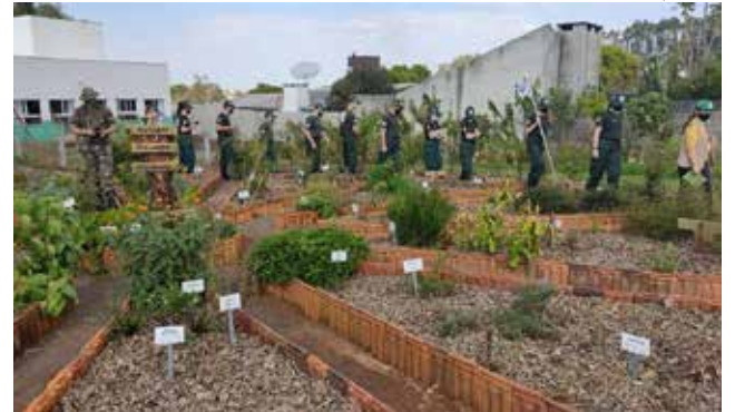
A turma teve a oportunidade de conhecer o Horto Medicinal, a diversidade de plantas bioativas