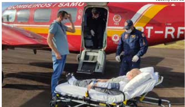
A transferência via aérea do paciente foi feita domingo