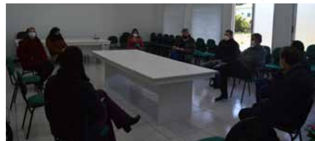
Reunião discutiu o excesso de atendimentos no Hospital de Tunápolis