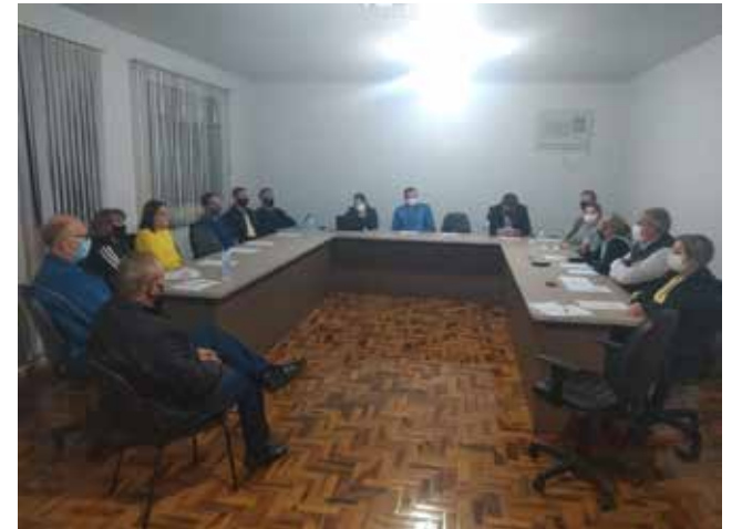
Reunião da equipe que dirige a Fundação Médica de Descanso e Belmonte

A reunião foi encerrada e ficaram os depoimentos de todos os participantes que disseram estar dispostos a trabalharem unidos e com total disposição para o crescimento ainda maior, da Fundação Médica. Ganha com isso, a população que, confiante, também continuará a fazer sua parte e desfrutando de um atendimento de boa qualidade.