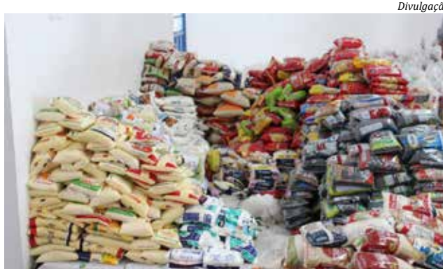
As sete toneladas serão distribuídas às famílias carentes da cidade