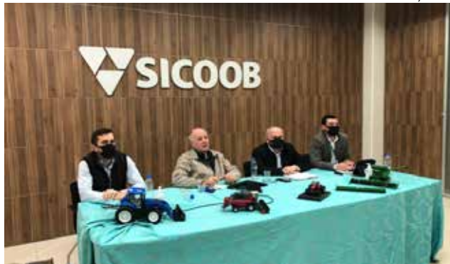
Direção da Sicoob São Miguel apresentou as projeções em encontro virtual com a imprensa dos três estados do Sul