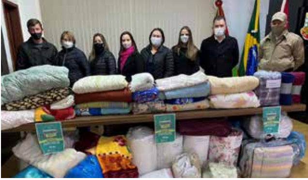
Material de doação foi entregue quinta-feira, na prefeitura