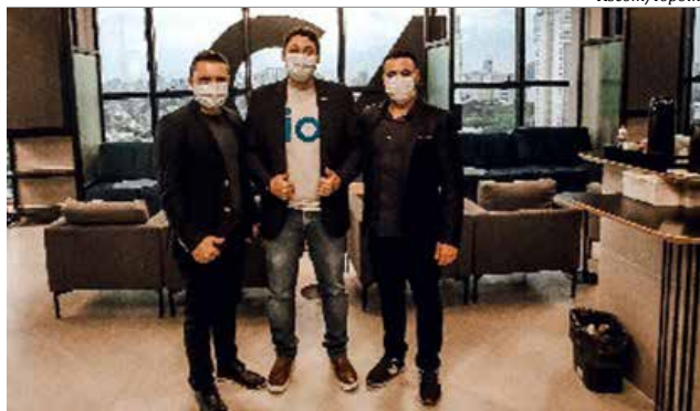
Direção participou do evento Gestão G4, em São Paulo

"A educação corporativa é fundamental para o sucesso dos negócios.