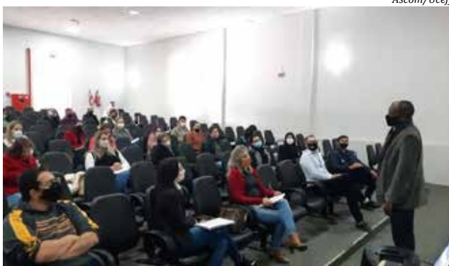
As atividades visam atender as demandas das Coordenadorias Regionais de Educação (CRE's)

A Instituição está planejando para o segundo semestre mais pales-