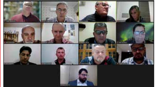
Projeto foi aprovado por maioria em sessão remota