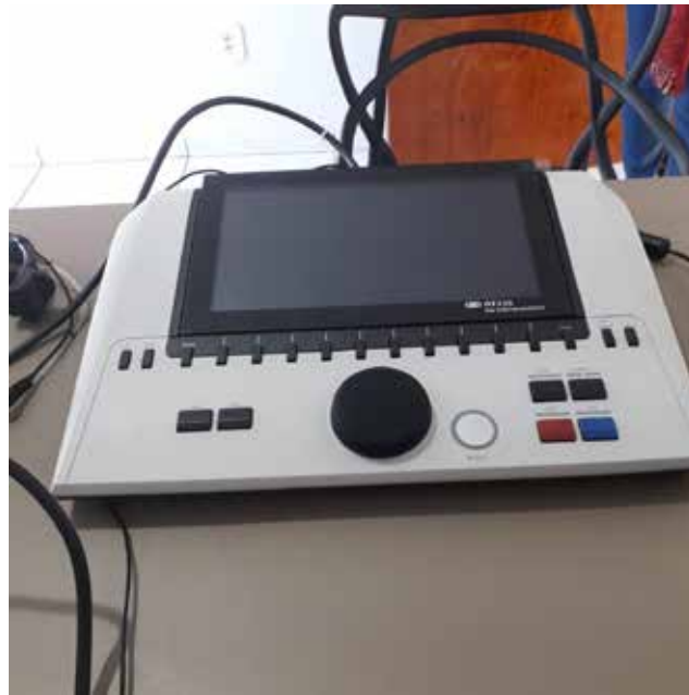
Aparelho recentemente instalado na Apae de Descanso