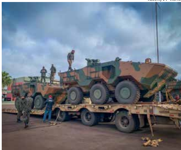
Os blindados Guaranis, que chegaram a São Miguel do Oeste na semana passada, são capazes de transportar até 11 militares em cada unidade

A máquina conta, ainda, com transmissão automática de seis velocidades à frente, desenvolvendo 90 km/h de velocidade máxima. Além do diesel, o motor do blindado também opera com querosene de aviação ou combinação de ambos em qualquer proporção. Possui sistema automáti-