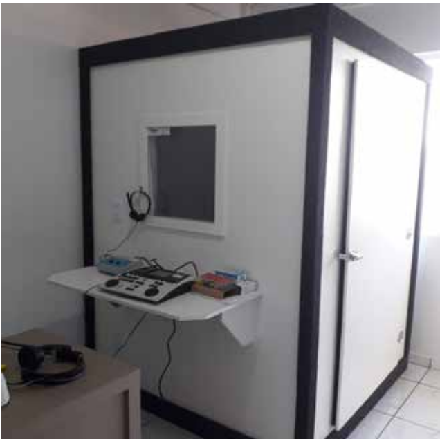
Cabine onde os alunos receberão atendimento

A Federação das Apaes do estado de Santa Catarina destinou ao Centro de Atendimento Educacional Especializado em Educação Especial (CAESP) de Descanso um moderno aparelho de audiometria e impedanciometria. Este equipamento será utilizado para fazer a audiometria dos alunos da instituição que tiverem problemas auditivos.