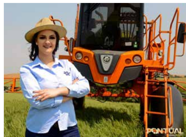
A diplomada da Unoesc conquistou o 2º lugar no processo seletivo para cursar o mestrado