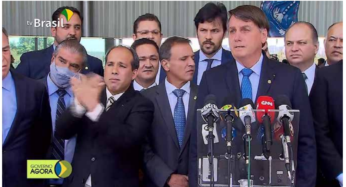
Na disputa pelas duas casas legislativas, Bolsonaro levou a melhor

Na dança das cadeiras do Congresso Nacional, o presidente Jair Messias Bolsonaro impôs uma humilhante derrota aos seus desafetos. Portanto, é hora de saber quem ganhou e quem perdeu nas eleições da Câmara e do Senado. O senador Rodrigo Pacheco (DEM-MG) enfrentou Simone Tebet (MDB-MS), após os demais candidatos desistirem. Na Câmara, a disputa foi mais tensa. Oito deputados se candidataram. O então presidente da Casa, Rodrigo Maia (DEM-RJ), chorou em discurso de despedida.