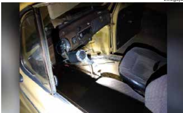
Além do péssimo estado de conservação, o carro não tinha volante

O que chamou a atenção durante o atendimento da ocorrência foi as condições do veículo, que estava com