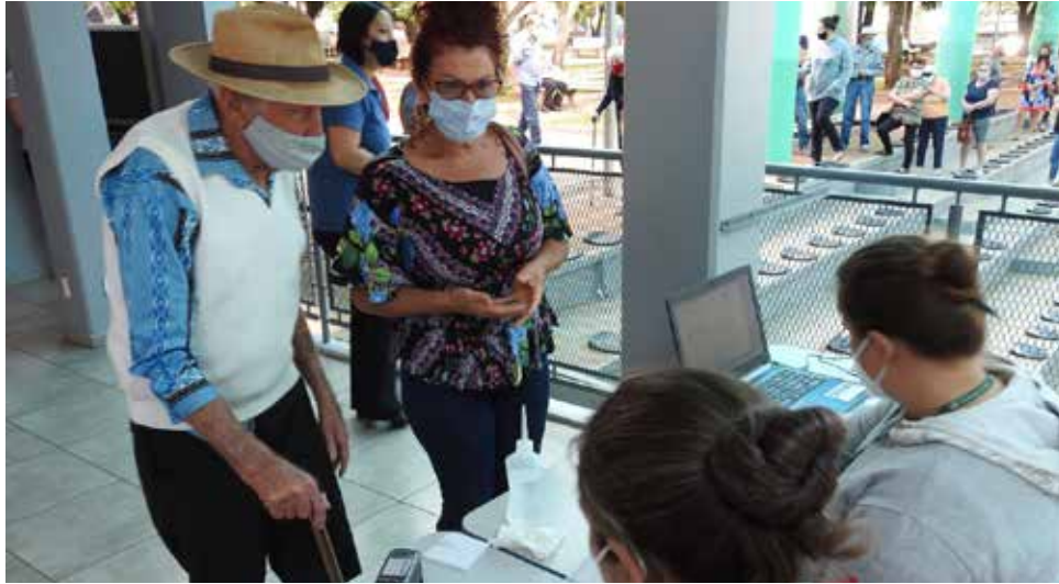
Um grande número de idosos se dirigiram até a praça para receber a imunização