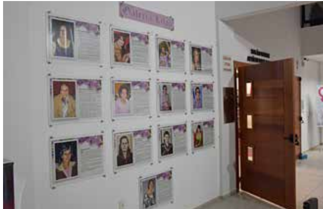
Com a rejeição, este ano a Galeria Lilás não será renovada