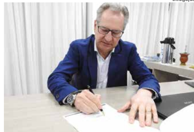
Prefeito Wilson Trevisan gravará mensagem que será veiculada em redes sociais

facultativo na terça-feira de Carnaval, 16. Todas as repartições públicas municipais estarão abertas. O governo de Santa Catarina também decidiu revogar os dispositivos que previam ponto facultativo aos servidores estaduais nos dias do Carnaval 2021. Com isso, o período de será de trabalho normal. Antes, o decreto estadual previa folga entre nos dias 15, 16 e 17 de fevereiro.