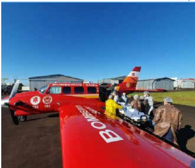
A operação segue nos próximos dias para atender com maior agilidade aos pacientes que necessitam de leitos hospitalares

A operação segue nos próximos dias para atender com maior agilidade aos pacientes que necessitam de leitos hospitalares. Já na tarde de domingo, um paciente foi transferido via aérea pela aeronave Arcanjo 2 de Chapecó para o município de Itajaí.