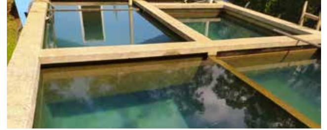
Atualmente são consumidos em torno de 300 mil litros de água tratada por dia em Santa Helena

Atualmente são consumidos em torno de 300 mil litros de água tratada por dia em Santa Helena. A administração municipal tem