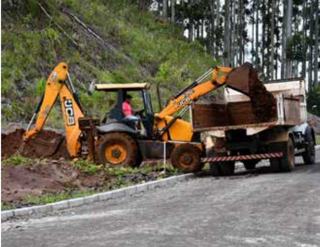
Secretarias trabalham em diversas frentes