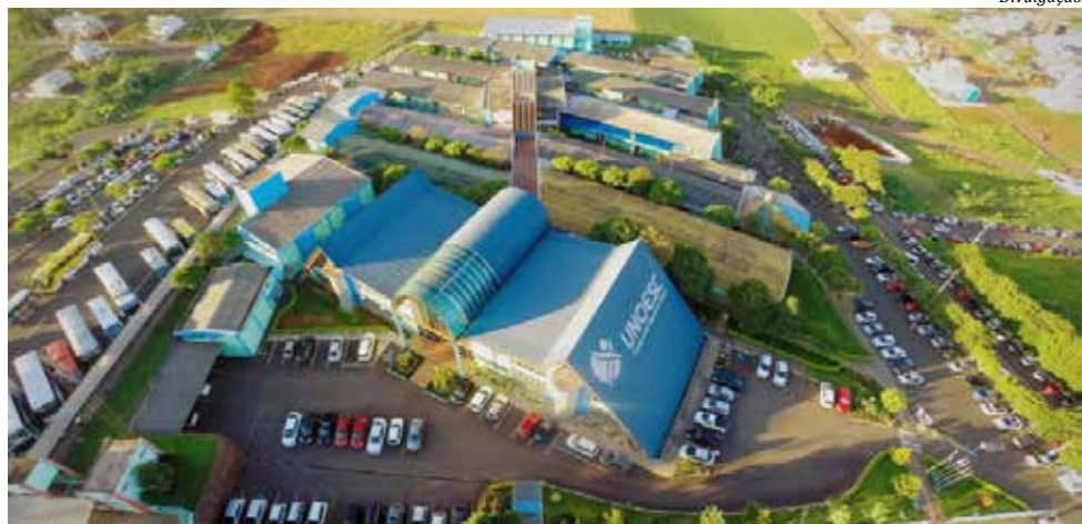
As aulas presenciais serão retomadas a partir do dia 1º de março

Também foi feito um vultoso investimento em tecnologias, que pretendem fornecer de modo on-line,