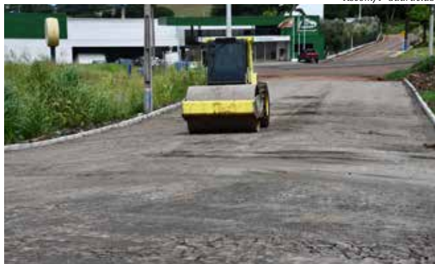
As melhorias na área industrial Alfredo Gabriel Rossetti iniciaram no último ano