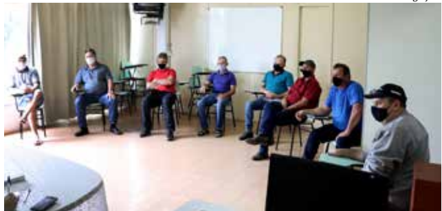
As empresas foram orientadas em relação as suas responsabilidades de segurança no combate à Covid-19