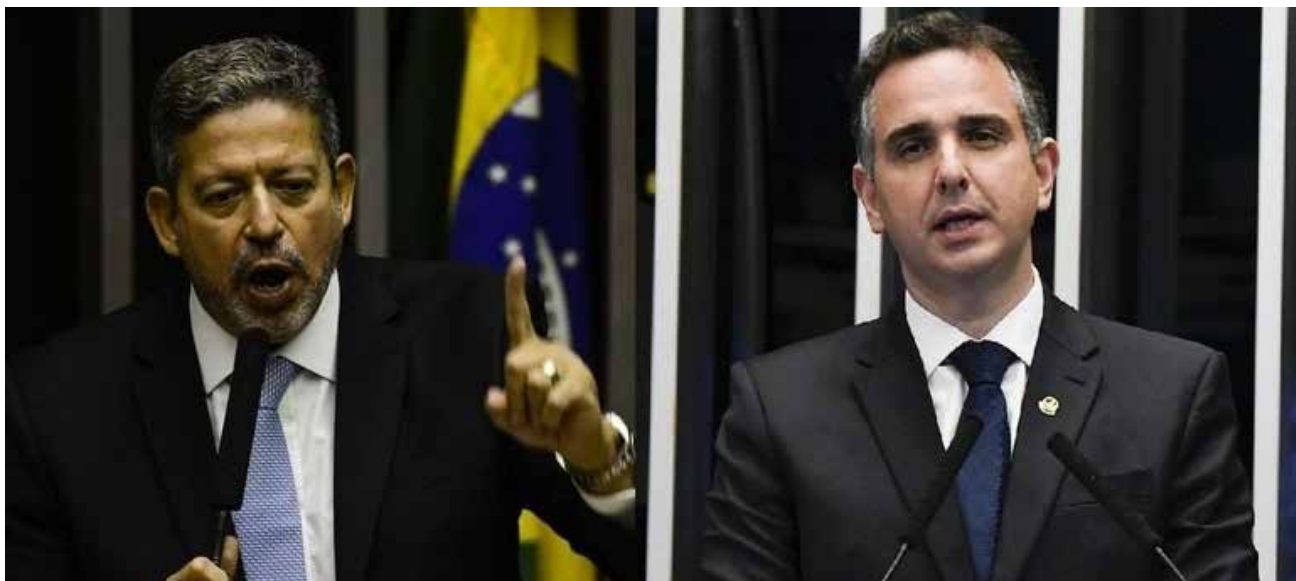
Arthur Lira, novo presidente da Câmara dos Deputados, e Rodrigo Pacheco, novo presidente do Senado

Arthur Lira (PP-AL) foi eleito presidente da Câmara e Rodrigo Pacheco (DEM-MG) comanda o Senado pelos próximos dois anos