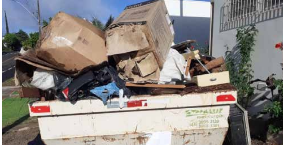
Containers colocados em bairros é uma das ações para evitar o acúmulo de lixo em terrenos