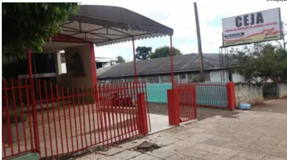
Ceja oferece o ensino fundamental, ensino médio e nivelamento