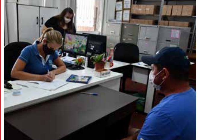
Só 1.795 produtores haviam renovado o bloco até sexta-feira