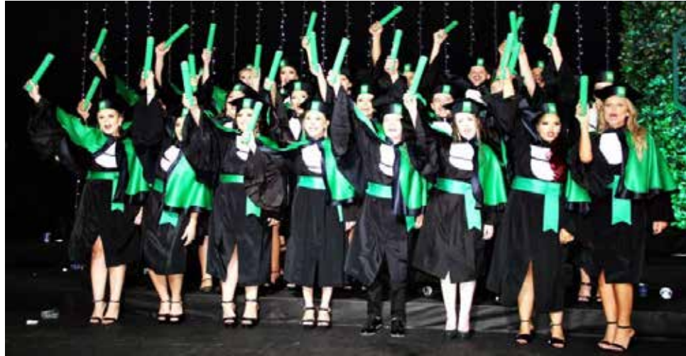
Apesar do golpe, turma de 2019 conseguiu realizar a festa de formatura

Conforme descrito na sentença, o réu adotou um