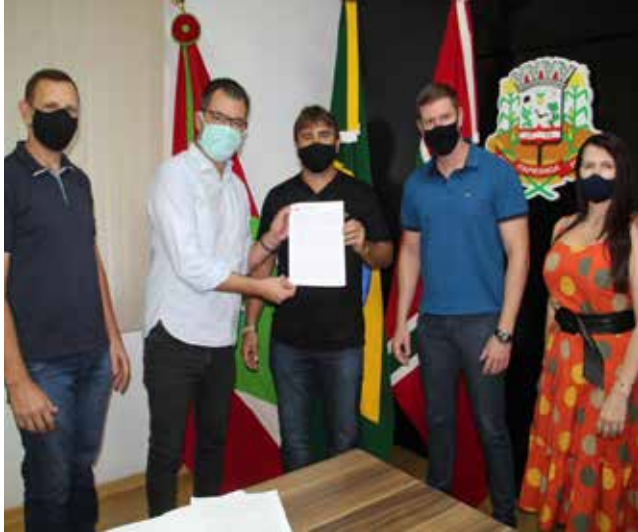
Termo de fomento foi assinado segunda-feira