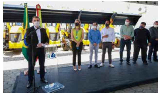
Máquinas foram entregues à Casan para distribuição às regiões

“A Casan é uma empresa que tem apresentado melhoria nos seus resultados, nos números e na qualidade dos serviços. Isso vai impactar positivamente as futuras gerações, em ações de preservação e produção de água potável e no saneamento das nossas cidades. Os equipamentos vêm para