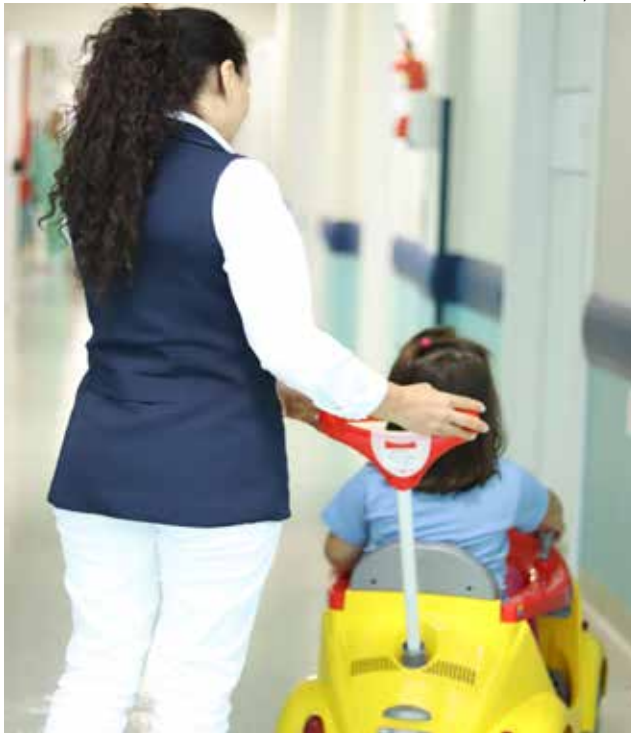
Para garantir a segurança dos pequenos, o carrinho é conduzido por um profissional do Setor de Ortopedia até o destino

Para garantir a segurança dos pequenos, o carrinho é conduzido por um profissional do Setor de Ortopedia até o destino, podendo utilizar a qualquer momento do dia ou à noite. O minicarro possui pedal, alavanca de câmbio e travas. O Hospital também segue todas as normas sanitárias, sendo os carros de material que pode ser higienizado após o seu uso.