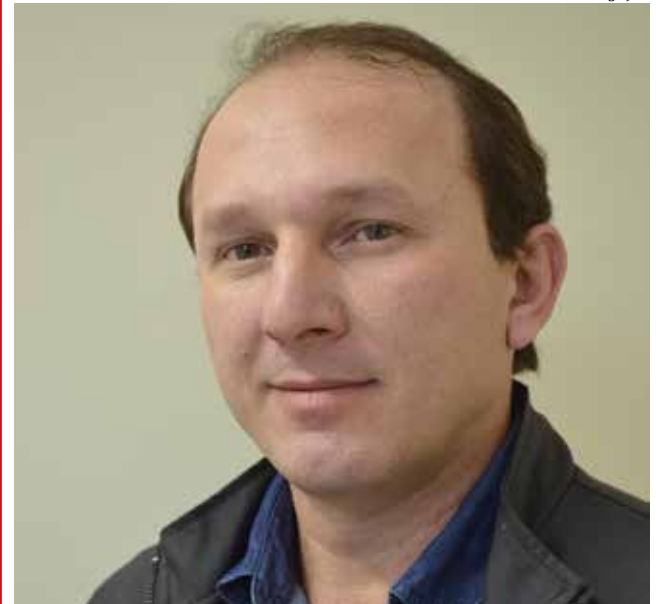
Prefeito de Guaraciaba, Vandecir Dorigon