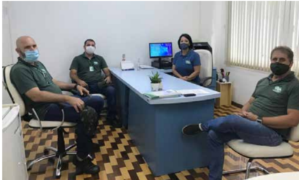
Autoridades da Saúde se reuniam para avaliar o quadro

Ela assinala que a equipe tem identificado muitos terrenos sem manutenção, com acúmulo de lixo e vegetação alta, e pede a colaboração dos proprietários, para que deem a devida atenção a este problema. Caso contrário, a secretária alerta que os mesmos es-