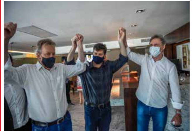
Baleia Rossi foi recebido pela cúpula do MDB catarinense