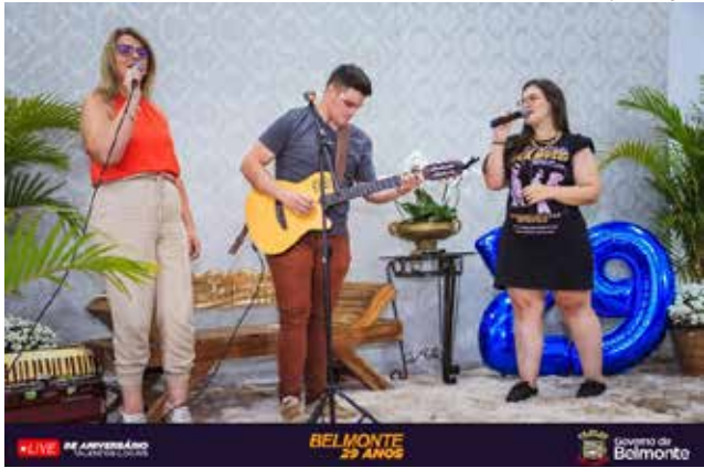
Evento transmitido pela Internet teve mais de 20 apresentações artísticas