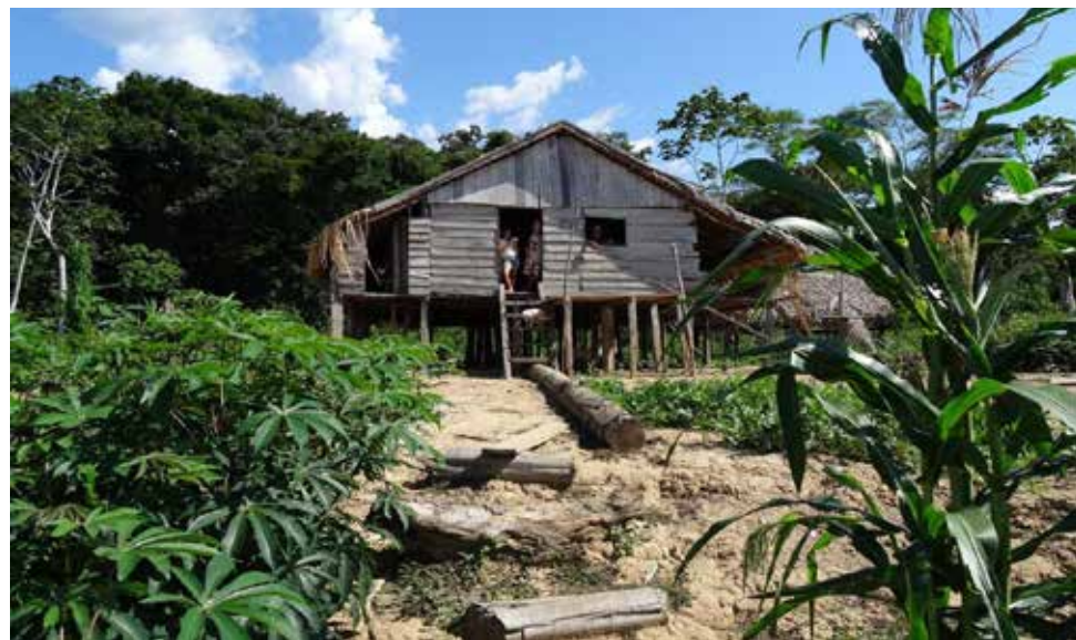
Plantação de mandioca (esq) e milho (dir) próxima a uma casa da comunidade de Itatuba, no município de Tapauá, Amazonas, às margens do rio Purus

Com colegas da Universidade Federal de Lavras (Ufla), em Minas Gerais, da Universidade Federal do Pará (UFPA) e da Universidade de Lancaster, no Reino Unido, ele constatou que nos períodos de cheia 85% das famílias precisaram substituir o peixe ou a carne por outro alimento pelo menos uma vez ao longo de 30 dias, 65% comeram menos do que gostariam, 33% precisaram pular alguma refeição do dia e 17% não comeram nada por um dia inteiro.