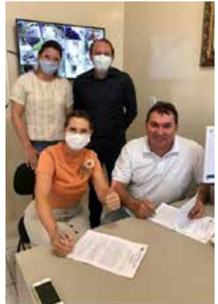
Convênio foi assinado segunda-feira

Administração municipal de Guaraciaba, por