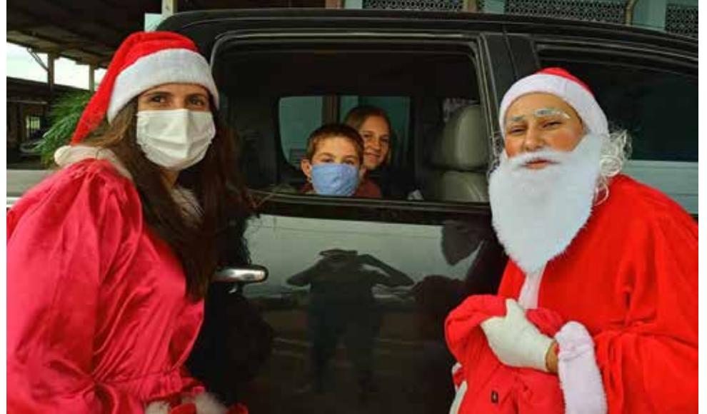
Atividades foram desenvolvidas de forma segura, com distanciamento

Segundo a direção, foi a forma encontrada para fazer o encerramento do ano letivo sem colocar em risco a saúde dos alunos, familiares e da comunidade escolar. Assim, os alunos vivenciaram um pouco da magia do Natal e se des-