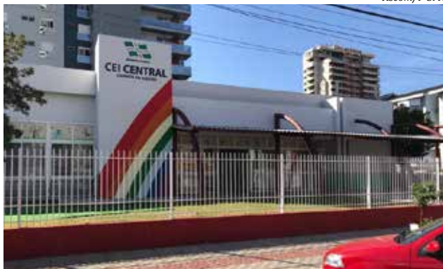
As inscrições para as creches são realizadas entre os dias 04 e 15 de janeiro