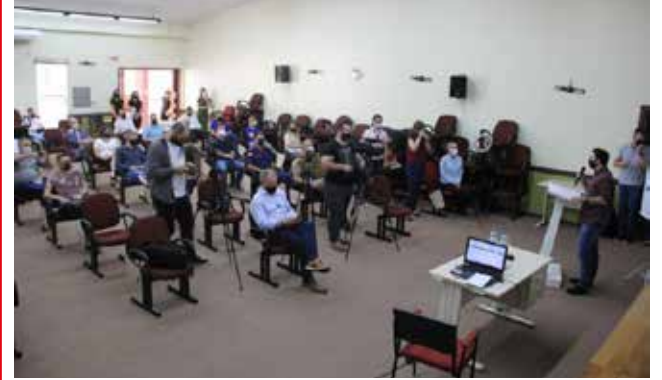
Lançamento ocorreu quinta-feira, no Centro Comercial Andrômeda