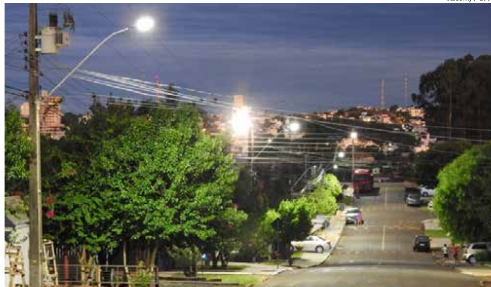
Lâmpadas de LED trouxeram um novo visual noturno à cidade

A Secretaria de Urbanismo informa que na fase inicial foram realizadas instalações em vias de maior movimentação, como a Avenida Willy Barth, Waldemar Ramgrab e Salgado Filho, entre outras da área central. Em seguida, partiu-se para as ruas principais dos bairros.