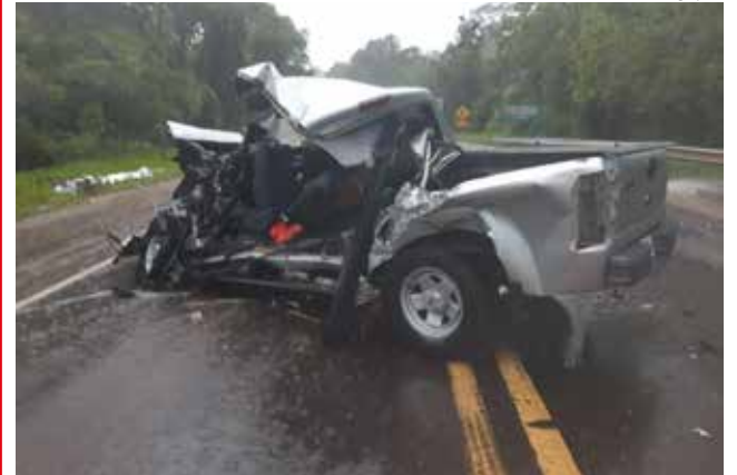
Ford Ranger ficou totalmente destruído