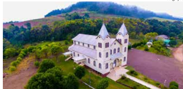
Igreja São Rafael é uma das atrações turísticas da cidade

No Plano de Marketing Turístico, com aproximadamente 170 páginas, constam informações sobre as características do território, diagnóstico e análise do turismo local, oferta turística, demanda do setor com sondagem da concorrência, pesquisa sobre as ferramentas atuais, utilização para promoção e estratégias de marketing. O estudo amplia a visibilidade e a comercialização do destino,