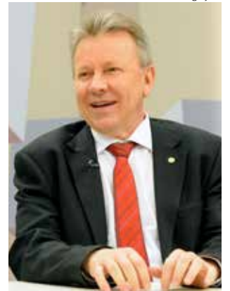
Deputado federal Celso Maldaner

Em agosto, atendendo apelos diversos, inclusive de Maldaner, a Anvisa liberou e regulamentou o uso do medicamento no Brasil. “A inclusão do medicamento no SUS é um apelo de familiares, amigos e solidários as campanhas da AME pelo Brasil que lutam para arrecadar os aproximados R$ 12 milhões necessários para custear o tratamento, garantindo assim o mínimo de dignidade às essas crianças para que cresçam saudáveis e disponham de uma infância feliz”, defende o parlamentar.