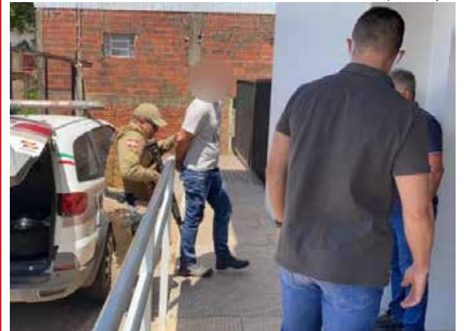
Acusado foi preso logo após o crime e aguarda posicionamento da justiça