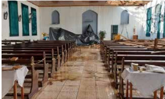
Temporal causou prejuízos em igreja no interior de Itapiranga

Na quinta-feira, 26, ele participou de uma audi-