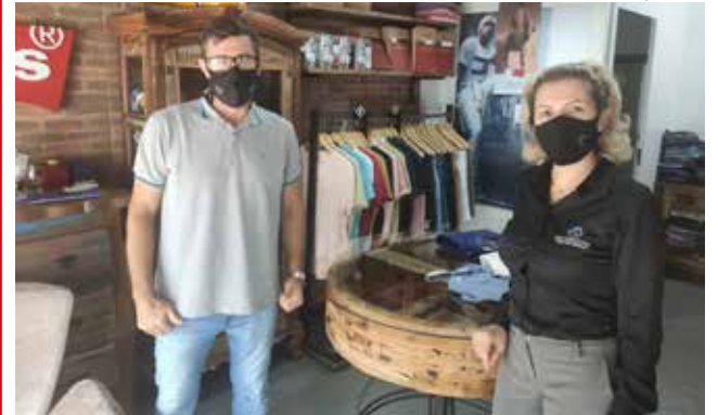
Empresários de Itapiranga receberam consultorias gratuitas