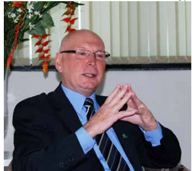
Aristides Cimadon, reitor da Unoesc

De acordo com Cimadon, para aqueles que cursam ou pretendem cursar as licenciaturas, terão a oportunidade de estudar com os programas que a Unoesc está implementando gratuitamente na instituição, tendo assim um ensino de qualidade