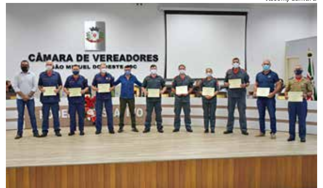
Moção foi entregue a bombeiros militares, bombeiros comunitários e a civil que auxiliou na ocorrência