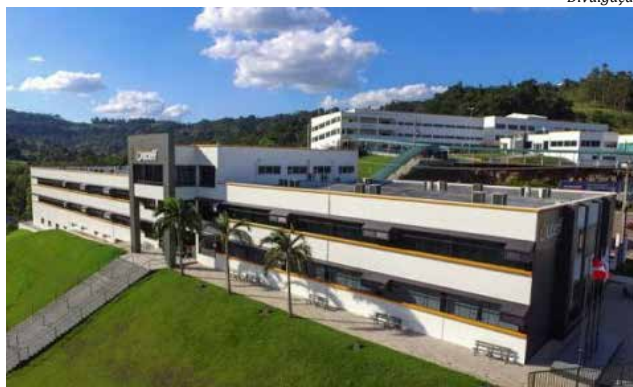
Sede da Uceff em Itapiranga