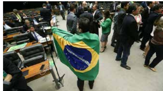
Não multaram por que?

De acordo com a norma, não é permitido modificar as cores ou o lema da bandeira ao representá-la; apresentá-la em mau estado de conservação; reproduzi-la em rótulos ou embalagens de produtos; usa-la como vestimenta, agasalhando-se nela, como visto em comemorações esportivas ou em manifestações de rua. As bandeiras rasgadas devem ser entregues à Unidade Militar para serem incineradas nas solenidades no Dia da Bandeira. Qualquer violação ao uso da bandeira nacional será considerada contravenção, com pena de multa ao infrator.