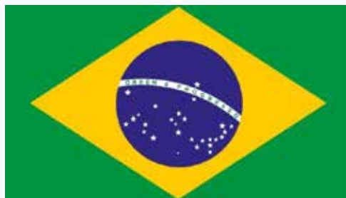
Além da representação política, as estrelas desenhadas dentro da esfera azul são uma representação do céu do Rio de Janeiro, às 8 e meia da manhã do dia 15 de novembro de 1889