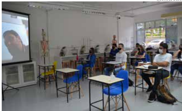
Alunos retomam as aulas presenciais de forma gradual, com segurança e respeitando as normas

A organização das aulas será no formato híbrido, ou seja, a família poderá optar em acompanhar a aula no formato on-line ou