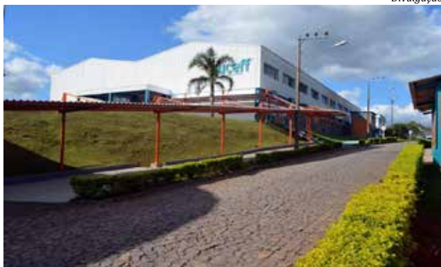
Sede da Uceff em Chapecó