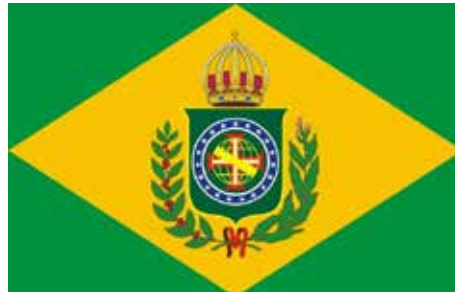
A bandeira imperial, usada de 1822 a 1889, foi inspiração para a atual Bandeira Nacional

No dia 19 de novembro se comemora o Dia da Bandeira do Brasil, símbolo criado para marcar o fim do Império em 1.989 e o início da República no país, 15 de novembro de 1889. Em 19 de novembro, ficou pronta. É por isso que a data é comemorada quatro dias após a Proclamação da República pelo Marechal Deodoro da Fonseca.