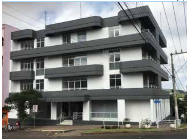
A unidade Uceff São Miguel do Oeste está localizada na Rua Santos Dumont antigo espaço do Sesc