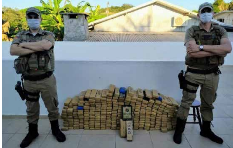
Pouco mais de 200 quilos de maconha foram apreendidos

Também foram cumpridos 40 mandados de busca e apreensão de armas e drogas. A operação também aconteceu no Litoral, em Joinville, Palhoça, Chapecó e alguns municípios do Paraná. Ao todo, 28 pessoas foram presas nos dois estados. A operação teve a participação de 140 policiais civis de Santa