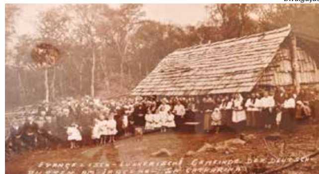
Fugindo das malvadezas do comunismo

O filme de quase três horas contará a história de Maurice von Hirsch, o Barão Hirsch, considerado o Moisés das Américas, responsável por salvar milhares de judeus oriundos de todo o Leste europeu no século passado. Mais de 70 atores do Oeste catarinense participarão das cenas mais emocionantes do filme. O longa