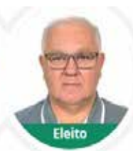
GICA (PP) - 643 votos