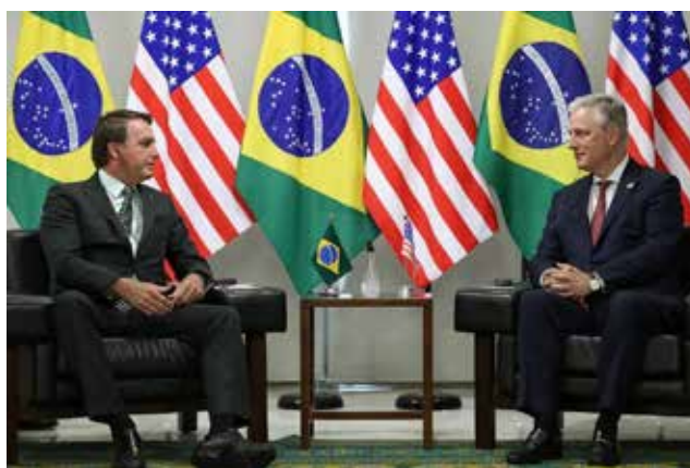
O secretário de segurança americano, Robert O'Brien, visitou o presidente Jair Bolsonaro na terça-feira, 20.

Sempre optamos pelos dólares. Porém, em 2020, o Capitão Jair Messias Bolsonaro terá que fazer valer a 8ª economia do planeta e optar pela economia do mundo globalizado.