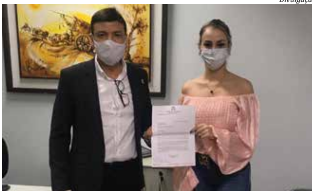
Ofício foi entregue ao governador terça-feira