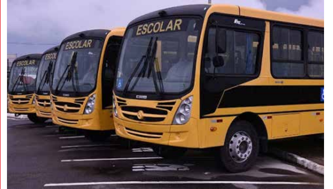
Ônibus foram entregues ontem