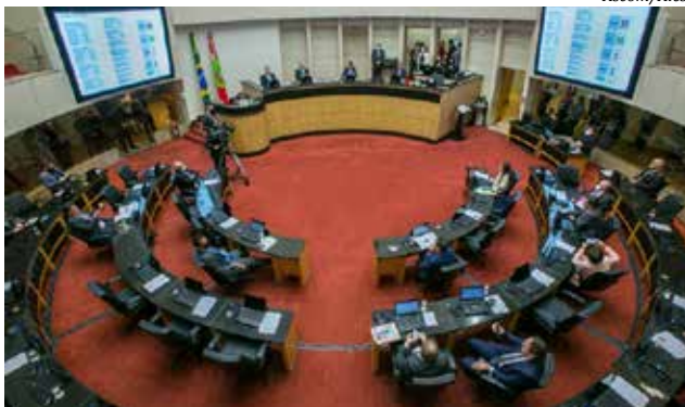
Plenário acatou a segunda denúncia contra o governador por 36 votos favoráveis, dois contrários e uma abstenção

O relator da denúncia na comissão especial, deputa-