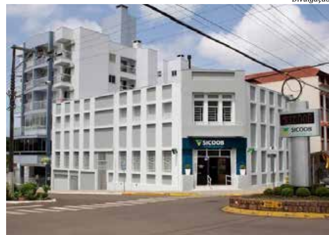
Entidade com sede em Itapiranga é a mais antiga instituição cooperativa financeira do Brasil

Atualmente, o Sicoob Creditapiranga se destaca por ser uma instituição financeira completa e diferente, cooperando e crescendo com seus mais de 23 mil associados. A Sicoob Creditapiranga, possui agências em Itapiranga, São João do Oeste e Tunápolis, em Santa Catarina, e em Tenente Por-