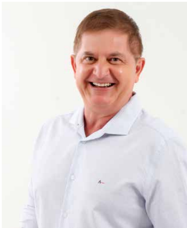
Imagem - Caso eleito, quais serão suas princi-

pais prioridades no governo? O que o eleitor poderá esperar de novidades no plano de governo?