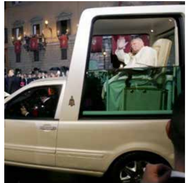
O “Lulamóvel” seria semelhante aos veículos usados tradicionalmente pelos papas, chamados “papamóvel”

Além dos anacronismos, o PT gasta longos parágrafos defendendo teorias da conspiração em que atribui as condenações de Lula na Justiça e o impeachment de Dilma Rousseff a conluíus entre as elites brasileiras com os Es-