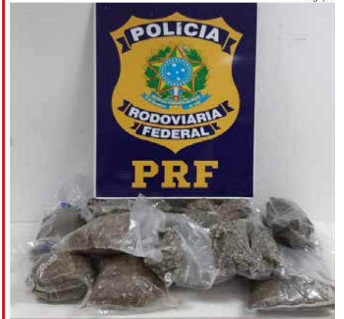
Droga estava escondida em duas mochilas