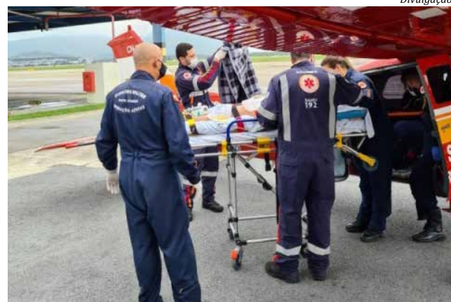
Vítima foi transportada para hospital de Florianópolis

Os bombeiros não informaram se o acidente teria sido na própria casa do menino ou como te-