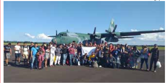
Grupo partiu de Boa Vista, em Roraima, onde estavam asilados