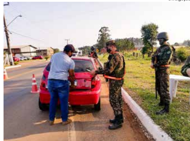
Operação está sendo desenvolvida especialmente nas estradas dos dois estados do Sul em que há fronteira com outros países

A faixa de fronteira é legalmente definida como a região interna de 15 Km de largura paralela à linha divisória terrestre do território nacional. As ações estão ocorrendo na região