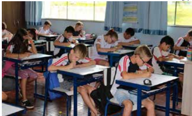
Escolas municipais de Iporã do Oeste têm a melhor nota nos anos iniciais

Já Anchieta apresentou a 4ª melhor nota do país (7,0) entre as redes municipais nas turmas das séries finais do ensino fundamental, do 6º ao 9º ano. Logo