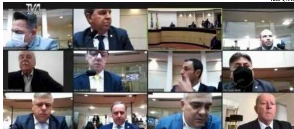
Relatório foi aprovado em sessão virtual terça-feira

Agora, o relatório será votado em plenário pelos 40 deputados estaduais para decidir se o processo de impeachment será levado a julgamento pela Assembleia. Se isso ocorrer, o pedido será alvo de uma segunda votação, desta vez por uma comissão mista formada por cinco deputados estaduais escolhidos e cinco desembargadores do Tribunal de Justiça de San-