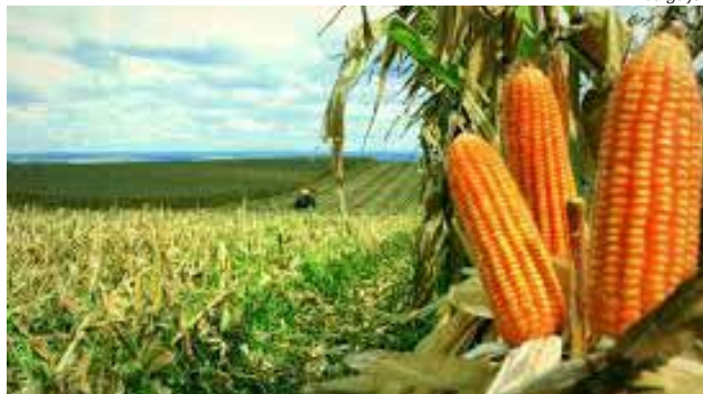
Milho deverá ser o principal responsável pelo aumento na produção

"O mercado está aquecido com a alta do dólar, o que é favorável para estas culturas. Além disso, esse ano temos um aumento