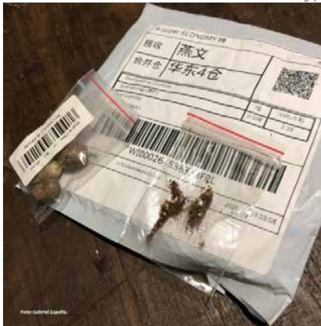
Sementes não são identificadas e embalagem vem com caracteres chineses

Segundo as autoridades do Ministério da Agricultura, apesar de parecerem inofensivas, estas sementes clandestinas podem estar contaminadas e disseminar pragas e doenças e, assim, causarem sérios prejuízos econômicos e danos do ponto de vista da defesa sanitária vegetal.