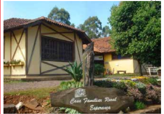
A Casa Familiar Rural tem atualmente 89 alunos matriculados em Iporã do Oeste