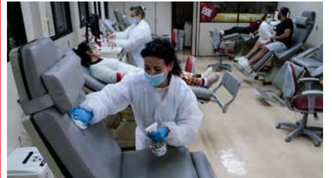
A doação de sangue também está funcionando com hora marcada, com o espaçamento necessário para evitar aglomerações