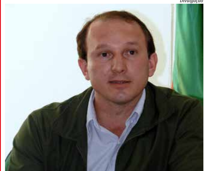
Atual vice-prefeito Vandecir Dorigon é o candidato PSL a prefeito