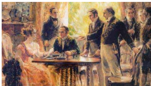
A independência do Brasil em relação a Portugal foi firmada, em 1822, e como o momento histórico ocorreu durante a regência da imperatriz Maria Leopoldina, ela se tornou a primeira mulher a governar o Brasil, ocupando o cargo interinamente por alguns meses, enquanto D. Pedro I viajava pelo Vale do Rio Paraíba do Sul. Após a decisão da Imperatriz e do Conselho, Pedro soltou o grito em São Paulo

De acordo com Staub, os processos revolucionários que levaram à independência datam muito antes do dia em que foi ocorrida, que é 7 de Setembro de 1822.