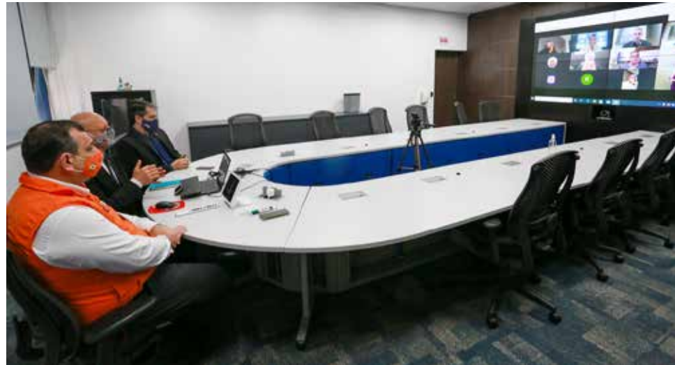
Plano de Contingência Estadual foi detalhado em reunião on-line ontem

diretrizes de ações operacionais para o retorno das aulas presenciais, incluindo medidas sanitárias, pedagógicas, de transporte, de alimentação, de gestão de pessoas e de informação e comunicação. Ainda descreve metodologias para o