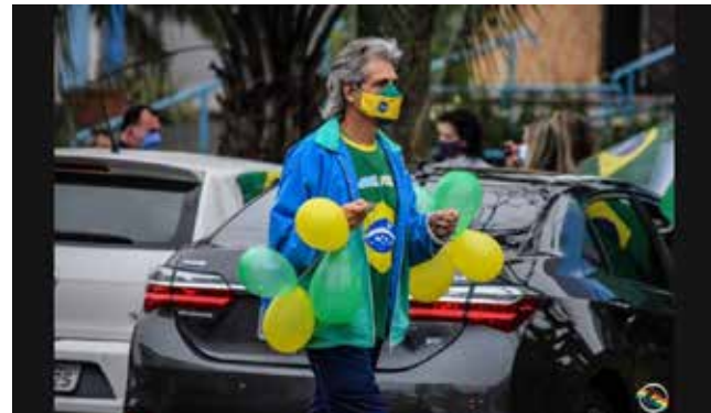
A forte chuva não intimidou os patriotas de São Miguel do Oeste a sair às ruas

Ele desejou a todos um bom 7 de setembro, reforçando o sentimento patriótico presente no desfile voluntário, que algumas cidades do Brasil irão realizar, sendo este, um caminho para o futuro do movimento.