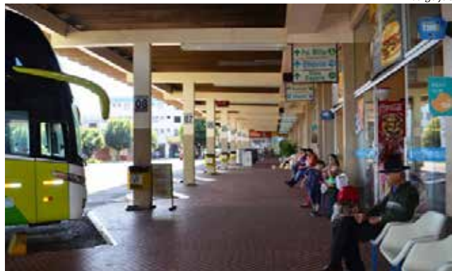
Terminal rodoviário de São Miguel do Oeste voltou a receber ônibus de outros estados