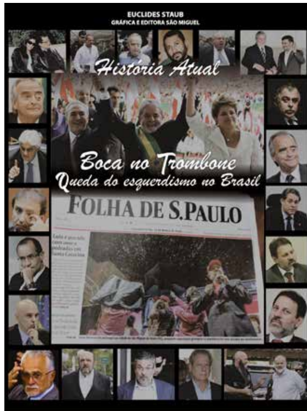
Salvo melhor juízo, os expoentes do antifascismo no Brasil

O mais novo projeto da esquerda brasileira, cujos expoentes estão na cadeia, ou com tornozeleiras, ou alforriados pela Suprema Corte, estão elaborando um plano nos moldes do implantado com êxito, por meio da "Comissão da Verdade" onde bandido vira herói e os patriotas viram criminosos.