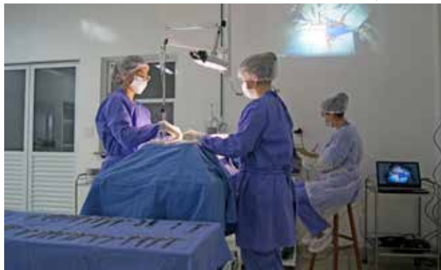
Aula é transmitida em tempo real com interatividade