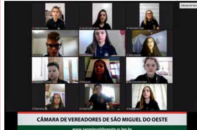
Sessão mensal virtual dos vereadores mirins foi realizada terça-feira