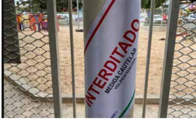
Cristian Losch/Rede Peperi