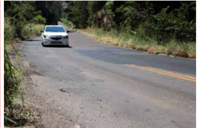
SC-305 será restaurada e terá aumento na capacidade de trânsito