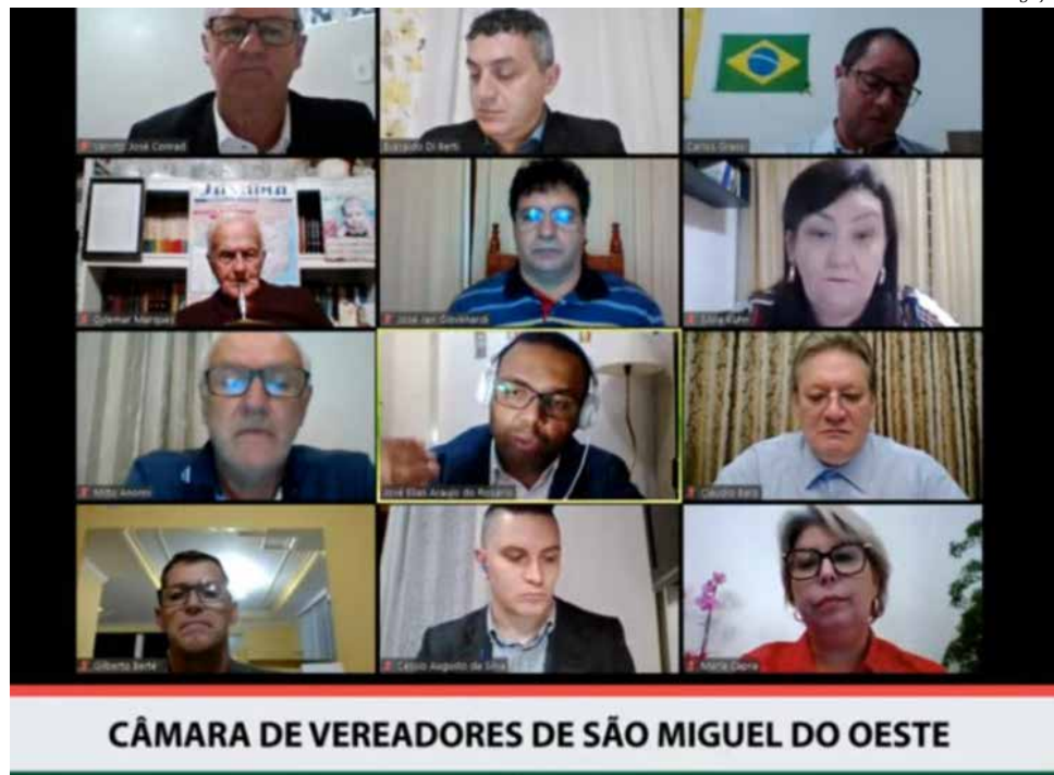
Vetos foram mantidos por unanimidade na sessão virtual de quinta-feira

Ele ressalta que o objetivo do Contorno Oeste é criar uma alternativa para desviar o trânsito de veículos do perímetro urbano do município, melhorar a segurança do trânsito, ao reduzir o volume de circulação de veículos na Avenida Willy Barth. Segundo Trevisan, isso gerará valorização imobiliária ao fornecer acesso pavimentado a imóveis no interior do município, "o que contribuirá para a ins-