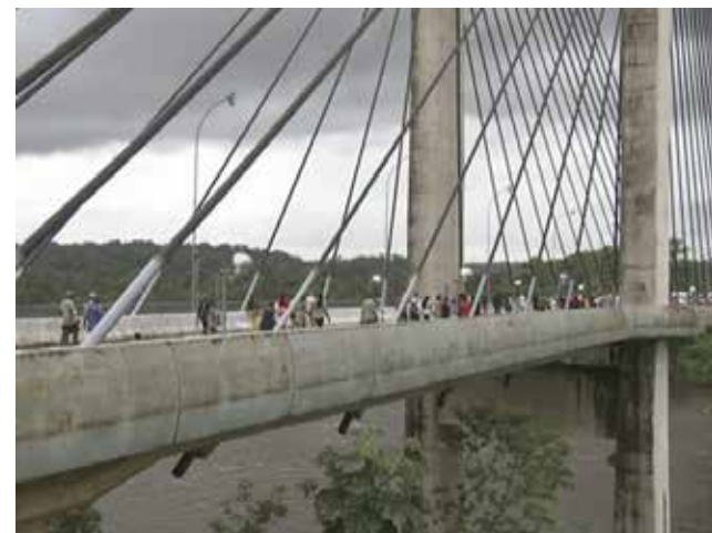
Ponte custou quase R$ 70 milhões aos cofres brasileiros e serve para deportar brasileiros sem o visto de entrada

O país europeu está à frente de críticas à política ambiental do governo Jair Bolsonaro e faz fronteira física por meio da Guiana Francesa com a região - o que não a torna um “ator exótico”. A diplomacia de Paris considerou a hipótese de confronto delirante.