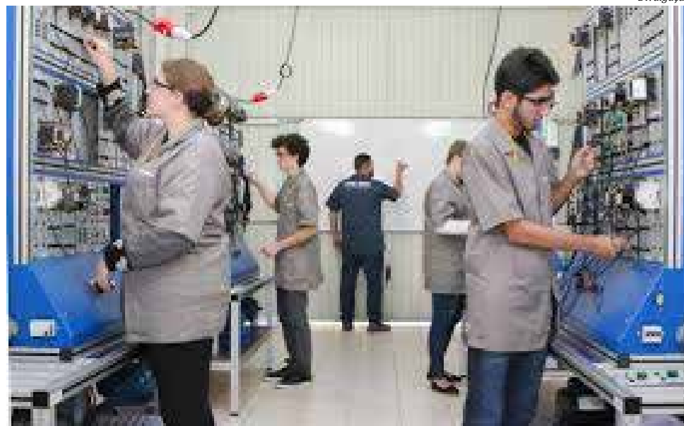
Cursos abrangem todas as áreas do ensino técnico e superior

Uma centena dos cursos, totalizando 4,7 mil vagas, será realizada pela modalidade de educação à distância (EaD). "Em suas atividades, SESI e SENAI focam a oferta de cursos nas principais necessidades apontadas pela indústria, levando