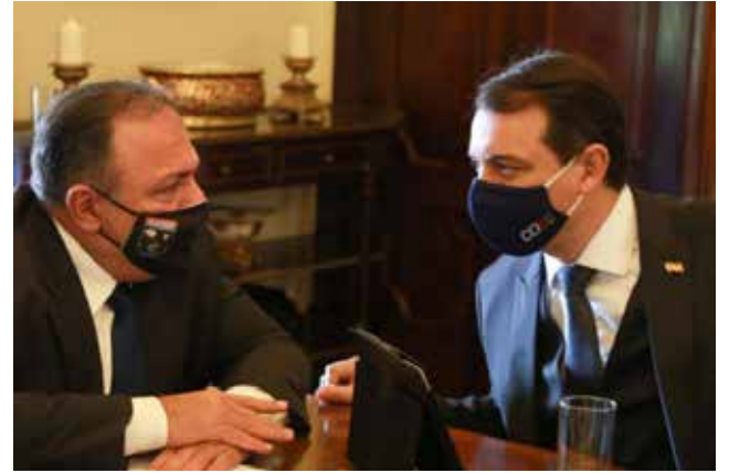
Eduardo Pazuello se reuniu com o governador Carlos Moisés na tarde de ontem