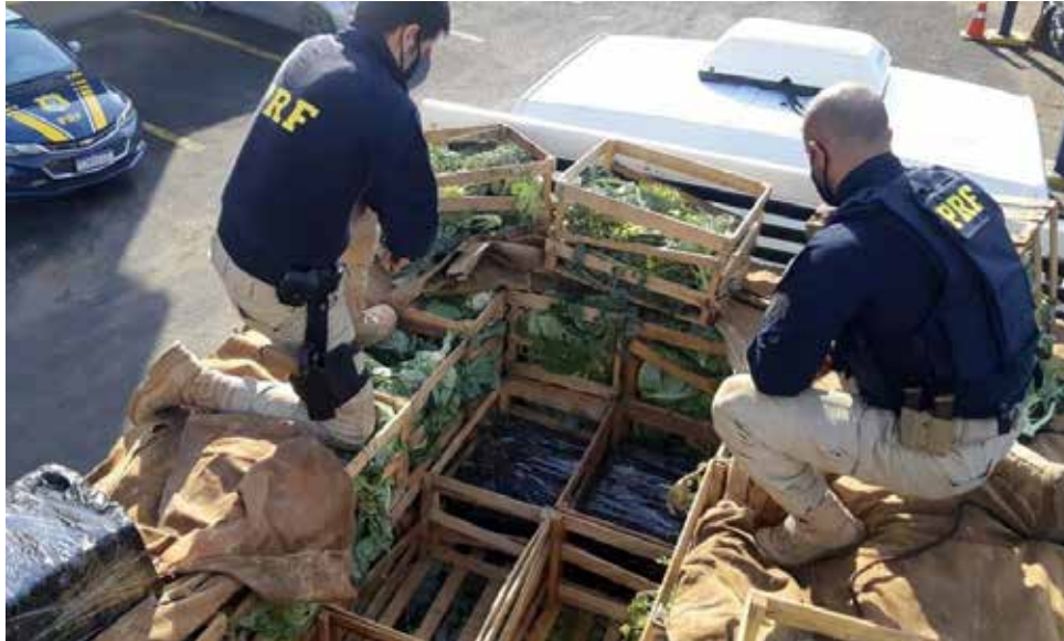
Entorpecente estava escondido embaixo de caixas com tomate, couve-flor, repolho e brócolis

A apreensão ocorreu após o efetivo da PRF receber informações do serviço de inteligência da instituição. O caminhão Volkswagen, com as mesmas características repassadas, foi então abordado na rodovia. Em um primeiro momento, o motorista do veículo, de 42 anos, alegou que vinha do Paraná