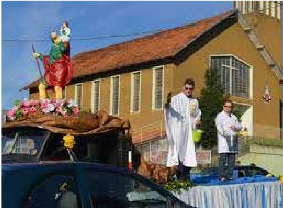
Promoção é tradicional todos os anos paqra comemorar o Dia do Colono e Motorista