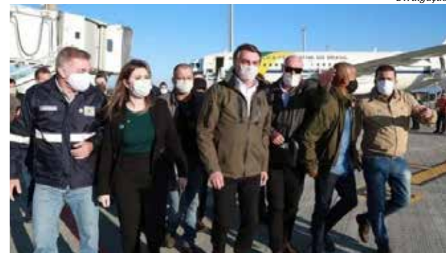
Fotos mostram que distanciamento não foi respeitado