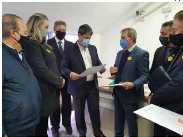
Reivindicações foram entregues ao ministro em Florianópolis segunda-feira