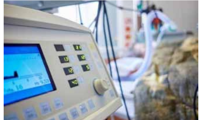
Novos leitos serão abertos com os respiradores recebidos do Estado