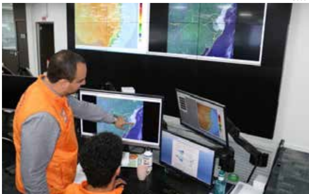
Centro Meteorológico do Estado monitora as condições do tempo

por conta da passagem do ciclone afetou 152 municípios com registros de ocorrência. No entanto, esse número deverá ser maior, pois, muitos ainda seguem contabilizando os estragos. Pelo menos 10 pessoas morreram. No Extremo-Oeste, o município mais atingido foi Mondai.