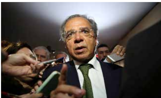
Paulo Guedes: queda na corrupção viabilizou o "Auxílio Emergencial" e, este, o faturamento no comércio

Apesar do forte avanço, o resultado de maio foi insuficiente para o setor se recuperar da perda de 19,1% no acumulado em março (-2,8%) e abril (-16,3%), diante dos impactos da pandemia de coronavírus e das medidas de isolamento social dos contra governo.