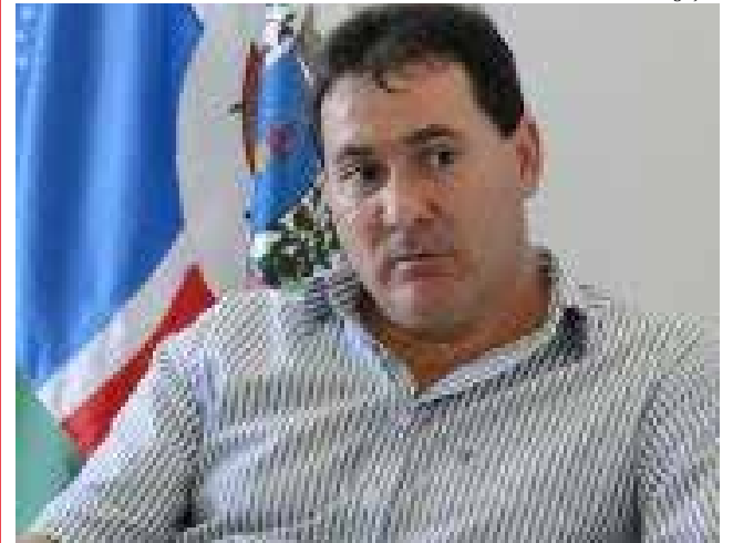
Prefeito Roque Meneghini