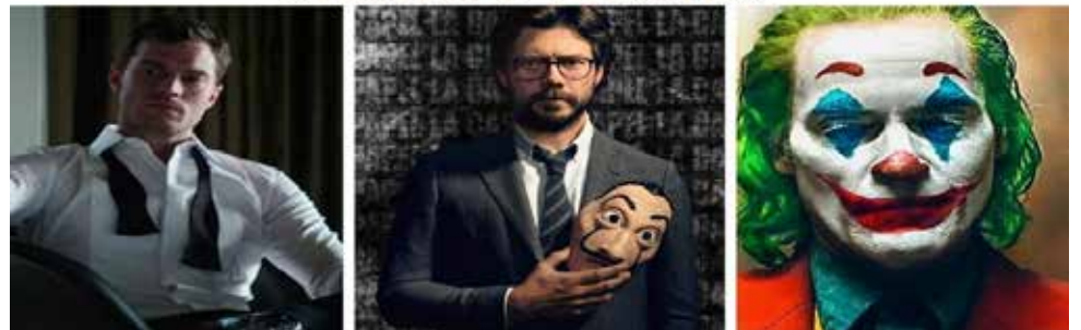
Acadêmicos e professores fizeram a análise psicológica dos personagens Christian Grey, o Professor e o Coringa