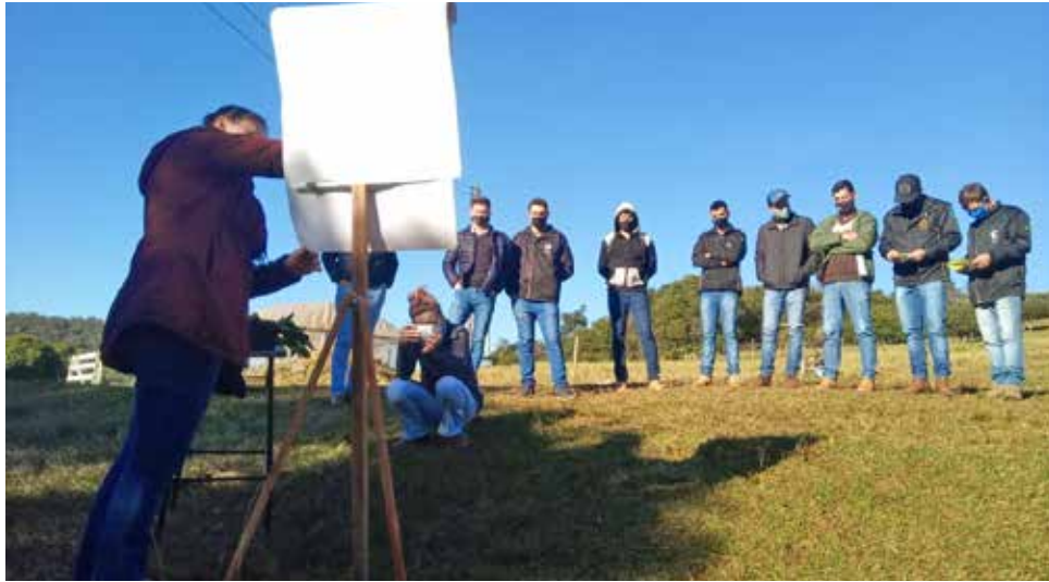
Dia de Campo foi realizado na Fazenda Escola da Unoesc São José do Cedro