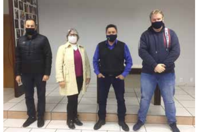
Frente Democrática reúne dirigentes do PT, PDT, Psol e PSB