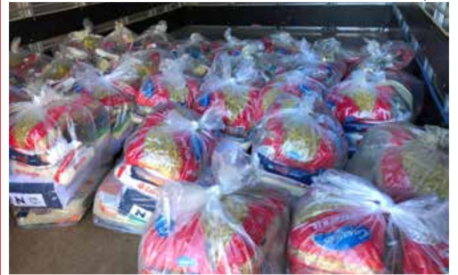
A ação arrecadou mais de 70 cestas básicas, além de móveis usados