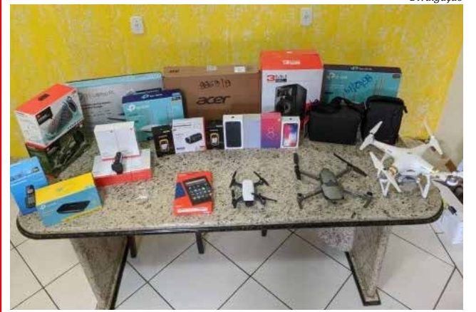
Os materiais vêm para reforçar as ações de prevenção e repressão