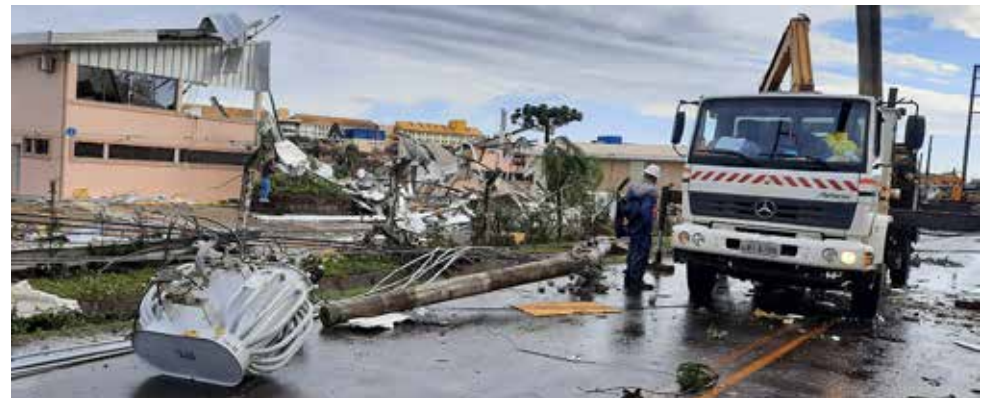
Queda de postes deixou 1,5 milhão de consumidores sem luz

cerca de 1.300 pessoas, mas o trabalho exige retirada de material pesado das redes e a previsão é que seja estendido por alguns dias em determinadas localidades. A Celesc está trabalhando para recompor 75% a 80% do sistema até o final desta quinta-feira. No interior, o tempo de recomposição pode ser de dois a três dias.