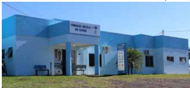
Recursos estão sendo aplicados no custeio da atenção básica