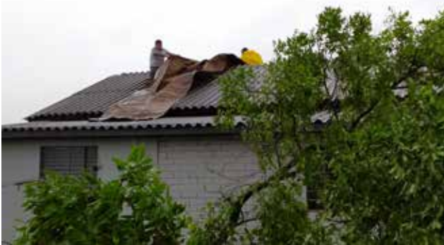
Em Descanso, população voltou a sofrer transtornos

21 de Novembro, onde três caixas d’água foram danificadas. O sistema está instalado em um lugar alto e