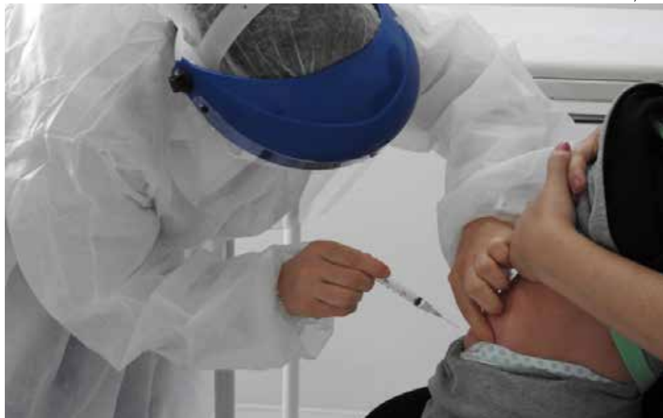
População pode procurar a vacina hoje e amanhã durante todo o dia

interesse em receber a vacina deverá apresentar, obrigatoriamente, o Cartão SUS. Para as