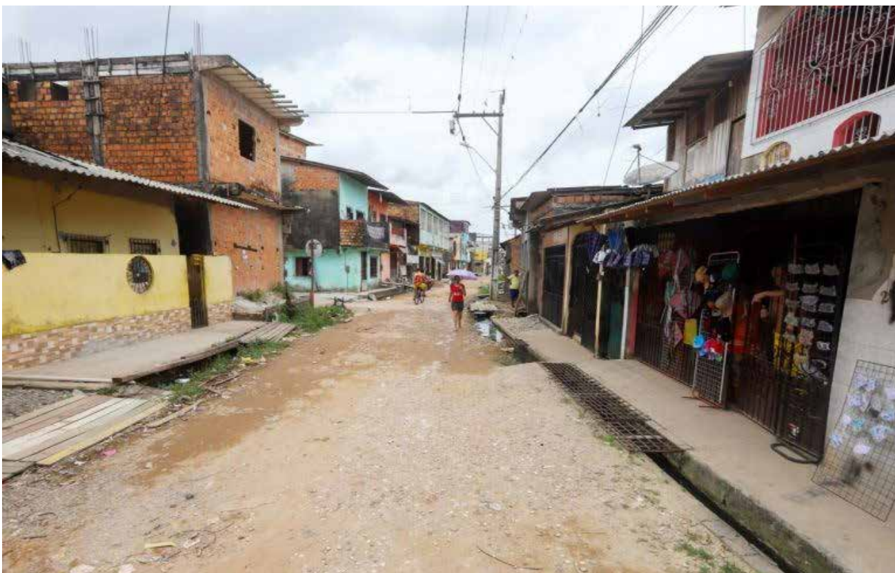
Muitos municípios brasileiros ainda não contam com rede de água potável e esgoto

Esses inúteis, são os mesmos que “oPTaram” em investir na refinaria da Bolívia, no metrô da Venezuela, no porto em Cuba, entre outras republiquetas comunistas. O saneamento ficou no papel. Por isso, a meu ver, o AI-5 faz falta. Fez falta pros anos do orçamento, pros mensaleiros, pros petroleiros. Poderiam ter salvado milhões de vidas.