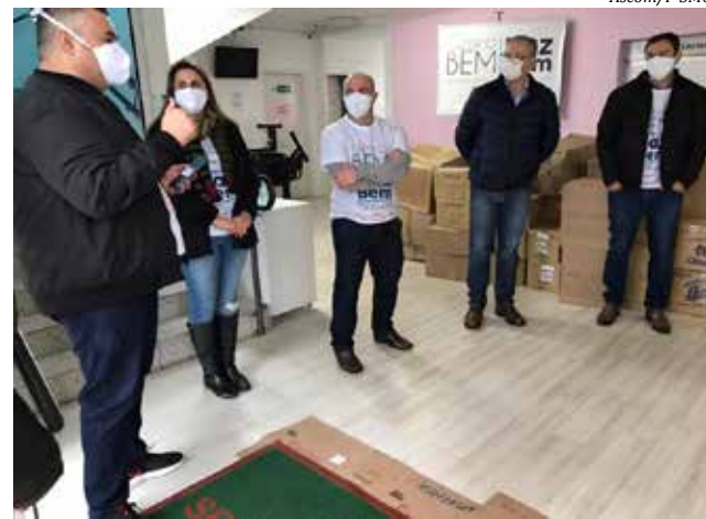
Dirigentes da empresa em São Miguel do Oeste entregaram os equipamentos segunda-feira na prefeitura