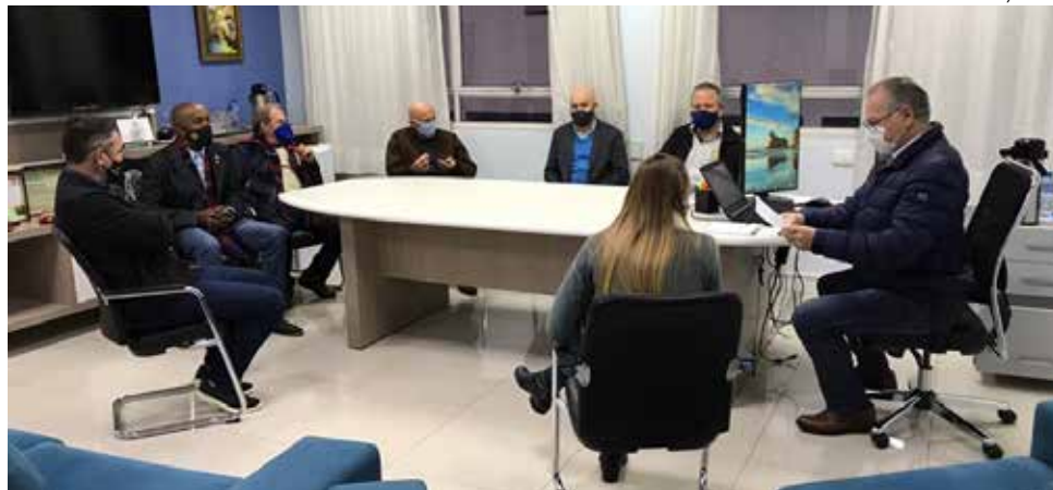
O ato foi realizado na presença de representantes da empresa construtora, engenharia do município e do Rotary Club, parceiro do projeto

De acordo com Trevisan, o investimento total será de R$ 758,9 mil, em 547 metros quadrados de área construída. O Rotary disponibilizará até R$ 200 mil para auxiliar no custeio deste montante. Outros R$ 350 mil são oriundos do Estado, por meio de emenda parlamentar do deputado Mau-