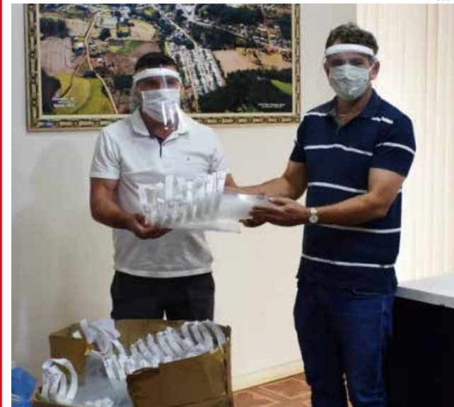
Os equipamentos estão sendo doados às instituições de saúde dos 19 municípios abrangidos pela Associação