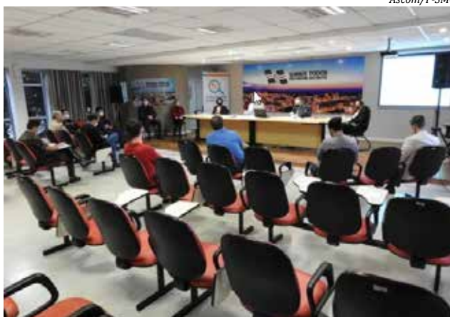
Comitê de crise esteve reunido terça-feira para deliberações

Algumas empresas do setor sequer demonstraram interesse na retomada imediata do serviço, em virtude da baixa demanda. Como esta questão impacta toda a região, ficou decidido pelo aguardo de uma normatização estadual sobre o assunto. Em relação a eventos,