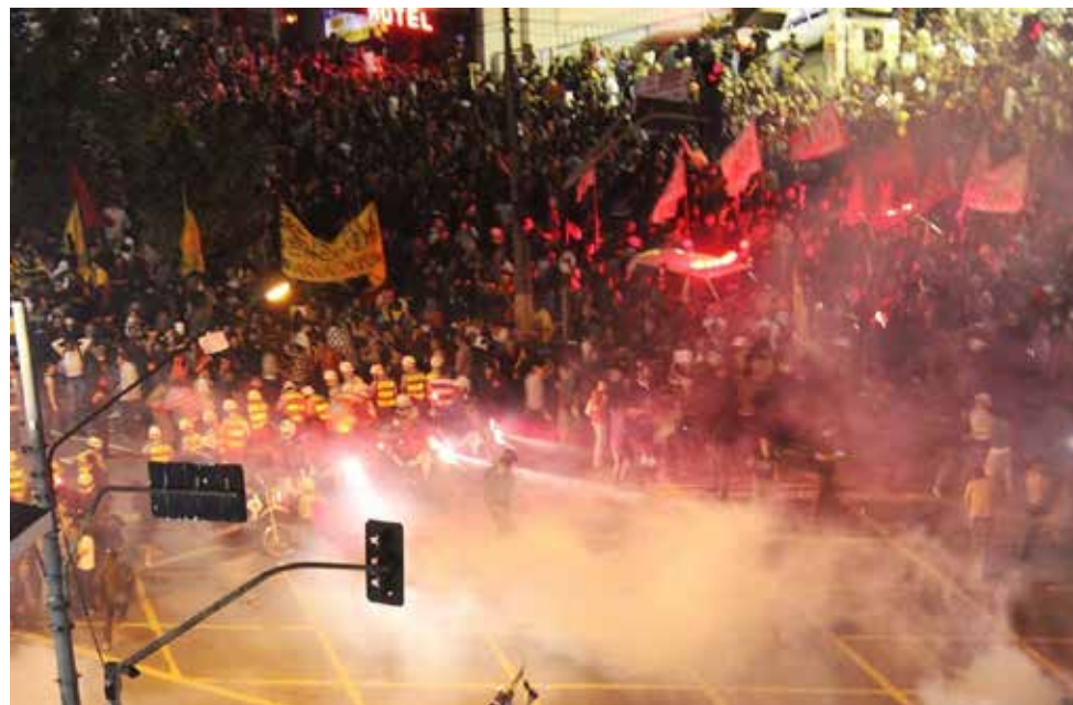
Vandalismo e violência manifestada em protesto 'pró-democracia' no domingo, em São Paulo

Assim, ao longo da História, o sagrado dinheiro para a infraestrutura, saúde, educação e para matar a fome de milhões de miseráveis sendo investido em segurança pública.