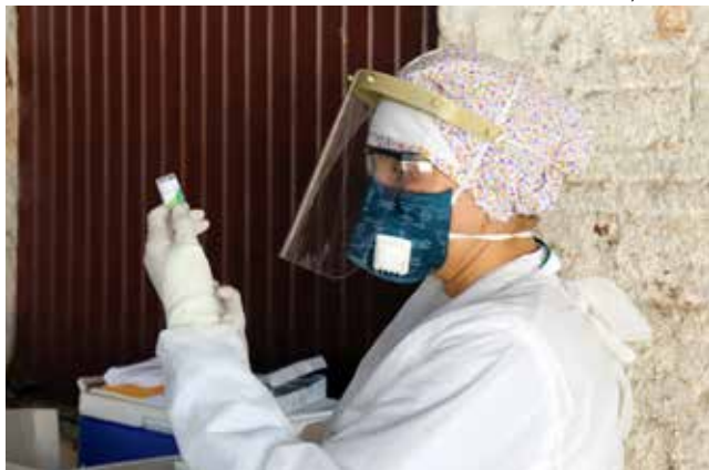
Em Descanso, até o momento foram vacinadas 2.439 pessoas