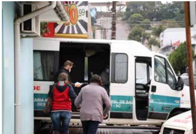
A Secretaria de Saúde organizou a documentação dos pacientes e realizou o transporte até Iporã do Oeste