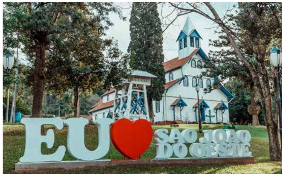
Letreiro foi concluído no início desse mês

Também foi disponibilizado pelo município sinal de Internet na praça, para os turistas usufruírem durante o passeio, podendo, assim, compartilhar instantaneamente suas experiências nas redes sociais.