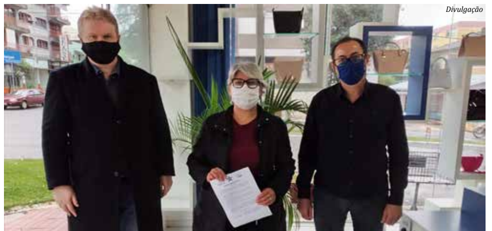
Presidentes dos três partidos assinaram a nota distribuída à imprensa

em construir um projeto popular com a participação de todos aqueles que defendem a Democracia e a Constituição Federal. A Frente Democrática está comprometida com o projeto democrático e popular acima de qualquer interesse intrapartidário”, diz a nota distribuída à imprensa.