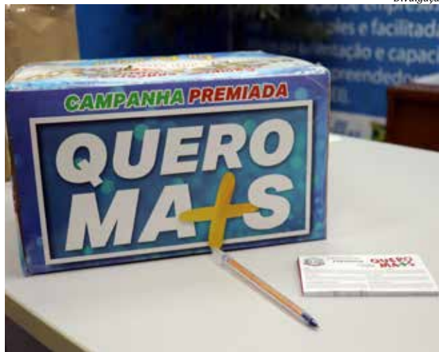
Até momento foram sorteados R$ 6 mil, sendo contempladas 30 pessoas com R$ 200 cada