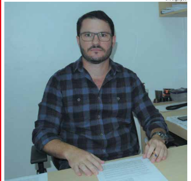
Prefeito Fernando Bisigo