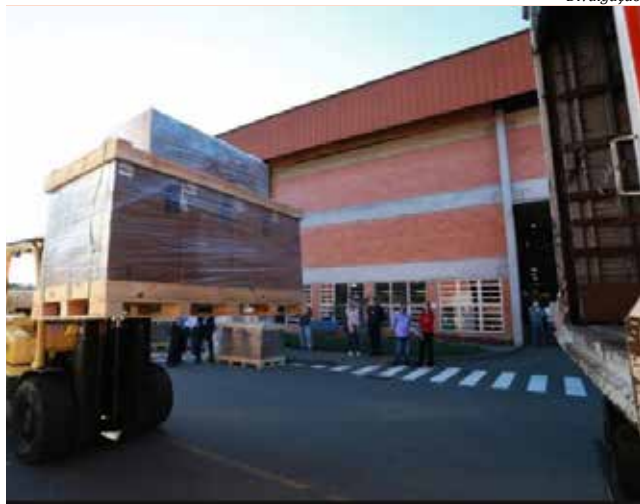
Respiradores foram entregues ao governo do Estado esta semana