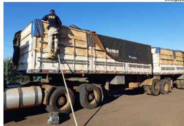
Duas toneladas de maconha foram apreendidas em Maravilha Região

Policiais militares prenderam sexta-feira, 22, três homens pelo crime de tráfico de drogas em São Miguel do Oeste. As prisões ocorreram no Vila Nova II. Os homens foram detidos por tráfico de maconha e associação criminosa. Um deles também tinha um mandado de prisão ativo. Um quarto envolvido também foi conduzido para a Delegacia de Polícia, mas foi liberado após assinar o Termo Circunstanciado por posse de drogas. Ele é usuário de entorpecentes.