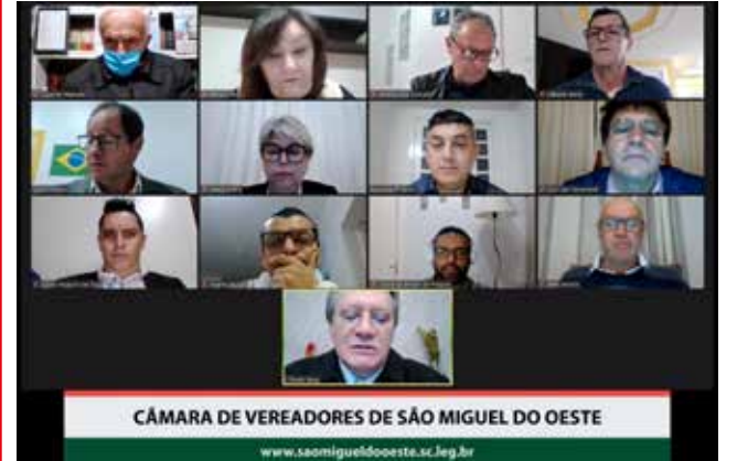
Última sessão ocorreu no dia 19