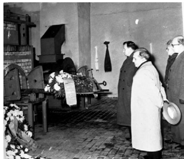
Visita de Luiz Carlos Prestes ao campo de concentração Ravenbrück onde Olga Benário foi executada

Em 1930 os Estados Federados e o Exército, desconformes com os mineiros e paulistas que se alternavam no poder por meio da "República Café - SP com Leite - MG", resolveram desencadear um golpe de estado e colocar no centro do poder o gaúcho Getúlio Dorneles Vargas.