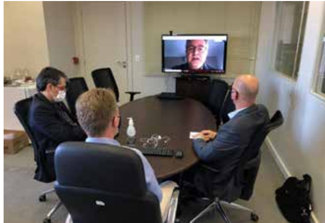
Secretários se reuniram em webconferência com representantes de 3 escolas e universidades