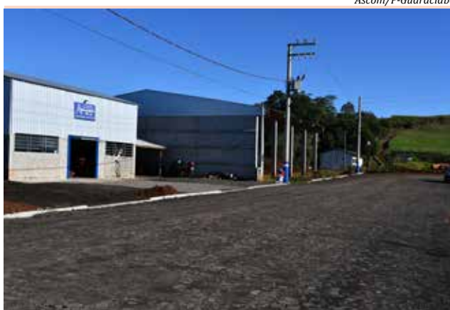
Obras foram finalizadas na semana passada

Segundo Meneghini, esses calçamentos são muito importantes para a população que reside nessas localidades, além das empresas instaladas na Área Industrial. "Estas obras darão mais conforto, eliminando o barro e o pó, além de trazer segurança