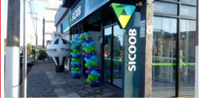
Nova agência inaugurada esta semana abriu suas portas no centro da cidade gaúcha