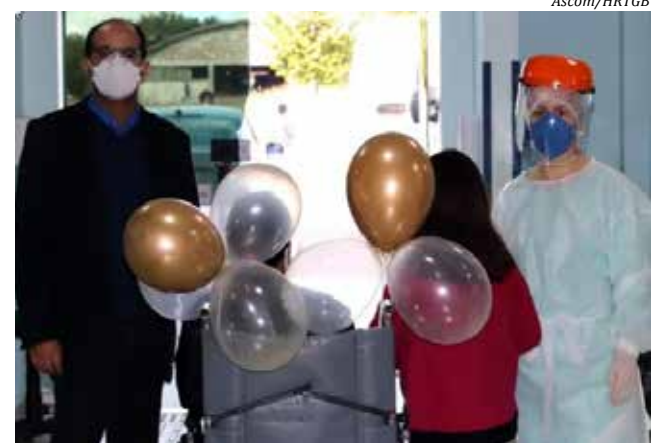
A funcionária recebeu alta depois de 10 dias de internação e recebeu homenagem dos colegas

O Hospital Regional de São Miguel do Oeste informa que até terça-feira 26, somente três atendimentos foram positivados