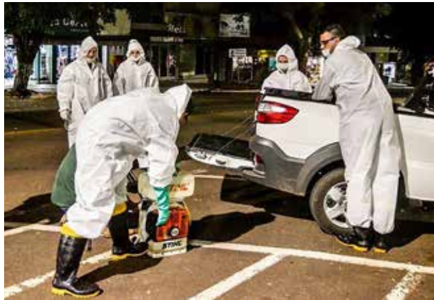
Aplicação de inseticida está ocorrendo em São Miguel do Oeste nesta semana

O Estrela ainda é o bairro com o maior número de pessoas doentes, 66% do total (77 casos). Os demais casos estão localizados nos bairros São Jorge (16), São Luiz (05), Saleté (03), São Sebastião