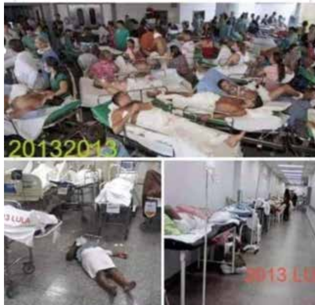
Saúde no Brasil em 2013

MEU DEUS AS PESSOAS ESTÃO SENDO ATENDIDOS NO CHÃO!!! CALMA PESSOAL ESSA CENA É 2013 QUANDO O LULA ERA PRESIDENTE E NÃO HAVIA CORONA VÍRUS.