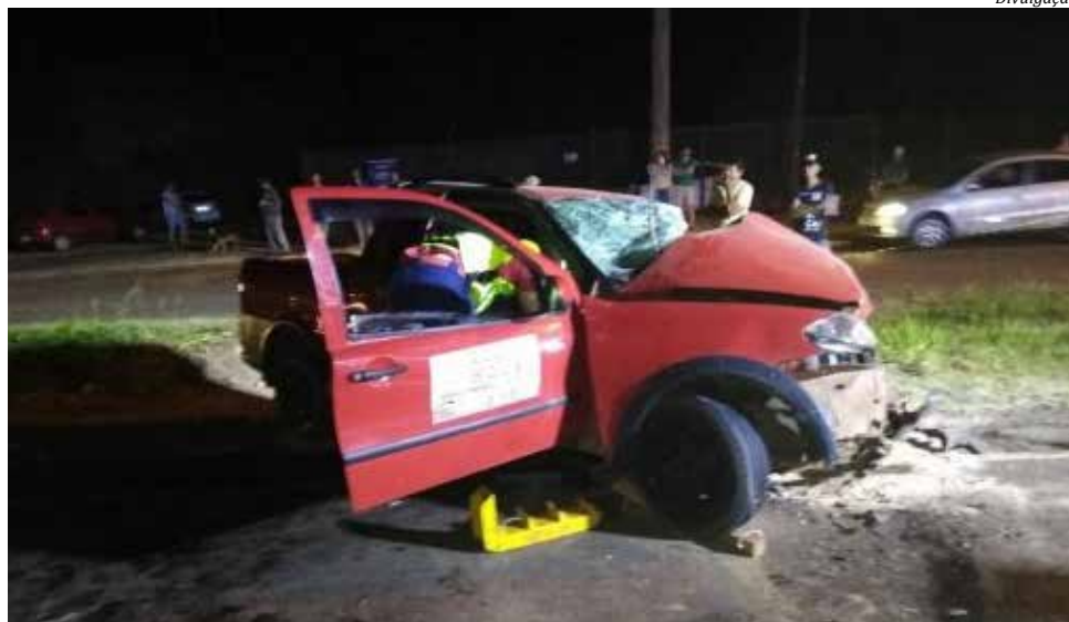
Acidente envolveu caminhão e caminhonete

O motorista da Strada estava preso às ferragens e ficou gravemente ferido com fraturas nas pernas e braços e suspeita de traumatismo craniano. A vítima foi desencarcerada