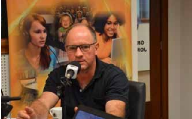
Prefeito Moacir Piroca