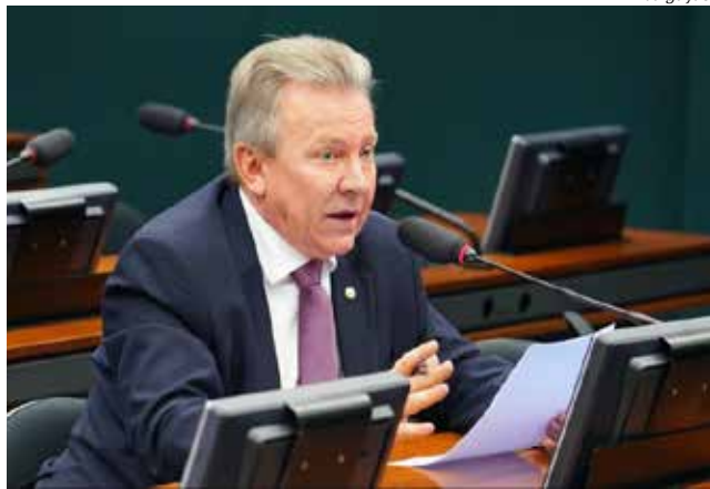
Deputado estadual Celso Maldaner