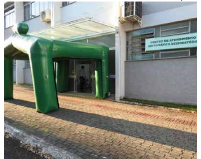
Testes serão feitos no Centro de Triagem, no salão paroquial