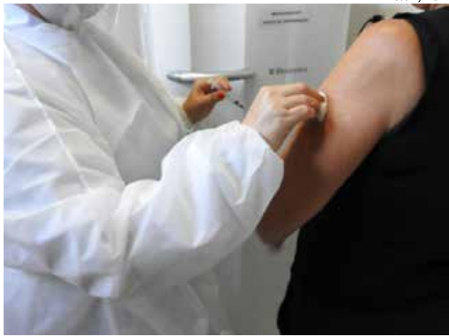
Atendimento será na praça central, das 8h às 16h, sem intervalo ao meio-dia

será realizado na praça Walnir Bottaro Daniel, das 7h30min às 17h, sem intervalo. Para os adultos com idade entre 55 e 59 anos e professores, a va-