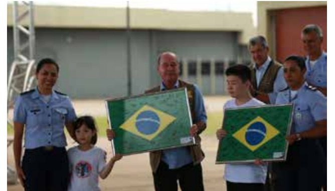
Resgatados da China, após 15 dias de quarentena, deixam a Base Aérea de Anápolis

O Brasil que em 2014, graças à vitalidade das redes sociais, começou a acordar para o flagelo esquerdista que o acometera durante três décadas ao longo das quais comprara gato por lebre, foi mudando de lado. Descrevo o processo como uma "iluminação" que acendeu luzes para a destruição de seus valores, para o assalto ao futuro do país, para a ruptura sistemática da ordem. Era imensa a lista dos malefícios de natureza social e moral em curso, com outro tanto na geração de riqueza e postos de trabalho. O braço festeiro gastador do Estado conseguiu transformar em voo de galinha as extraordinárias oportunidades proporcionadas pela primeira década deste século. Consolidara-se no país um capitalismo de compadrio, padrinho de corruptos e corruptores.