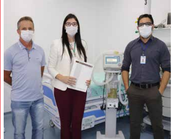
Respirador foi entregue em comodato ao Hospital Regional