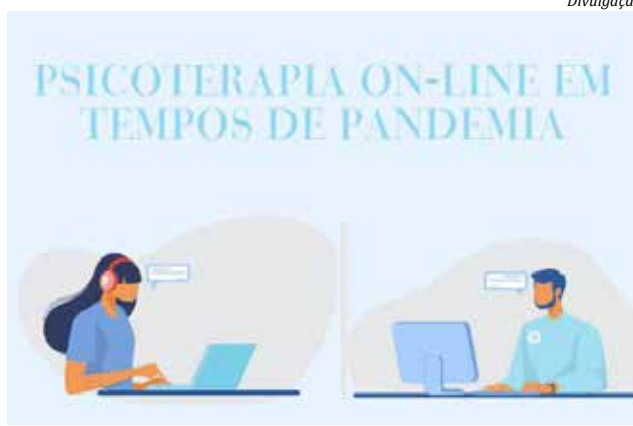
Psicoterapia on-line permite dar continuidade ao atendimento que antes era realizado de forma presencial

Tanto a psicoterapia presencial como a on-line devem seguir as diretrizes do Código de Ética do Profissional Psicólogo, no que se refere ao sigilo, confidencialidade e uso de técnicas conhecidas e regulamentadas, com base na ciência psicológica. Com a pandemia da Covid-19, o Conselho Federal de Psicologia (CFP) editou a resolução CFP nº 4 de 2020, que flexibiliza a atuação de forma remota e reforça a necessidade de cumprimento do Cód-