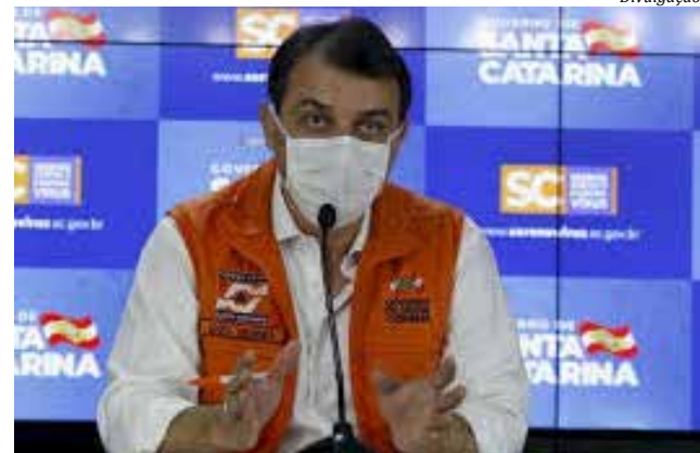
Leis foram sancionadas segunda-feira pelo governador Carlos Moisés