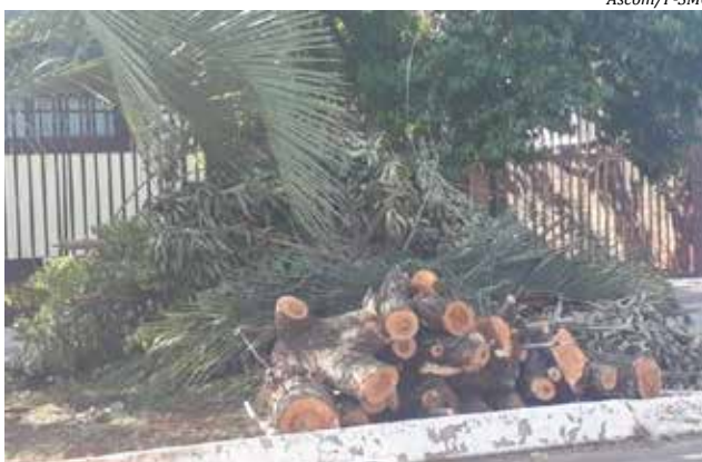
Os moradores que efetuarem o serviço por conta própria, são responsáveis pela destinação destes galhos

“Estamos há meses, talvez anos, promovendo campanhas salientando a importância de cada um fazer a sua parte. As pessoas já sabem o que precisam fazer, basta que façam. Temos mais de cem casos de dengue em nossa cidade, estamos enfrentando uma situação difícil de estiagem, e ainda uma pandemia de Coronavírus, e alguns ainda não entendem que não é mais possível esperar que o poder público atenda sozinho a todas as demandas. Além de direitos, as pessoas também têm de-