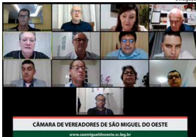
Vereadores aprovaram projetos de lei em segunda votação em sessão virtual

O projeto autoriza o município a conceder férias de forma antecipada, em situações de emergência, calamidade pública ou outras consideradas excepcionais, ainda que o servidor não tenha completado o período aquisitivo. O mesmo vale para licença prêmio, que pode ser concedida de forma antecipada, ainda que o servidor não tenha completado o período aquisitivo. O projeto também prevê que caso o servidor agraciado com as férias