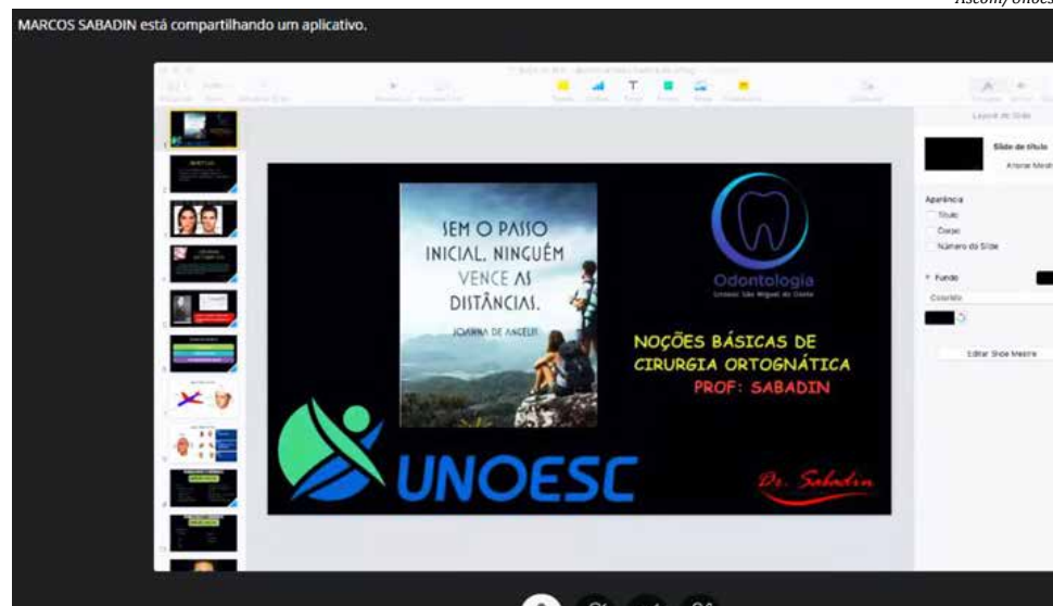
Curso foi ministrado por meio de webconferência