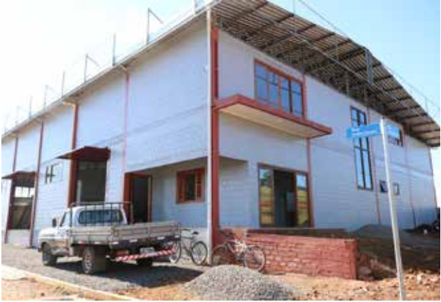
Duas empresas estão com seus pavilhões prontos e duas em fase de construção