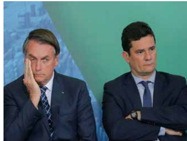
Saída de Sergio Moro não impactou popularidade do presidente

A pesquisa do Datafolha realizada e divulgada em 27 de abril aponta que Bolsonaro tem 33% de ótimo/bom e 38% de ruim/péssimo. Collor e Dilma sofreram impeachment quando tinham entre 10 e 15% de ótimo/bom e mais de 65% de ruim/péssimo. Isso indica que o impeachment é politicamente inviável sem um apoio quase unânime da opinião pública.