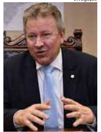
Deputado Celso Maldaner

Para o deputado federal Celso Maldaner, é uma questão de justiça. “A medida garante o benefício para trabalhadores como catadores de materiais recicláveis, diaristas, garçons e inclui outras importantes categorias como os agricultores familiares, os assentados e os pescadores artesanais, entre outras categorias que não estavam definidas no primeiro projeto sancionado”, comemorou.