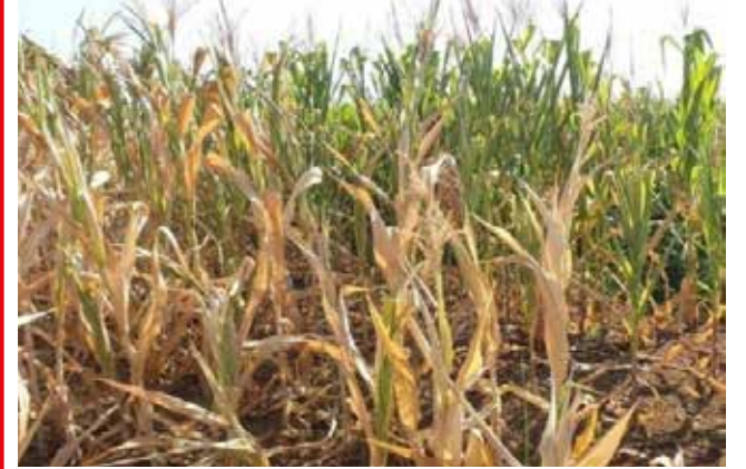
Perdas no milho chegam a 10%, o que representam 276 mil toneladas