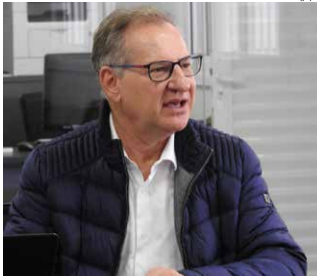
Prefeito Wilson Trevisan

O prefeito Wilson Trevisan enviou o projeto para análise da Câmara no final da tarde de segunda-feira para ser apreciado em regime de urgência, em virtude da pandemia causada pelo Coronavírus. "Estudos demonstram que a desigualdade social pode ser um fator de forte influência na contaminação pelo Coronavírus. Por isso, enquanto as aulas estiverem suspensas, nossa intenção é manter estas crianças e adolescentes nutridos e com uma boa imunidade, auxiliando no bem-estar destas famílias", salienta.