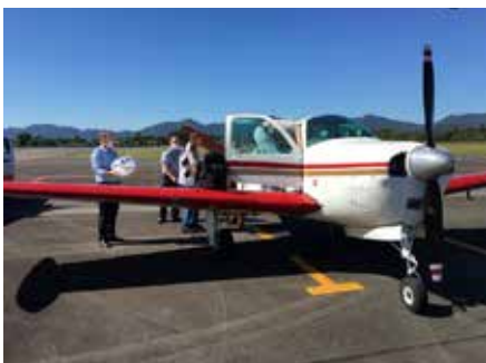
Equipamentos são transportados em articulação do Comdefesa da Fiesc com a Defesa Civil e o Aeroclub de SC

Mais três respiradores pulmonares artificiais consertados pelos Institutos SENAI de Inovação em Sistemas de Manufatura e em Processamento a Laser, localizados em Joinville, foram restituídos à rede pública e privada de saúde. Com a entrega, na quinta-feira (dia 16) de dois equipamentos ao Hospital e Maternidade de Santa Cecília e um ao Pró-Rim (de Joinville) já são dez aparelhos restaurados. Os respiradores são considerados de extrema importância nos casos graves de Covid-19, doença que afeta o sistema respiratório. A estimativa é de que cada respirador possa salvar de dez a 20 pessoas. O transporte dos respiradores a Santa Cecília, na Serra