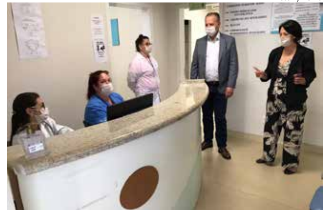
Prefeito Wilson Trevisan esteve visitando os órgãos de saúde ontem

de coronavírus chegou ao Brasil. "Não é possível ficar esperando as ações de estado e governo federal, que são muito lentos. Em São Miguel do Oeste estamos sendo proativos, tomando as medidas devidas de forma antecipada. Foi assim com a montagem do Centro de Triagem no Salão Paroquial, isolamento de áreas da UPA 24h para atendimento exclusivo a pessoas com sintomas de doenças respiratórias e contratação de médicos e outros profissionais. Com a ampliação dos testes, novamente estamos nos antecipando e fazendo algo que o governo de Santa Catarina e o Ministério da Saúde não conseguem com a agilidade necessária. Nosso receio é que as iniciativas das outras esferas de governo cheguem tarde demais", observa Trevisan. A definição das pesso-