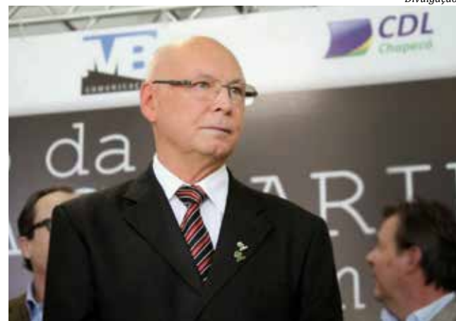
Aristides Cimadon, reitor da Unoesc

Apesar do momento difícil e dos pedidos dos estudantes, a Unoesc entende que neste momento não haverá redução do valor das mensalidades. Cimadon afirmou, no entanto, que a Universidade, com base na orientação do Ministério Público e Procon, irá isentar a cobrança de multa e de juros das mensalidades a serem pagas com atraso.