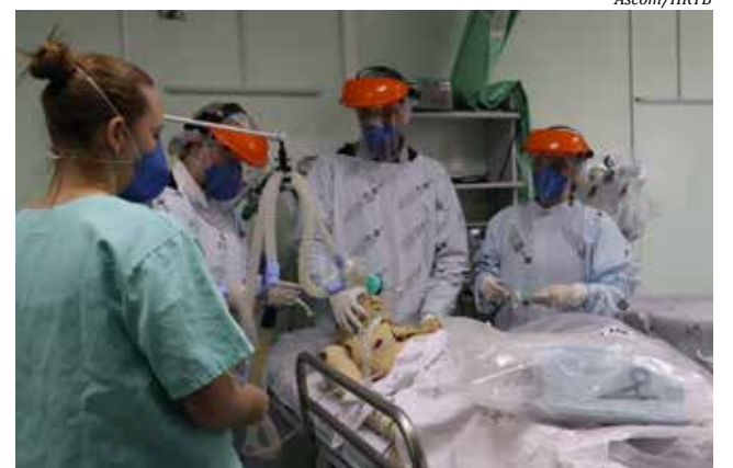
Simulados de atendimento a pacientes com Coronavírus foram realizados pelo hospital

O Hospital realizou de quarta a sexta-feira da semana passada simulados de atendimento a pacientes com suspeita de infecção por Coronavírus. Além das simulações, a unidade hospitalar vem realizando treinamentos desde o início da pandemia. As capacitações visam preparar profissionais de saúde para agir em situação de contato com uma pessoa infectada e foram baseadas nos