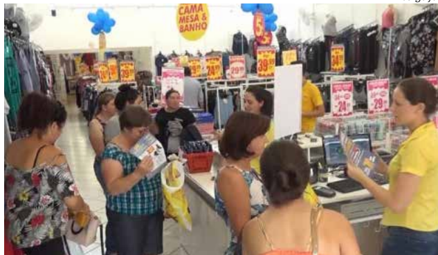
Comércio, setor mais impactado, teve queda média de 68%, apontada por 94% dos empresários

Em relação ao faturamento, 91% dos entrevistados apontaram uma redução média de 64,63%. O valor total de perda no universo dos micro e pequenos negócios é de cerca de R$ 9,4 bilhões. O setor do agronegócio foi o menos impactado, com 69,3% dos entrevistados alegando queda média de 42% no faturamento. No setor de serviços, a queda média de 62% foi registrada por 89% dos entrevistados, na indústria a média foi de 60%, apontada por 93% dos entrevistados. Por fim o comércio, setor mais