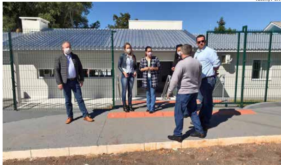
Instalações foram entregues na semana passada pela administração