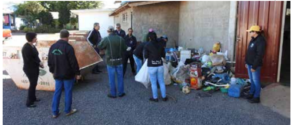
Ação da prefeitura de São Miguel do Oeste novamente recolheu lixo e entulhos

No bairro em que residem os pacientes foram encontrados dois grandes focos do mosquito Aedes Aegypti . Os focos foram localizados durante uma varredura feita no bairro