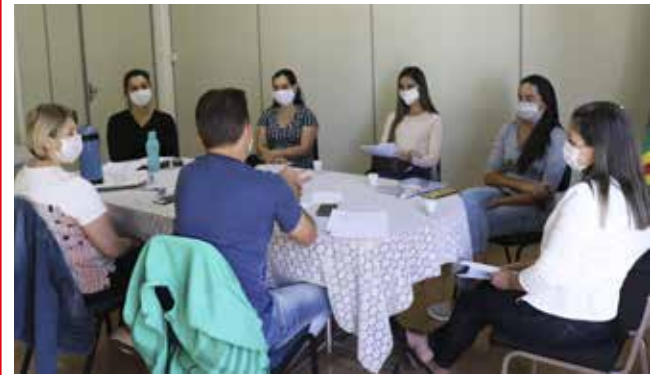
Comissão Especial de Educação optou pela realização de aulas não presenciais a fim de minimizar as faltas das aulas