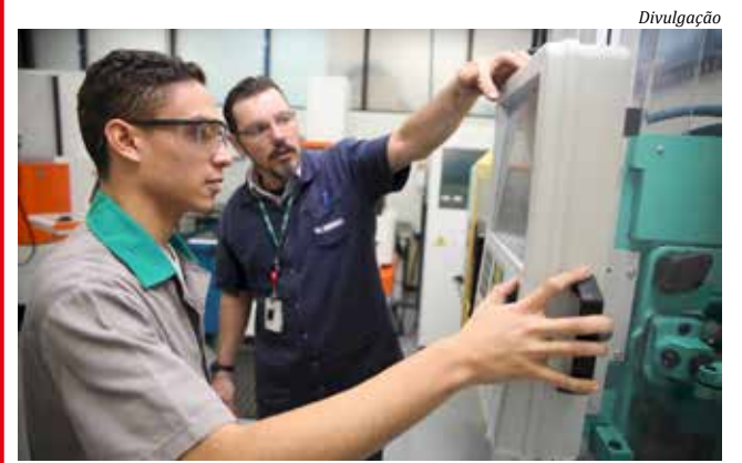
Senai é uma das entidades atingidas pelo cortes