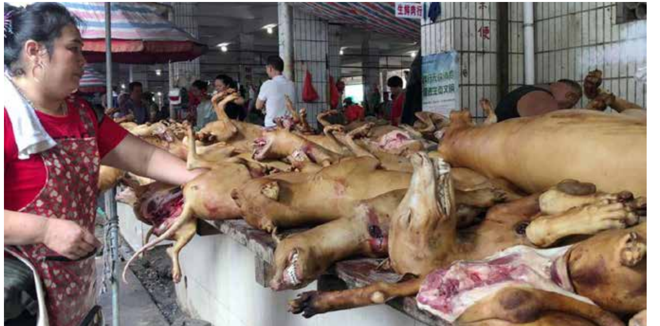
É comum na China a comercialização da carne de gato, cachorro, cobra, morcego, rato e outros

Então, Sr. Tedros, convença o teu correligionário Xi Jinping a proibir o povo chinês de comer gato, cachorro, cobra, morcego, rato, entre outros. Convença o mandatário do partido único a trocar as máscaras e os respiradores pela carne brasileira e distribua para o seu povo miserável. Talvez assim o Sr. possa contribuir para com a saúde mundial