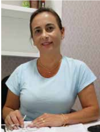
Autora: Prof.ª Dr.ª Soeli Staub Zemruski

Professora da rede estadual de SC e do Mestrado em Práticas Transculturais UNIFA CVEST - Lages SC