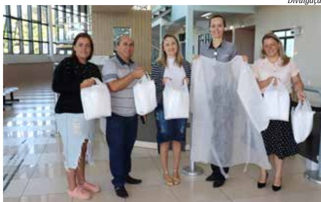
Doações foram entregues ao Hospital na semana passada

Entidades e empresas estão auxiliando o Hospital Regional Terezinha Gaio Basso com doações de