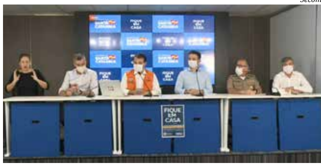
Medidas foram anunciadas em pronunciamento do governador Carlos Moisés