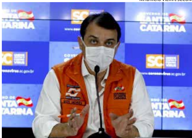
Governador de Santa Catarina, Carlos Moisés

Para tentar contornar o problema, o governo do Estado divulgou que vai pagar o teto do convênio