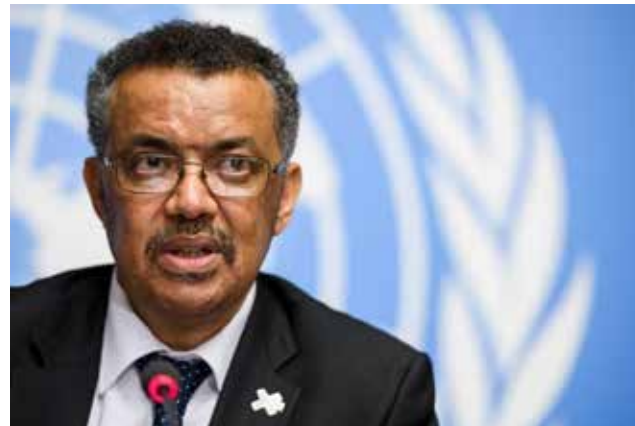
Deu no jornal: "Tedros Adhanom é contra o remédio que pode trazer a cura para o coronavírus e arrecadou mais de US$ 3 bilhões para OMS", disse o jornalista

Mas como eu vivo das minhas ideias, na função de escriba, resolvi opinar sobre o laçao do partido único. É isso mesmo, só tem um partido e um mandatário que faz o diabo, como disse a ex-presidente Dilma, para se manter no poder e quer ser intitulado democrata.