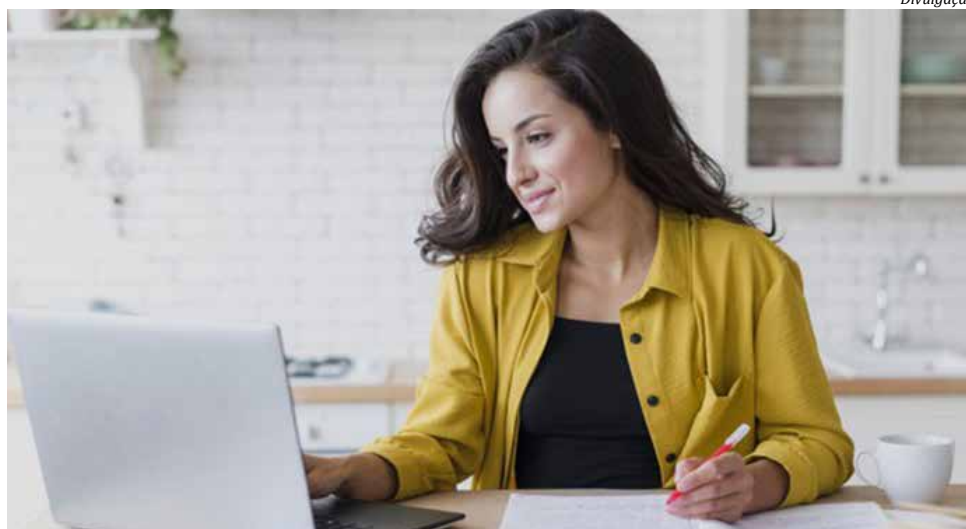
Cursos estão com as inscrições abertas

Com o propósito de oferecer uma contribuição para quem está em casa neste momento de isolamento social para prevenção do Coronavírus, a Unoesc Virtual está disponibilizando cursos de extensão EaD para a comunidade. As inscrições não têm custo e podem ser feitas no site da Unoesc. Estão disponíveis os cursos de Aplicação das Normas da ABNT em trabalhos acadêmicos, Nivelamento em Língua Portuguesa, Nivelamento em Matemática, Nivelamento em Química, Gestão financeira, Direito Ambiental, Gestão da Qualidade, Excel e Introdução ao Ambiente Virtual de Aprendizagem (AVA) da Unoesc, para auxiliar todos os interessados na utilização das ferramentas on-line dos cursos da Universidade. Além desses, gradativamente serão liberados