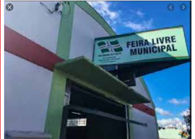
Comercialização de peixes prossegue hoje na Feira Livre Municipal