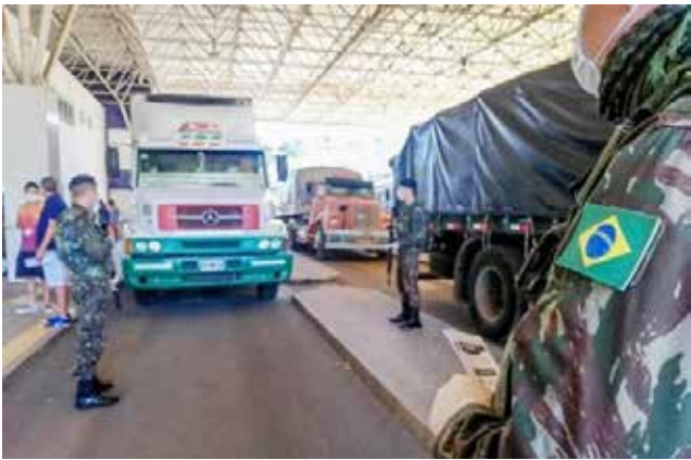
Exército vai patrulhar as áreas de fronteira