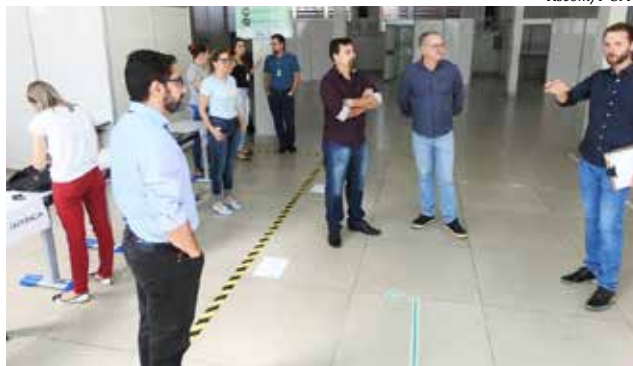
Prefeito Wilson Trevisan e demais autoridades vistoriaram o local

Regional Terezinha Gaio Basso já organizaram espaços para fluxo de atendimento exclusivo a estes pacientes, para que não entrem em contato com outras pessoas e aumentem os riscos de contaminação. A iniciativa deve-se, também, como uma forma de preparação ao possível incremento da movimentação nestes dois locais, já que as unidades básicas de saúde não terão atendimento durante o final de semana.