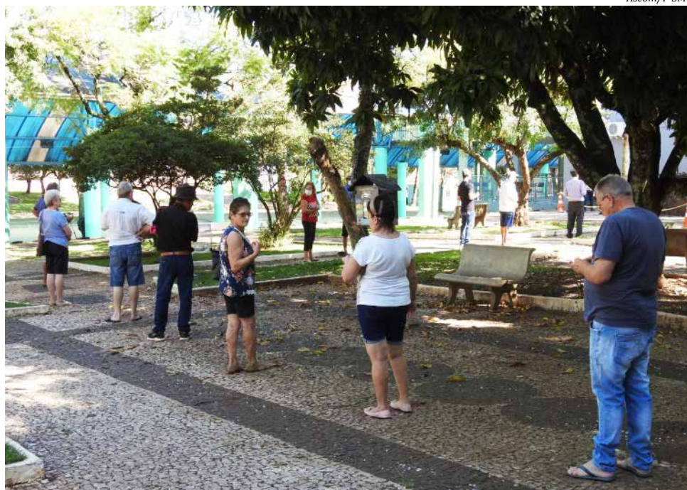
Um grande número de pessoas procurou a imunização na praça, feita ao ar livre e com filas organizadas

Para vacinação, o horário de atendimento é de segunda a sexta-feira, das 07h30 às 17h, sem interrupção ao meio-dia, e, aos sábados, das 08h às 12h. O secretário