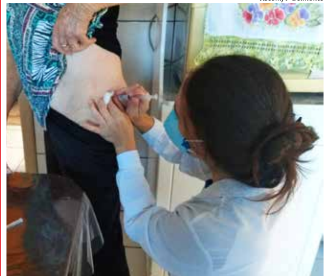
Idosos estão sendo imunizados na cidade e no interior, em casa