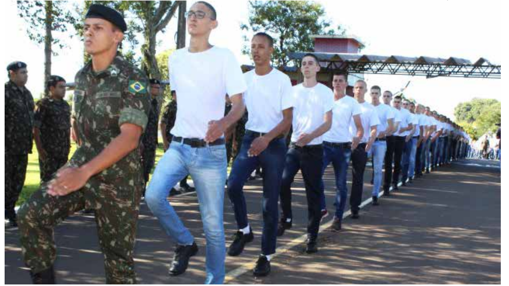
Os 240 recrutas vêm de diversos municípios da região

A partir da incorporação, os recrutas começam a se familiarizar com a rotina e com as práticas comuns ao ambiente militar. Nesse período, o jovem ini-