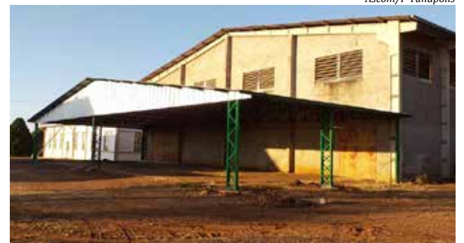
Investimento da prefeitura foi superior a R$ 42 mil

A empresa que executou a obra, vencedora do certame, foi a Pré Lajes, de São Miguel do Oeste. O investimento da prefeitura, com recursos próprios, foi de R$ 42.994,00. Em 2019, o ginásio da comunidade recebeu um investimento na estrutura do piso que não mais oferecia condições de prática de esportes com segurança.