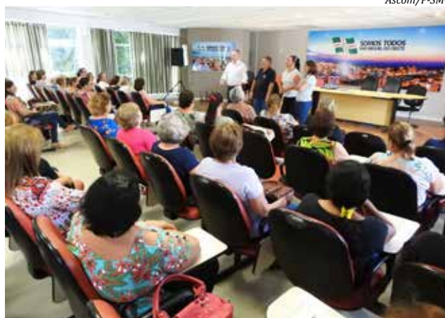
Reunião aconteceu no salão nobre da prefeitura

Na programação dos Clubes de Mães, está agendado para o dia 09 de maio, o 4º Chá das Mães "Sabor, Saber, Saúde", em comemoração ao Dia das Mães. Já para o dia 15 de novembro, o Encontro das Mães, que neste ano acontece no Bairro Saleté.