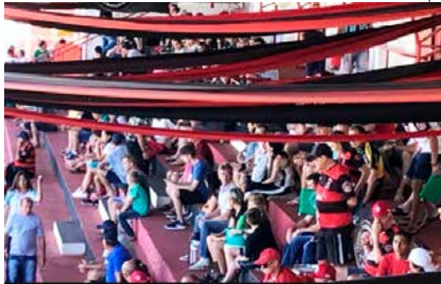
Torcedores lotaram o estádio Padre Aurélio Canzi

Em Itapiranga, o Cometa recebeu o Aliança