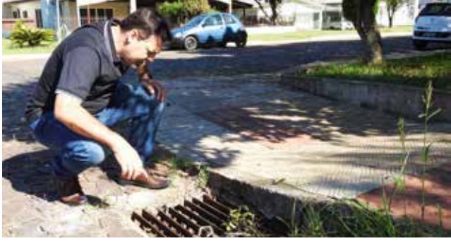
Trabalhos iniciaram ontem em bairros