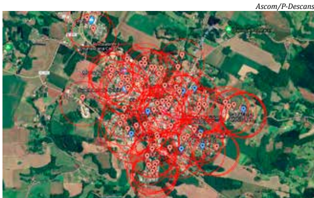
Mapa mostra a localização dos 120 focos do mosquito em Descanso

Edilene, as penalizações continuam sendo aplicadas. "Até o momento, 14 donos de imóveis foram advertidos, realizamos 33 infrações e nove multas. Quando são identificadas