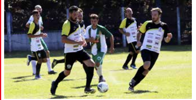
Pelo menos 20 gols foram marcados nessa primeira rodada