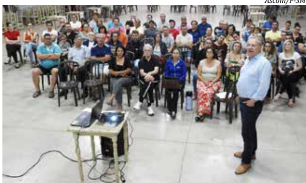
O prefeito e sua equipe de governo estiveram por cerca de duas horas em cada localidade

Na manhã de sexta-feira, 28, o prefeito reuniu-se com os secretários municipais em seu gabinete para uma reunião de trabalho, a fim de encaminhar soluções para as demandas apontadas pelos moradores durante os encontros nos dois bairros. Terça foi