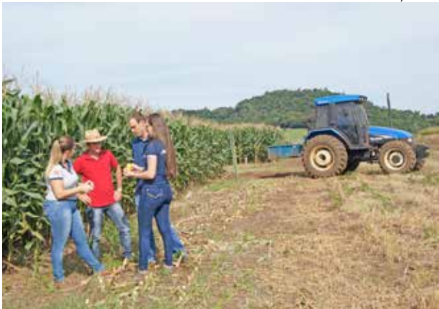
Acadêmicos desenvolvem diversas atividades práticas na Fazenda Escola