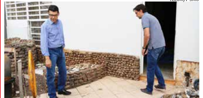
Prefeito Plínio de Castro está acompanhando as obras