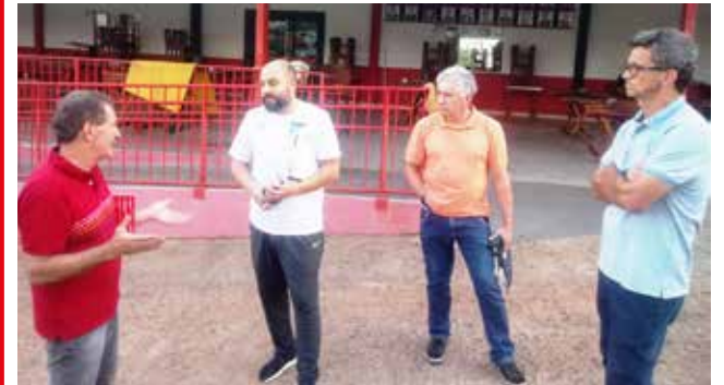
Dirigentes da FCF fizeram vistoria completa na sede do clube