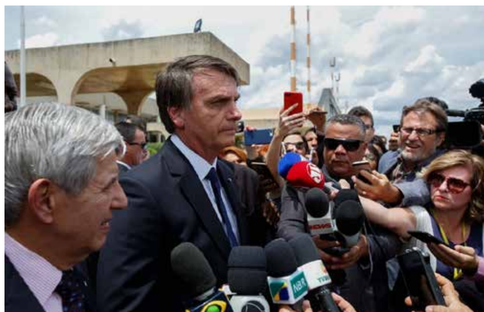
Em cartilha, governo diz que autoridades não devem expor jornalistas