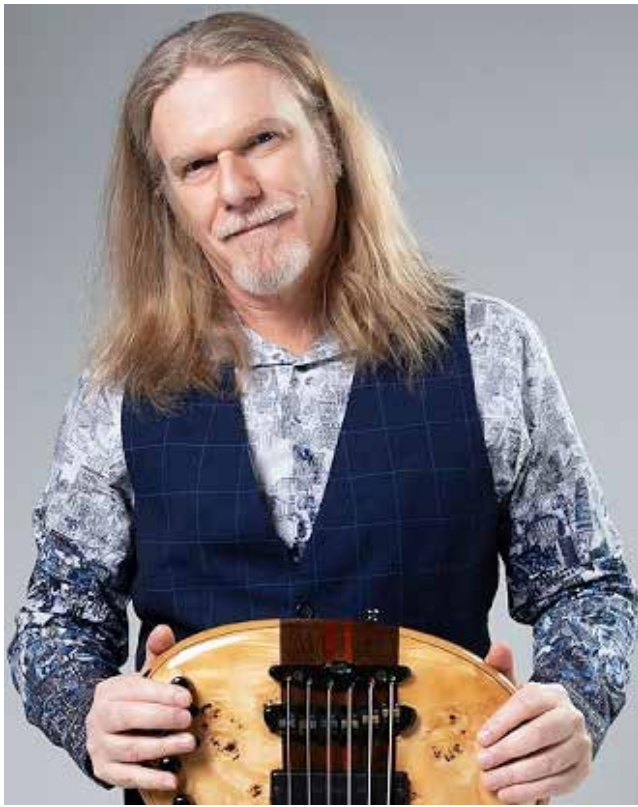
Humberto Gessinger se apresenta neste sábado no Centro de Eventos Latitude

Informações - inclusive sobre ingressos e mesas bistrô (os camarotes já foram todos vendidos): (49) 9 9988 0547; 9 8812 5200 e 9 9903 1588.