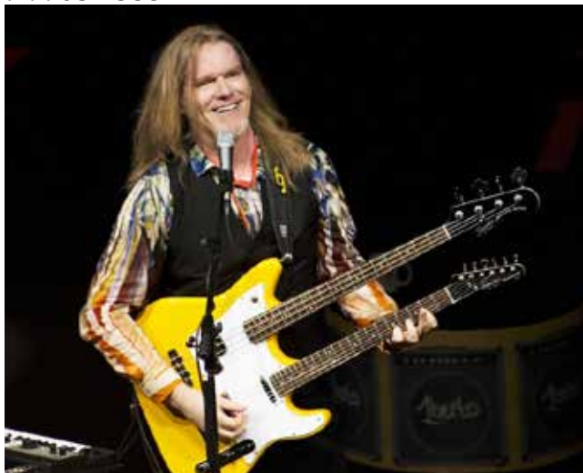
Dia 07 de março, no Centro de Eventos Latitude, tem show com Humberto Gessinger

Informações - inclusive sobre ingressos e mesas bistrô (os camarotes já foram todos vendidos): (49) 9 9988 0547; 9 8812 5200 e 9 9903 1588.