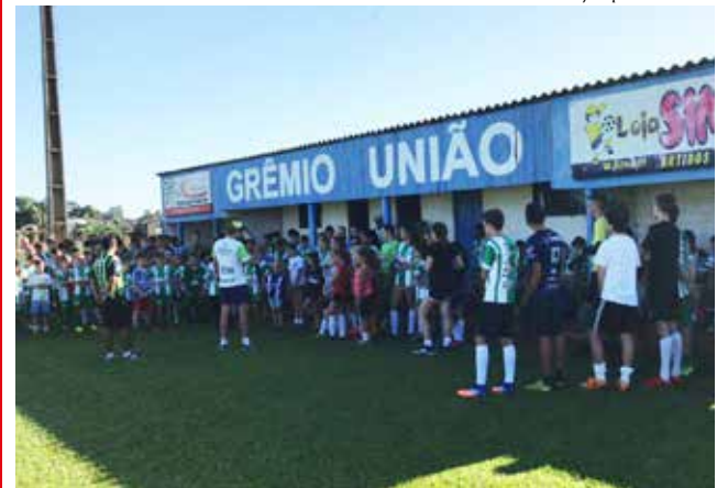
Abertura das atividades envolveu meninos e meninas