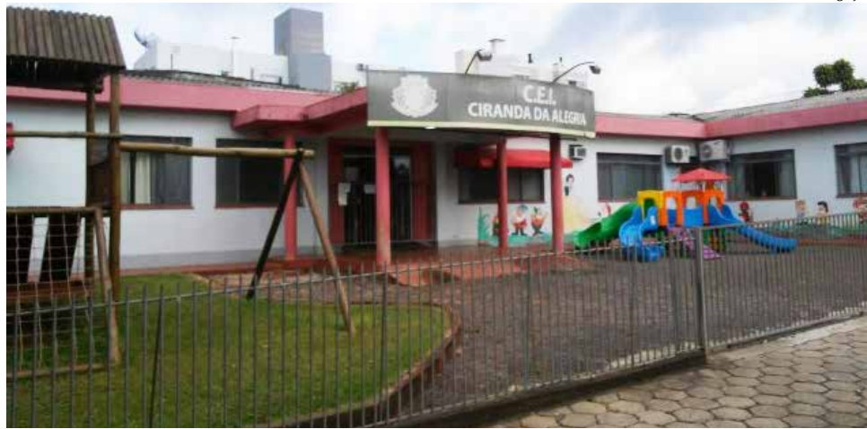
Creche Ciranda da Alegria está localizada no centro da cidade