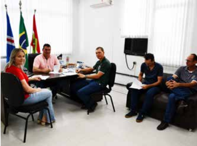
Termo de fomento foi assinado segunda-feira entre a administração e a Associação