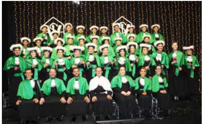
Colaram grau 33 formandos das nonas turmas