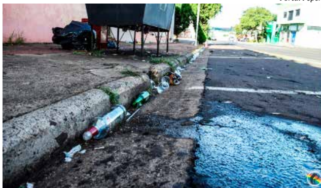
Em finais de semana, garrafas de bebidas são deixadas nas ruas do centro