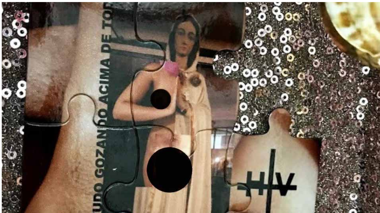
O Centro Cultural Hélio Oiticica informou que uma equipe da secretaria municipal de Cultura esteve no espaço e pediu que a classificação, que era de 10 anos, fosse mudada para 16 anos. As peças ainda estão na exposição.