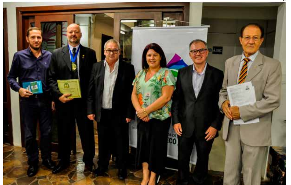
Novos confrades marcaram presença no evento