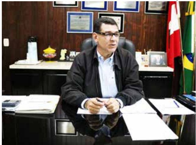
Prefeito Plínio de Castro