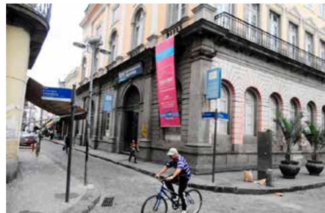
Centro Cultural Hélio Oiticica, no Rio de Janeiro

O Centro Cultural Hélio Oiticica informou que uma equipe da secretaria municipal de Cultura esteve no espaço e pediu que a classificação, que era de 10 anos, fosse mudada para 16 anos. As peças ainda estão na exposição.