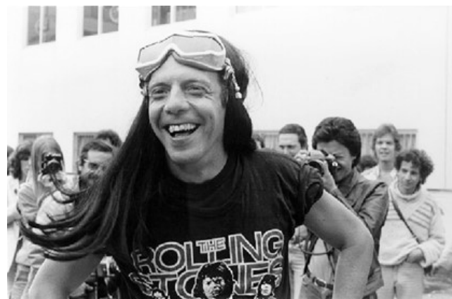
Hélio Oiticica, que empresta o nome ao museu, em foto de 1978, em São Paulo