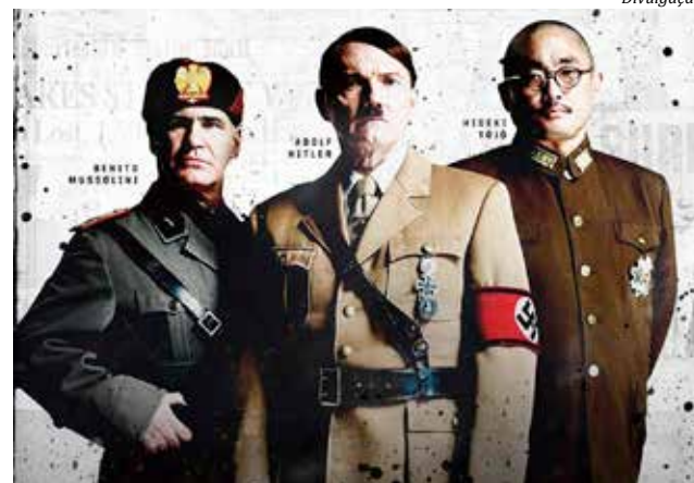
Benito Mussolini, Adolf Hitler e Hideki Tojo

Stálin exigia os bombardeios, já que o desembarque aliado pela França ainda estava apenas nos planos, para "amaciar" os alemães diante do inexorável avanço do Exército Vermelho, que culminaria com a queda de Berlim, em 2 de maio daquele ano.