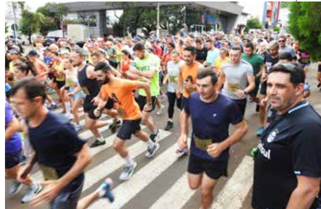
O evento, realizado pela Secretaria de Esportes, em parceria com a Acismo, integrou as atividades alusivas ao aniversário de 66 anos de São Miguel do Oeste