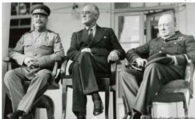
Josef Stalin Franklin Roosevelt e Winston Churchill

E como é fácil encontrar argumentos, se não fáceis, dignos de consideração: o inimigo era o nazismo, a Alemanha tinha iniciado a hedionda "guerra total", sem diferenciar entre combatentes e civis.