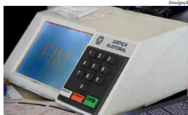
A biometria é obrigatória em 188 das 295 cidades do Estado

Segundo o Tribunal, a Justiça Eleitoral no Estado