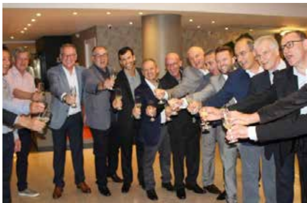
Empreendedores associados comemoraram a inauguração do empreendimento

resultado da iniciativa de 15 sócios, que investiram cerca de R$ 25 milhões no projeto. O hotel está localizado na Rua Duque de Caxias, esquina com a Rua Mem de Sá, número 311. O hotel tem 118 quartos, dos quais 74 já estavam em operação antes mesmo da inauguração. Com alto padrão executivo, o Hotel Figueiras oferece quartos master, com mais de 23 m 2 , cama box grande, ar condicionado, TV 42 po-