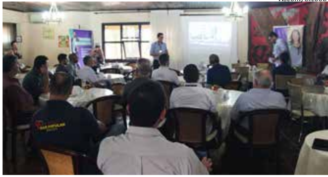
Agência reuniu associados segunda-feira