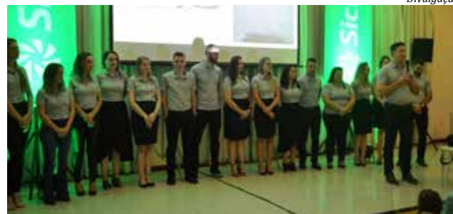
Assembleia aconteceu segunda-feira, no Clube Comercial