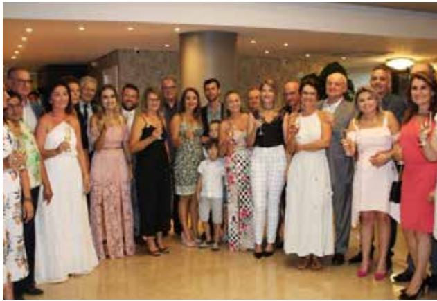
Empreendedores e familiares participaram da inauguração

rada para atrair os turistas que passam pelo Extremo-Oeste.