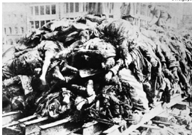
Bombardeio de Dresden, em 1945

O bombardeio incendiário da cidade foi feito pelo "lado do bem" durante a II Guerra, mas as questões morais continuam as mesmas: vale tudo na guerra?