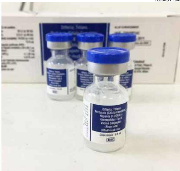
A vacina imuniza contra meningite, tétano, difteria, coqueluche e hepatite B

“Tentamos contato com os pais ou responsáveis destas crianças, mas em alguns casos não obtivemos sucesso nas tentativas. É importante que tragam seus filhos o mais breve possível para regularizar a situação. Caso contrário, as doses serão disponibilizadas para outras crianças que entraram há menos tempo na fila de espera”, explica. As demais terão que aguardar as próximas remessas, ainda sem data prevista.