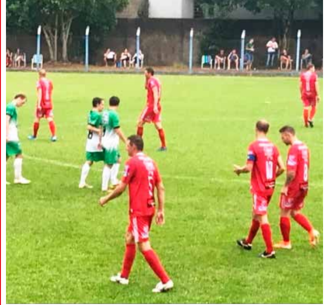
Pérola perdeu para o Harmonia por 2 X 1 no primeiro jogo