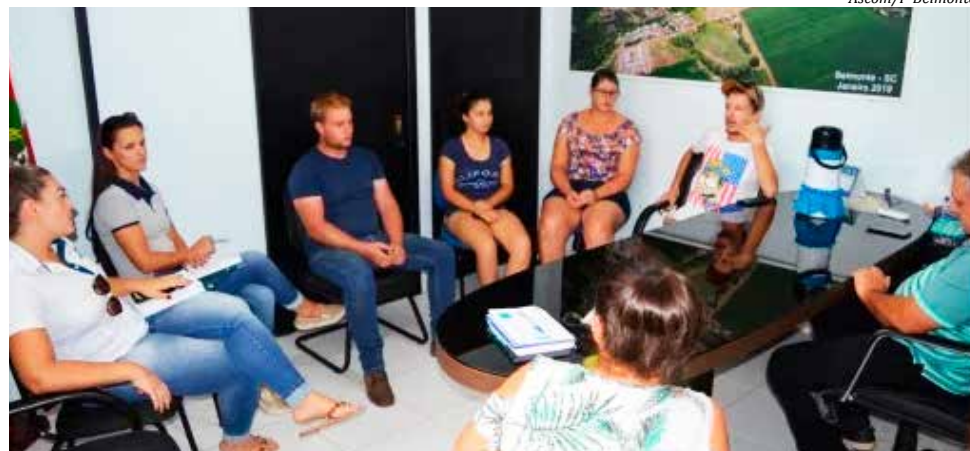
Reunião segunda-feira acertou detalhes do evento

Segunda-feira, 03, aconteceu uma reunião na prefeitura para a definição de detalhes relativos à feira, que terá um investimento superior a R$ 50 mil para contratação da