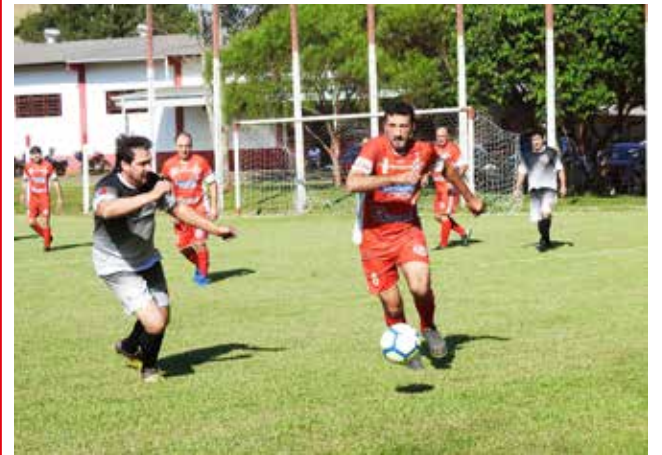
Internacional da Fátima e E.C. Vasco da Gama foi um dos jogos disputados