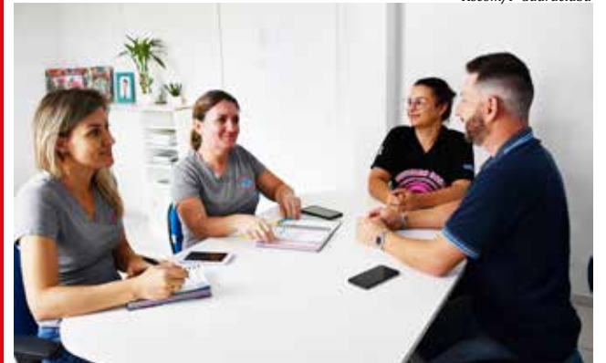
Reunião discutiu ações preventivas e educativas para diminuir os riscos