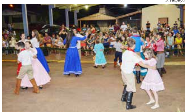
Dança gauchesca é uma das oficinas oferecidas