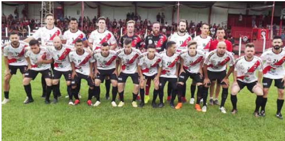
Guarani garantiu a liderança do Grupo B, com 15 pontos ganhos

O time da casa largou pressionando e criando boas chances, mas com o tempo o Harmonia se acentuou em campo e passou a sofrer menos perigo. Até que aos 38 minutos, Croco fez bela jogada pela direita, entortou o marcador, foi ao fundo e colocou na cabeça de Roger, que