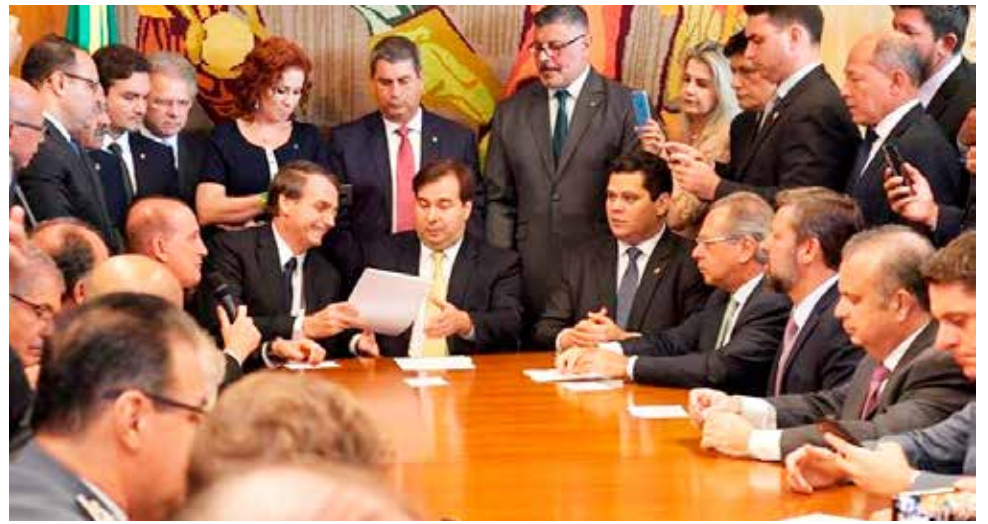
Bolsonaro entrega proposta da reforma da Previdência

Na nossa "Pátria amada" há muito tempo não se via um governo que faz política com base nos interesses nacionais e não em acordos partidários ou na base do toma lá, dá cá; que compõe seus quadros com agentes qualificados tecnicamente. Que se comunica de forma direta e clara com a população, sem se preocupar em agradar com o "politicamente correto". Que reduz o tamanho do Estado e da máquina pública, pondo fim a cargos e mamatas, desperdícios e privilégios. Que recoloca o Brasil como protagonista no cenário geopolítico internacional adotando em sua diplomacia o viés de interesses nacionais ao invés do alinhamento ideológico. Que faz acordos comerciais históricos. Que implementa medidas de liberalismo para facilitar a vida dos empreendedores nacionais e estrangeiros que queiram investir no país. Que põe fim ao império dos sindicatos e aos abusos do MST e congêneres. Que protege o território nacional e retoma o comando da soberania da Amazônia. Que enfrenta a questão indígena para o fim de libertar esses povos do jugo da escravidão cultural e da vida precária tendo eles tanto riqueza. Que estabelece limites claros para intervenção das ONGs no âmbito interno. Que enfrenta problemas crônicos como o combate à corrupção, reduz a criminalidade e as injustiças previdenciárias. Que ao invés de extinguir programas sociais, os aprimora, concedendo 13º salário ao bolsa família