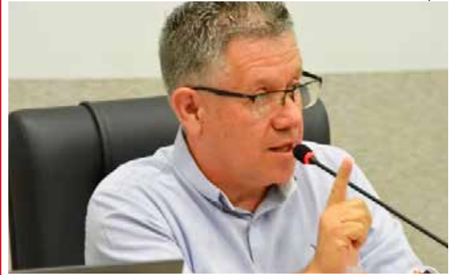
Vice-prefeito Alfredo Spier participou da sessão e falou das ações do governo