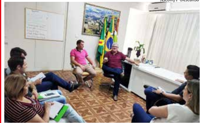
Reunião contou com a presença de secretários e representantes da Epagri e Casan