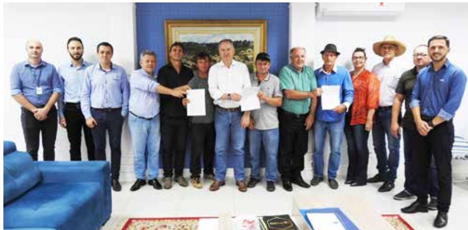
Autoridades participaram do ato de concessão dos primeiros financiamentos do programa