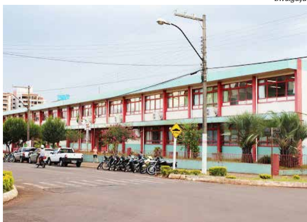
Colégio São Miguel, em São Miguel do Oeste, é o maior da região, com cerca de 500 alunos

A preparação do ambiente escolar para o início do ano letivo de 2020 também envolve a aquisição de móveis, computadores e livros para diversas escolas da rede estadual de educação. As entregas feitas pela Secretaria de Estado da Educação desde o dia 2 de