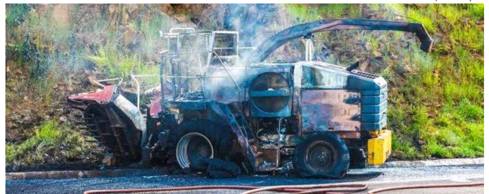
Máquina ficou destruída pelo fogo

Cerca de 2 mil litros de águas foram utilizados para fazer o rescaldo do