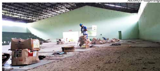
O investimento nas obras será de R$ 300 mil

prios, chega próximo de R$ 300 mil. O espaço é muito utilizado para a prática esportiva dos moradores do bairro, como sede de eventos oficiais do município, na área do esporte, além de ser utilizado pela Escola Municipal Integral Esperança.