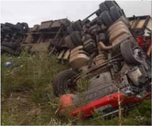
Acidente aconteceu na Rua Nacional 14, em Corrientes