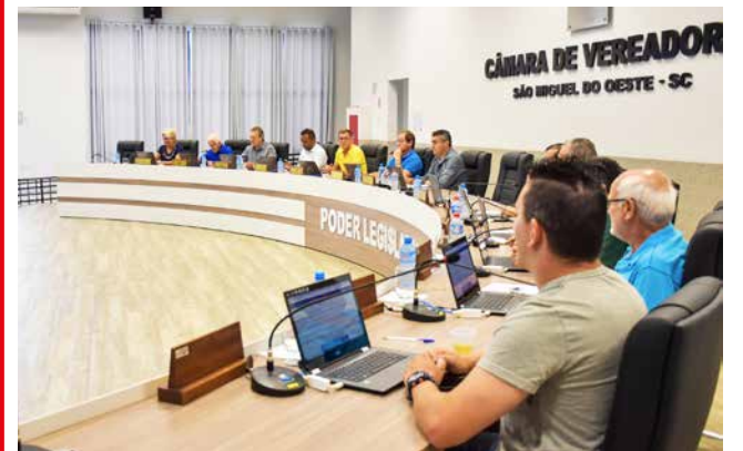
Vereadores aprovaram por maioria projeto de lei complementar prevendo a reposição inflacionária