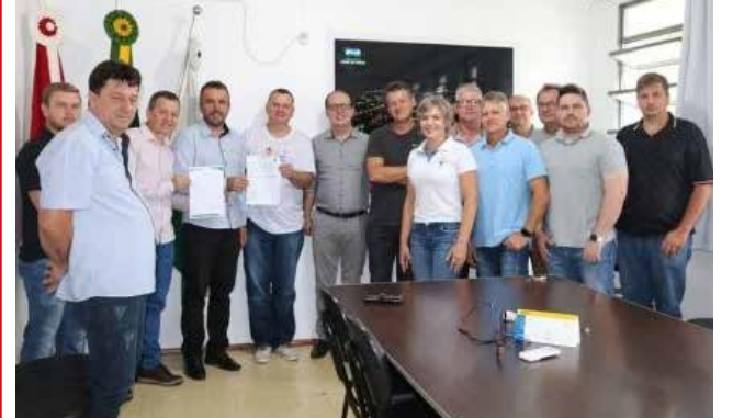
Primeira licença emitida pelo Conder foi entregue na manhã de ontem na prefeitura de Iporã do Oeste