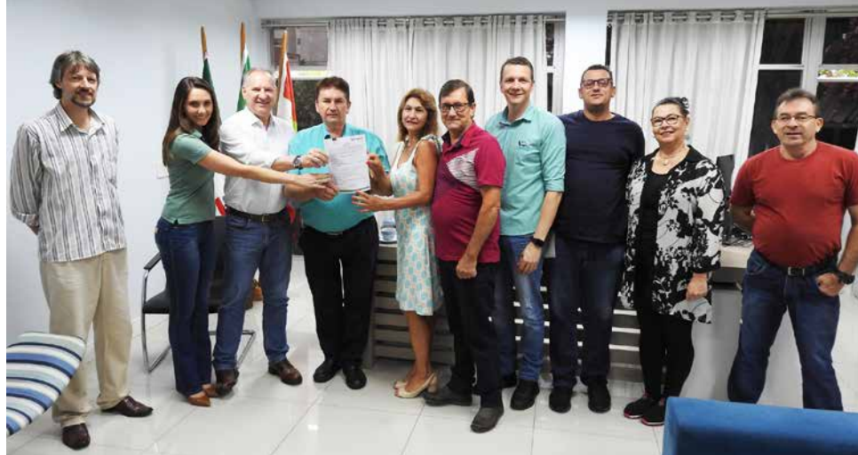
Primeira licença ambiental foi entregue a empresa loteadora