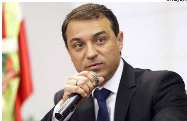
Pedido de impeachment foi protocolado na Alesc no dia 13