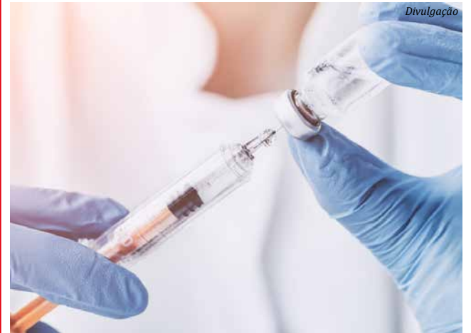
Mais de 200 crianças estão na fila de espera pela dose da vacina em São Miguel do Oeste