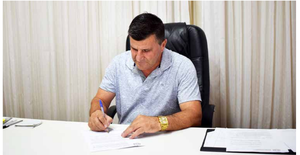
Prefeito Sadi Bonamigo

Segundo o prefeito Sadi Bonamigo, o reajuste salarial foi possível devido à saúde financeira do município e o compromisso que tem com todos os trabalhadores do serviço público. "O cuidado e responsabilidade com o