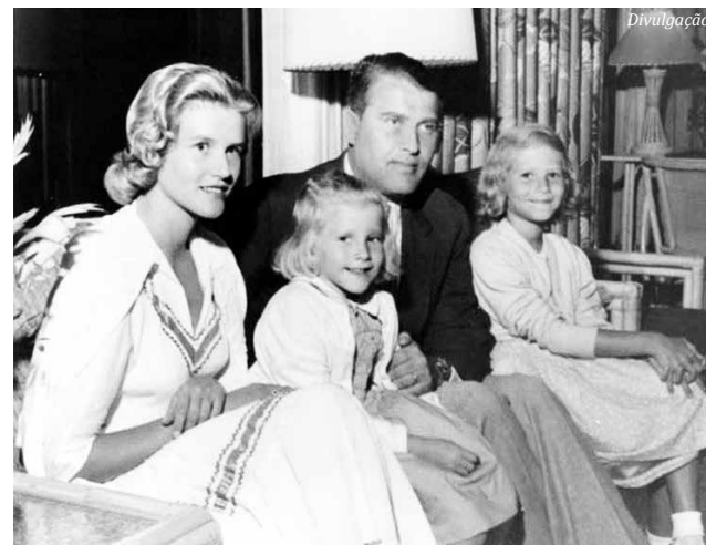
Família do Wernher von Braun

Na Europa, o engenheiro assombrou o mundo com a sua bomba V-2 e na América construiu a Agência Espacial Americana (NASA). Em Washington, palpitava no Pentágono e na Casa Branca recebia medalhas. No Brasil, Braun esteve duas vezes, provavelmente orientou o seu compatriota o ex-presidente Ernesto Geisel sobre o acordo nuclear com a Alemanha, sobre Angra I, II e III e o sonhado submarino nuclear, que agora o Capitão mandou construir em parceria com a França, que ainda não esqueceu a V-2 do Braun.