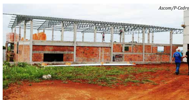
Novas empresas se instalaram no Parque Industrial 3

Segundo os dados do último levantamento da Associação dos Municípios do Extremo-Oeste, São José do Cedro obteve crescimento