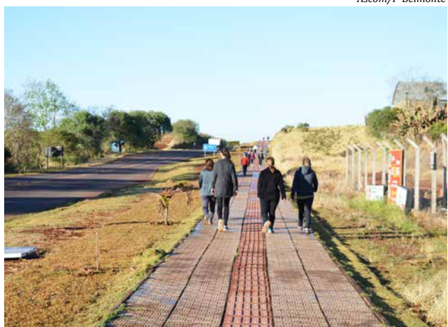
O grupo de caminhada "Comunidade em Movimento" retomou as atividades na segunda-feira