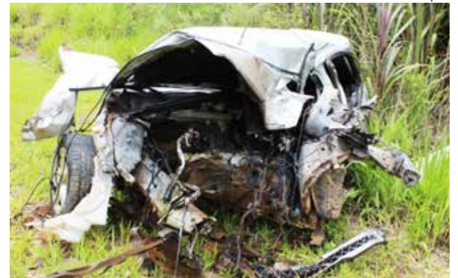
Ford Focus ficou totalmente destruído no choque frontal contra caminhão, em Paraíso