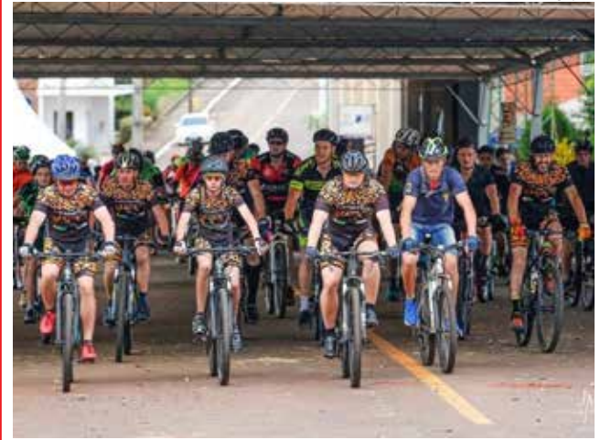
Evento vai acontecer no dia 15 de março