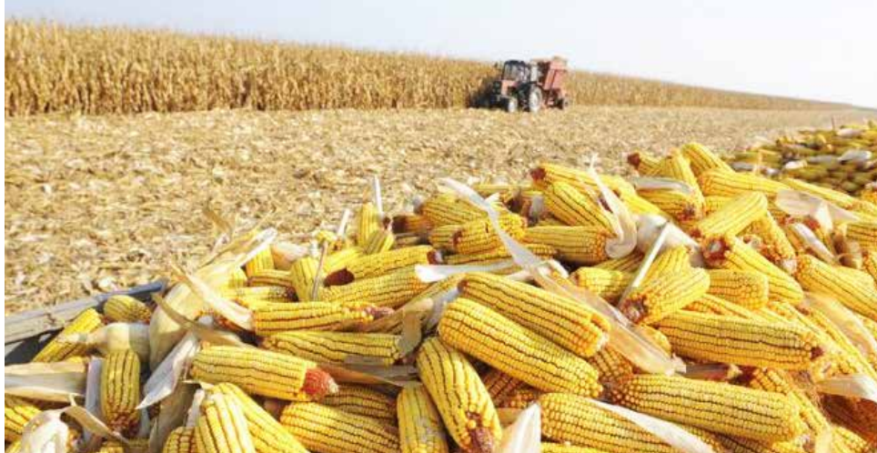
O milho retido na propriedade para nutrição do gado leiteiro teve redução de 40%, o que, certamente, impactará a produção de lácteos

O vice-presidente da Fiesc, Enori Barbieri, acionou os sindicatos rurais filiados para obter um quadro atualizado da situação. Uma faixa territorial do lado catarinense do Vale do Rio Uruguai, desde Itapiranga até os campos de Lages, está comprometida. O milho retido na propriedade