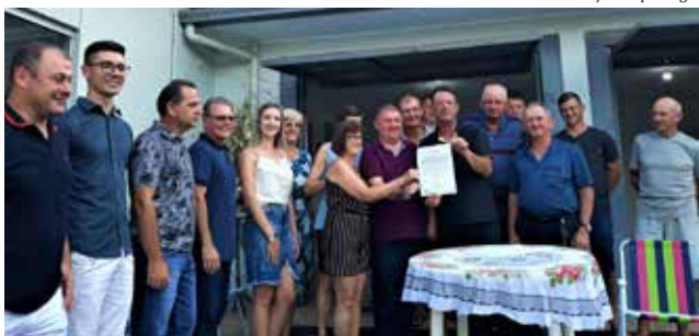
Entrega da ordem de serviço foi feita quinta-feira