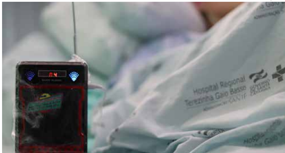
O rádio e os fones de ouvido são doações voluntárias e auxiliam na execução do projeto.

"O som faz emergir sentimentos e recordações da