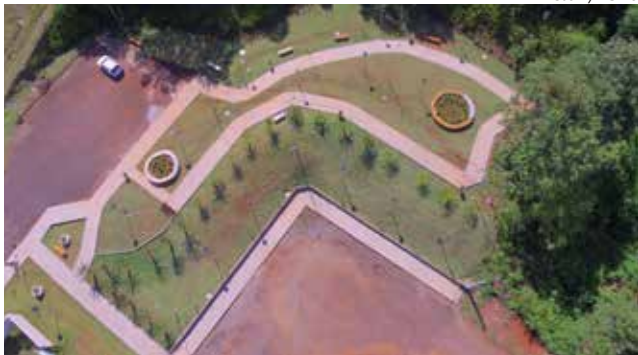
A praça está localizada, na Rua Ângelo Grolli, nas proximidades da Casan