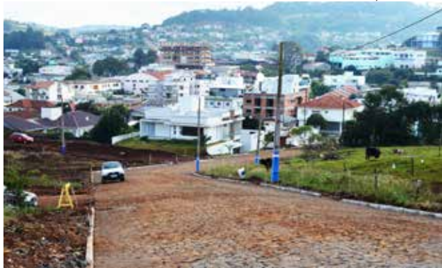
Rua Nossa Senhora de Fátima foi uma das vias beneficiadas

co Hoffmann, Luiz Scalco, Nossa Senhora de Fátima, Presidente Vargas, São José, Sestivo Armando Montagna e Tiradentes estão entre as ruas beneficiadas com as obras de infraestrutura referentes