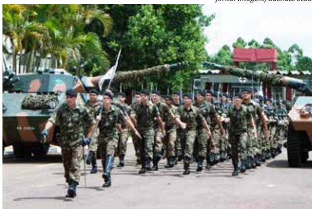
Desfile da tropa marcou a troca de comando