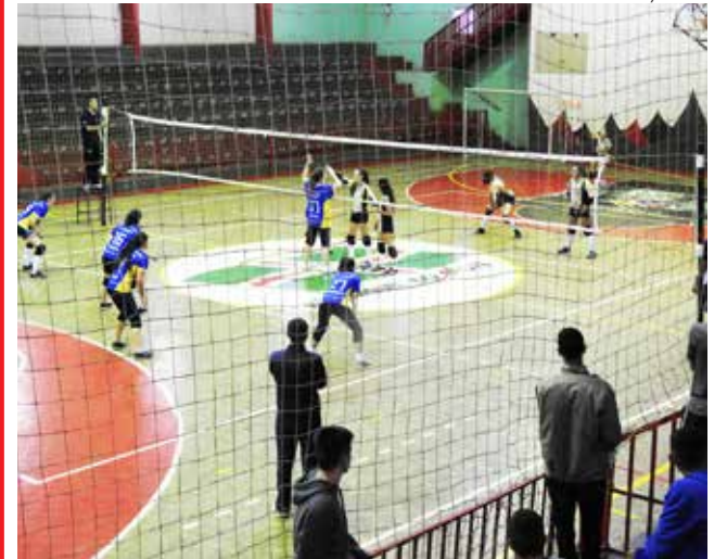
Espaço do ginásio é utilizado por entidades do município para treinamentos ou eventos