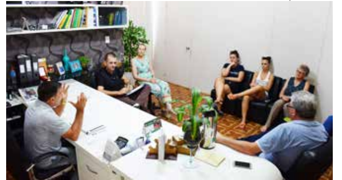
Empresárias solicitam regras mais rígidas para vendedores ambulantes