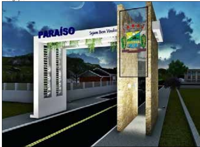
Portal deverá começar a ser construído nos próximos dias