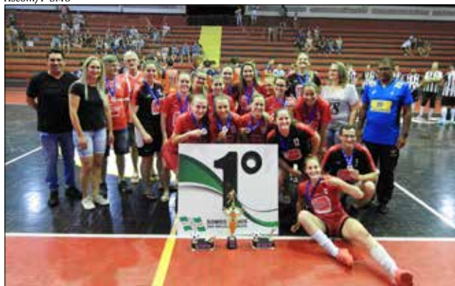
Equipe da Auto Elétrica Balbinot venceu na categoria feminina