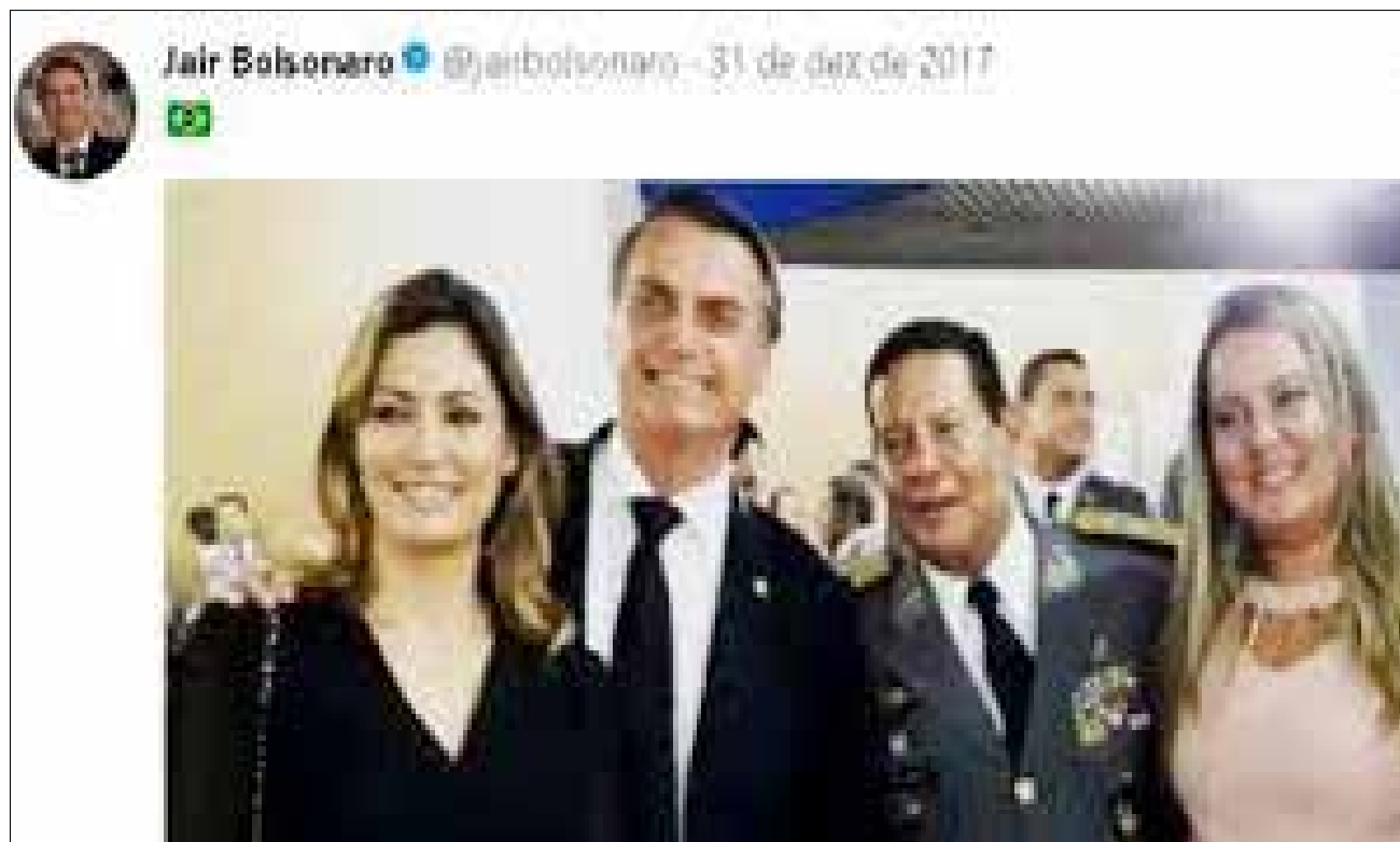
Cidadãos de primeira categoria

Por 35 anos, os paisanos mandaram e desmandaram na nossa republiqueta. Durante o período, entrevistei dois generais: o general Brasil, em meio ao mensalão disse que a fase era necessária, já o General Mourão, em meio ao Petrolão, disse que o Exército serve à Nação e não a governos e exemplificou: "Nos anos 40 a nação pediu a luta contra o nazi-fascismo e foi atendida; nos anos 60 pediu a luta contra o avanço comunista e foram atendidos. E sobre as reivindicações de agora, estamos preparados".