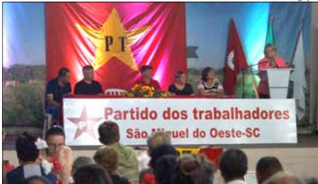
Posse contou com a presença de filiados e simpatizantes