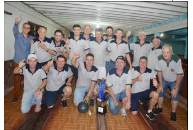
Guaraciaba levantou a taça na final realizada em Itapiranga