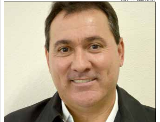
Prefeito Roque Meneghini