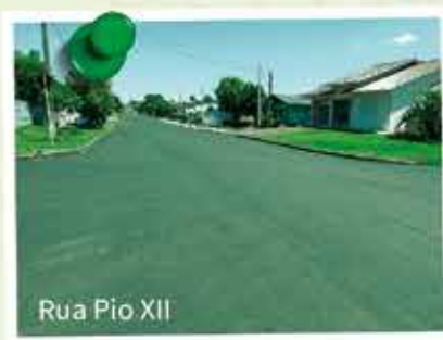
Rua Pio XII