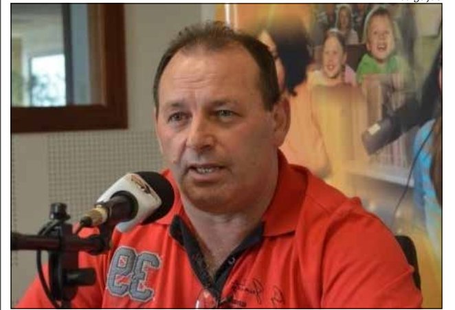
Prefeito Valdecir Casagrande