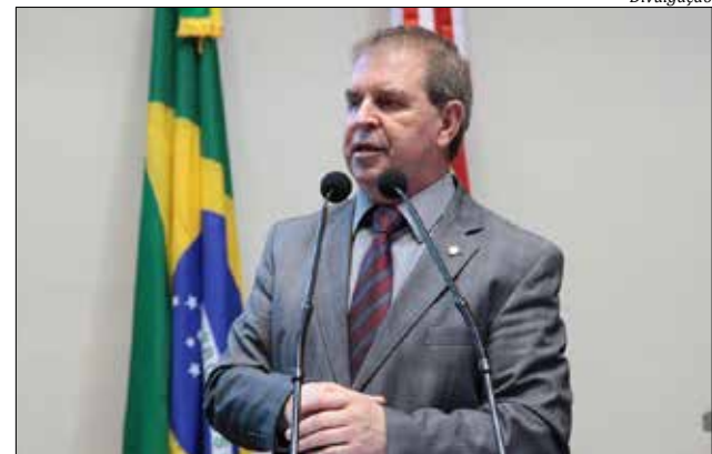
Deputado estadual Maurício Eskudlark