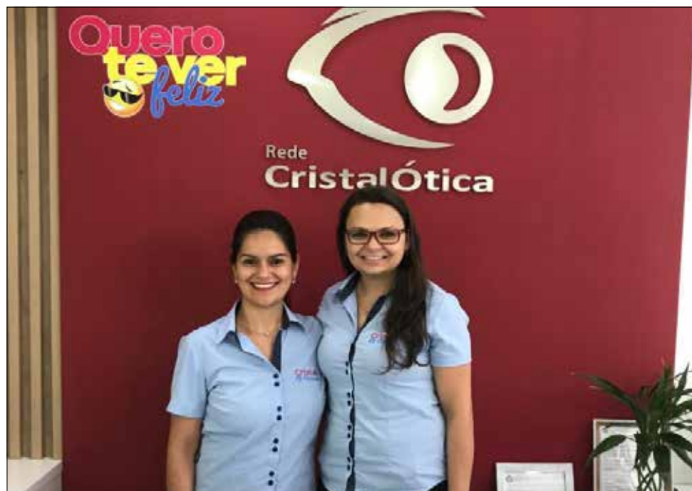
Equipe administrativa que comanda a rede de lojas em Santa Catarina e Rio Grande do Sul