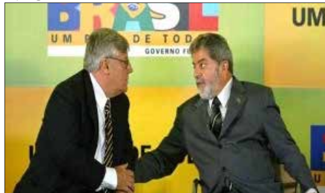
Lula & Lando, parece dupla sertaneja

No processo do mensalão, o publicitário Marcos Valério não tem mais possibilidade de ser beneficiado, porque só pode haver delação premiada antes do julgamento. Isso é óbvio, caso contrário nenhum criminoso pediria esse benefício durante o inquérito, simplesmente esperaria o julgamento e, se fosse condenado, aí sim solicitaria a delação premiada.