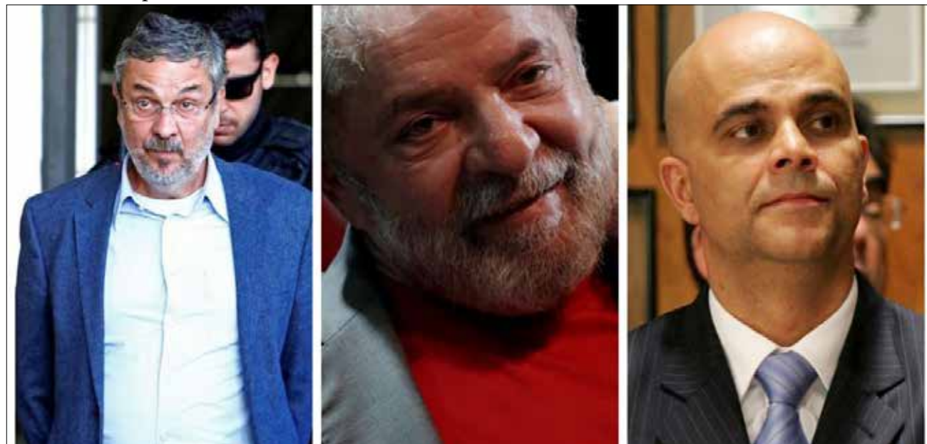
Dois fantasmas rondam Lula: Palocci e Valério, Lacaio de outrora

Também, vale lembrar, que a morte de Celso Daniel, foi com requintes de crueldade. Ou seja: tortura. Logo a "tortura" que rendeu muitos votos e dinheiro também para os esquerdistas de plantão. E crimes de tortura não prescrevem.