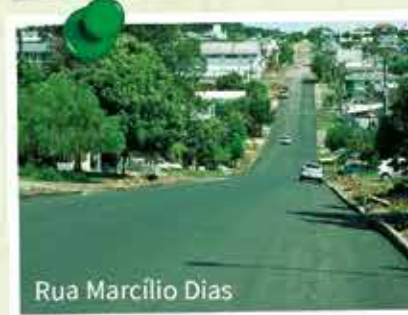
Rua Marcílio Dias