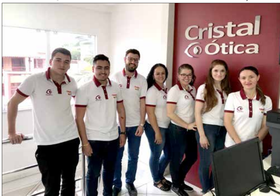
Equipe da loja em São Miguel do Oeste, na Almirante Tamandaré

Para o próximo ano, o objetivo é um crescimento de 20% e a abertura de três lojas novas.