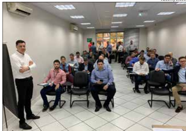
O evento mobilizou cerca de 50 participantes do comércio e setor industrial da região