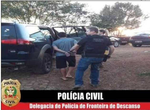
Acusado foi preso e levado para a cadeia de São Miguel do Oeste