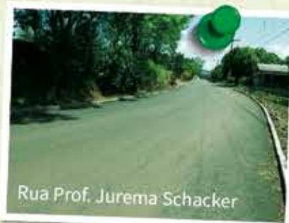
Rua Prof. Jurema Schacker