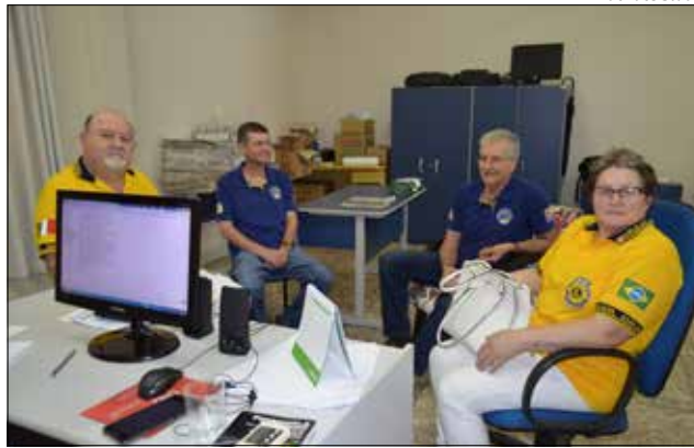
Governadora e esposo, o presidente e o secretário do Lions Clube São Miguel do Oeste estiveram em visita à sede do Jornal Imagem

Em São Miguel do Oeste, a agenda incluiu reuniões com as diretorias das entidades e eventos festivos. Segundo a governadora,