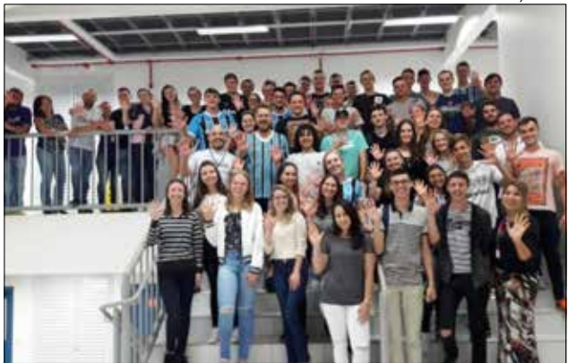
Acadêmicos, professores e direção receberam a notícia com entusiasmo