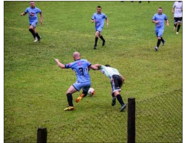
Jogos movimentaram o esporte domingo