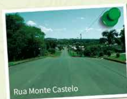
Rua Monte Castelo