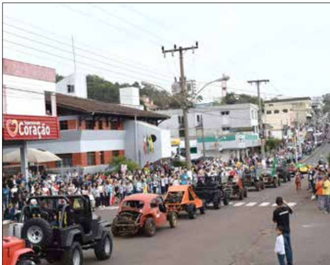
Em Descanso, população acompanhou caminhada e desfile na avenida Martin Piasieski

Acompanharam a programação os secretários municipais e alguns vereadores. Autoridades do poder Executivo de Santa Helena também participaram da programação da manhã.