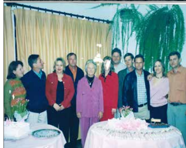
Acima, lembrança do casamento em 1945. Abaixo, a família atualmente