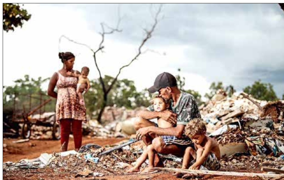
Em Brasília, um exemplo do que realmente é miséria...

Então a pergunta é: para que arrecadar tanto e economizar tanto? Para revitalizar as nossas BRs 282 e 163 não é. Pois, segundo o deputado federal Celso Maldaner, o orçamento 2020 prevê 30 e 20 milhões