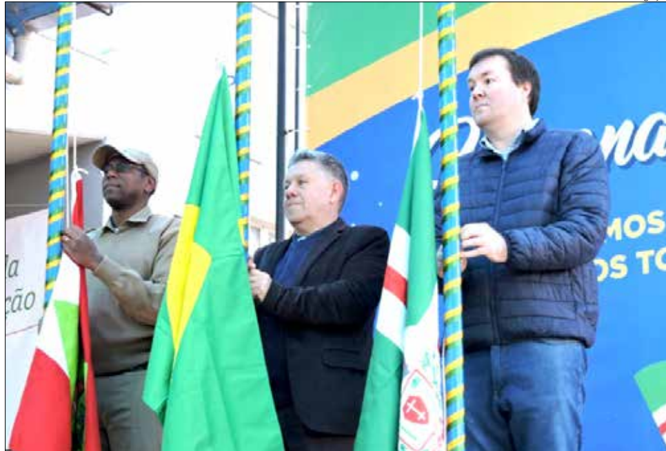
Hora Cívica marcou a extinção do fogo simbólico e arriamento das bandeiras

Pela manhã, o desfile militar reuniu milhares de pessoas na Praça Valnir Bottaro Daniel. O desfile, que contou com a participação das corporações da Polícia Militar, Polícia Ambiental, Polícia Civil, Bombeiros e Exército e foi prestigiado por autoridades, familiares e pela comu-