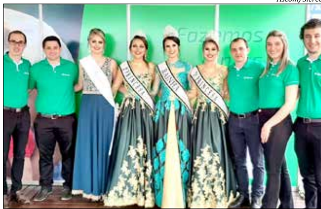
O estande da Sicredi buscou oferecer conforto e embelezar ainda mais o parque da Faic

O estande da Sicredi buscou oferecer conforto e embelezar ainda mais o parque da Faic. O espaço foi planejado especialmente para a comunidade, como uma área de descanso, lazer e negócios, disponibilizando água, café, carregador de celular e a boa recepção dos colaboradores locais. Para as crianças,