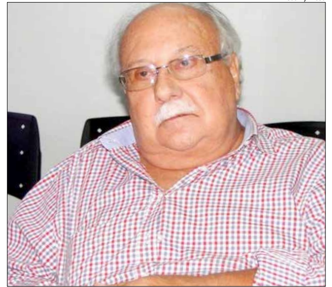
Walmor de Luca era marido da deputada estadual Ada Faraco de Luca

Pelo MDB, elegeu-se deputado federal por Santa Catarina em 1974, conquistando nas eleições seguintes mais três mandatos para a Câmara dos Deputados. Foi secretário de Estado da Saúde no governo de Paulo Afonso Vieira e ocupou o cargo de assessor parlamentar do Ministério da Saúde de 1991 a 1992 e desempenhou outras funções em estais no Estado.