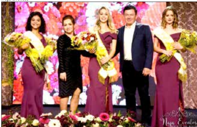
Novas soberanas pousaram com as autoridades após o resultado