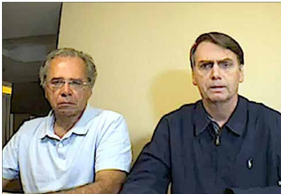
Economizar e arrecadar é preciso

A lista tem Petrobras, Eletrobrás, Banco do Brasil, BNDES, Caixa e Correios. Juntas, as companhias que geram receitas ou prejuízo, impõem um desafio à gestão pública. Indicação política, má governança e falta de metas claras destas empresas reforçam a tese das privatizações. O tema é polêmico. Mas o Estado não precisa de empresas.