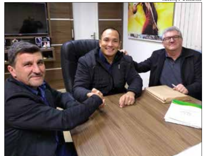
A reunião com o presidente da Fesporte foi na quinta-feira, 5 de setembro