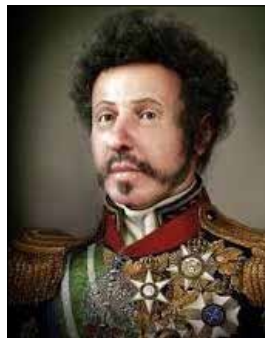
D Pedro I - 1822