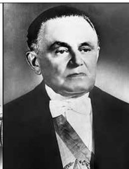
Castelo Branco - 1964