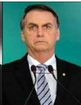
Jair Bolsonaro - 2019