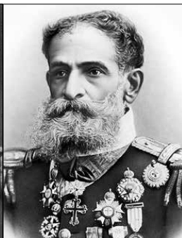
Deodoro da Fonseca - 1889