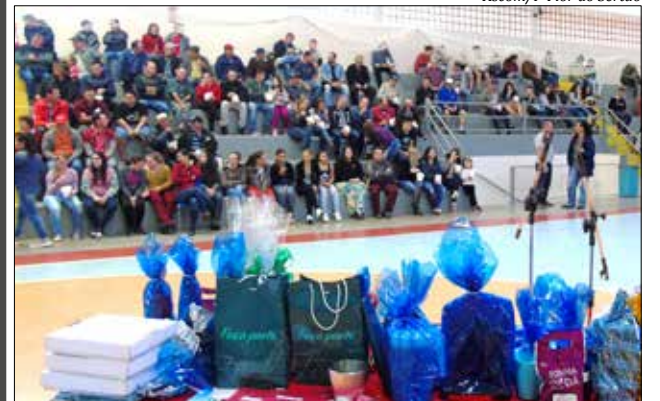
Ginásio de Esportes ficou lotado e pais levaram brindes