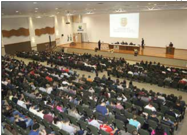
O evento apresentou três palestras com profissionais da área de investigação de crimes cibernéticos