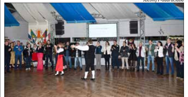
Apresentação de danças marcou os as comemorações do aniversário