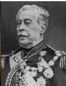
Caxias - 1866