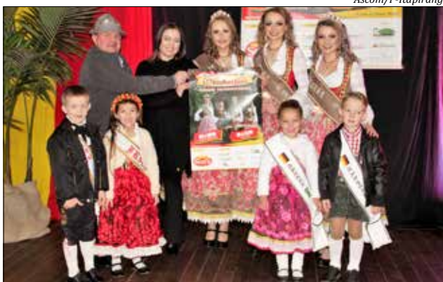
Cartaz e novos trajes das soberanas foram apresentados ao público

oficial e dos novos trajes das soberanas. A 41ª Oktoberfest será promovida pela Aceti com apoio do município durante o mês de outubro, na Linha Becker e também no Complexo October, na cidade.