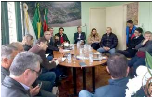
Encontro aconteceu em Barra do Guarita

Também foi criada uma comissão, formada por três prefeitos catarinenses (São Miguel do