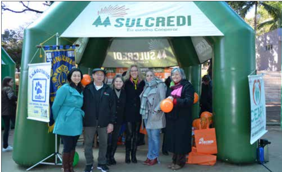
Sulcredi São Miguel foi uma das cooperativas de crédito a participar

O 'Dia de Cooperar', também conhecido como 'Dia C' é uma iniciativa das