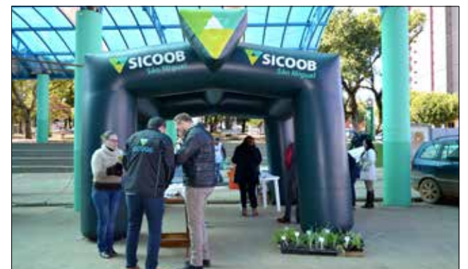
Sicoob São Miguel foi uma das cooperativas apoiadoras do evento