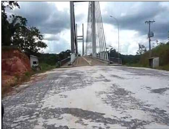
Lado brasileiro 0,00 para passar

Uma ponte que liga o Brasil à Guiana Francesa foi inaugurada em 2017, seis anos depois de ter sido concluída, devido atrasos nas obras complementares de acesso rodoviário. Salvo melhor juízo, como de costume, aditivos e a corrupção, tanto na rodovia como na ponte, envergonharam a grande Nação tropical. A ponte entre a cidade de Oiapoque e o povoado francês de Saint-Georges se estende por quase 400 metros sobre o rio Oiapoque.