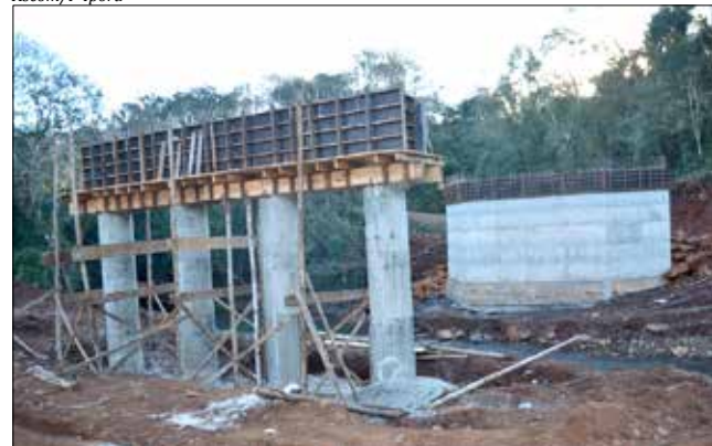
Pilares prontos para receber as vigas, que irão sustentar a pista de rolagem