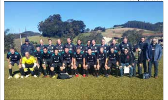
Equipe do 13 de Maio comemorou o título