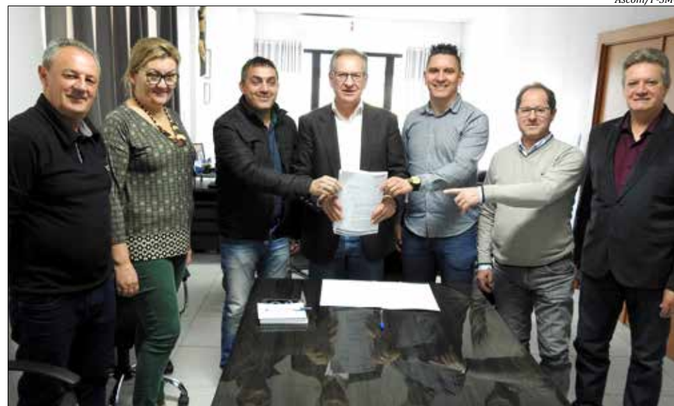
Prefeito entregou o projeto na tarde de terça-feira

O programa foi apresentado à comunidade em ato público realizado no último dia 19 de junho, no auditório da Secretaria de Educação. Depois disso, o prefeito ainda conversou com os vereadores, a fim de promover os ajustes necessários ao Projeto, para que possa tramitar e ser