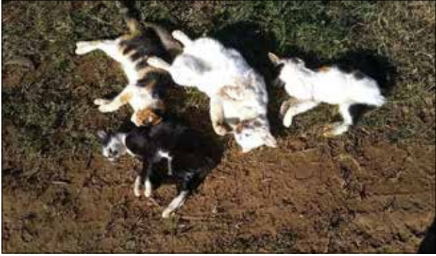
Animais foram encontrados por ONG que iria recolhê-los para abrigo