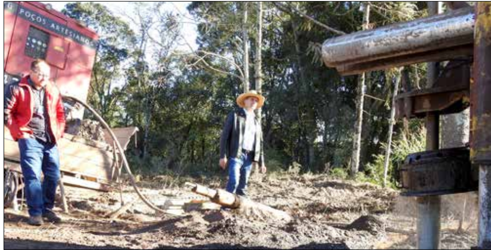
A perfuração do primeiro poço foi concluída na manhã de terça-feira, na Linha Jacutinga