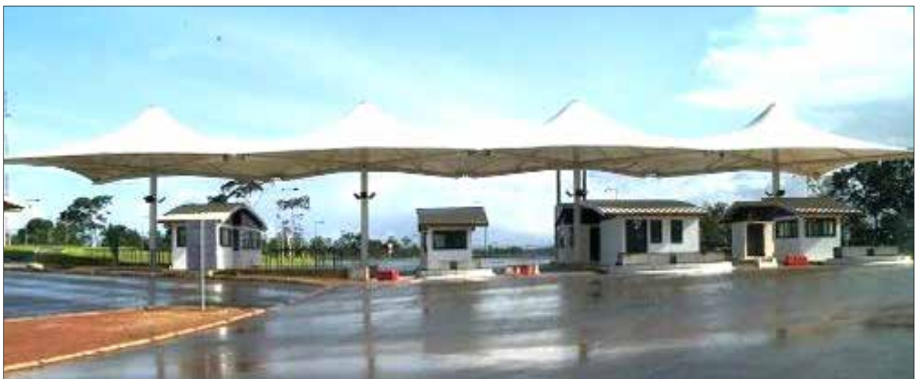
Lado Guianense, R$ 1.500,00 para passar

Este é o preço de ser encantado por esquerdopatas, aqueles que afastaram os militares do centro do poder. Foram os generais que construíram a Estrada de Ferro do Amapá e o Porto de Santana, para escoar o manganês da Serra do Navio, maior reserva de manganês do mundo. O encantamento fez mal para todos.