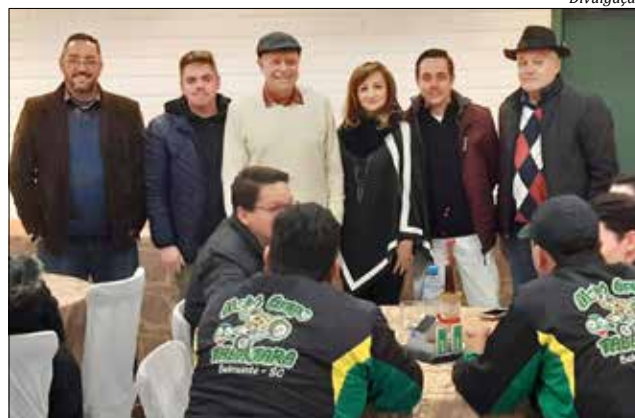
Novos coordenadores foram escolhidos em encontro regional