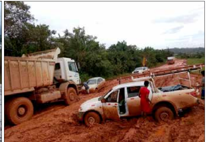
Estrada para chegar a Oiapoque ainda tem 100 quilômetros sem asfalto

Como mostra a foto, não há qualquer controle de entrada de estrangeiros pelo lado brasileiro, informa o SindiReceita, dos Analistas Tributários. Ano passado, uma equipe do sindicato constatou no local a vergonha nacional: do lado Guiano, há 90 agentes e policiais em ação, aduana ativa, câmara frigorífica para transbordo e fiscalização fitossanitária.