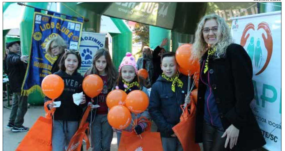
Crianças também aderiram ao Dia C de Cooperar

cooperativas brasileiras e consiste na promoção e estímulo à realização de ações voluntárias diversificadas. Em geral, o 'Dia de Cooperar' é realizado no mesmo dia em que se celebra o Dia Internacional do Cooperativismo, primeiro sábado de julho. As ações do 'Dia C'