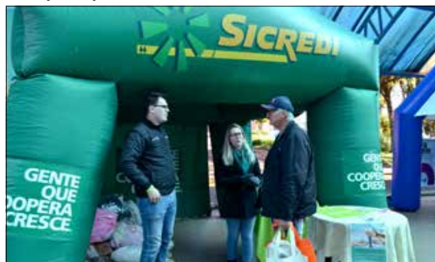
Sicredi também se fez presente no evento