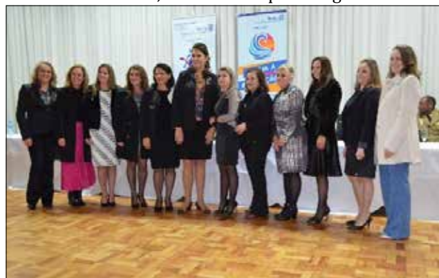
Associação de Senhoras Rotarianas também foram empossadas