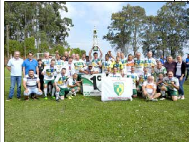
Pérola comemorou o título após vitória nos pênaltis