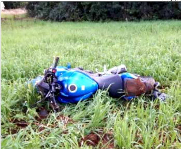
Vítima pilotava uma moto, que saiu da pista e tombou em lavoura