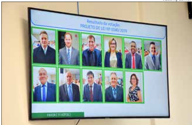
Resultado da votação é exibido em painel no plenário da Câmara

Outra novidade é a exibição de um cronômetro na tela com o tempo disponível para o vereador inscrito falar. Ao término do tempo, o microfone é cortado automaticamente. Segundo o presidente Everaldo Di Berti, a intenção é dar mais agilidade e or-