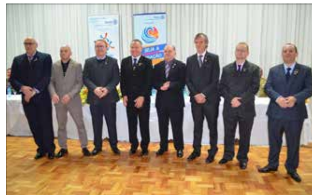
Posse do Conselho Diretor do Rotary Clube São Miguel