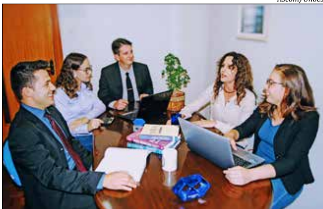
O acadêmico de Administração é preparado para atuar como um executivo de grandes organizações ou ser gestor do seu próprio negócio

Durante a graduação, os futuros administradores participam de diversas atividades voltadas ao empreendedorismo. Todos os anos, os acadêmicos participam da competição de ideias de negócios inovadores, viagens de estudos, visitas a empresas, palestras com empresários de sucesso e a presença de empresários em sala de aula para