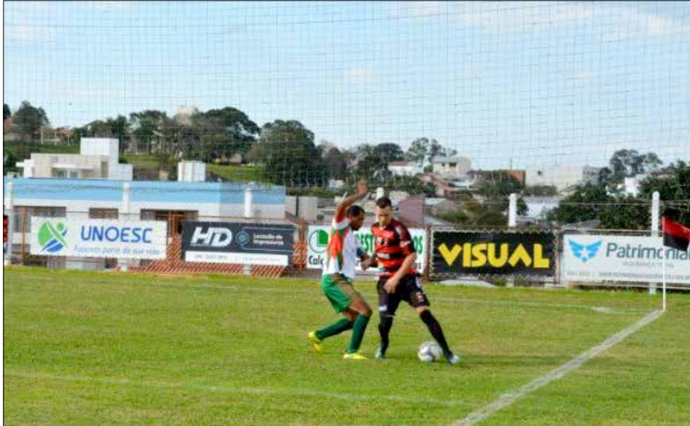
Guarani venceu o Ginástica de Riqueza por 2 x 0