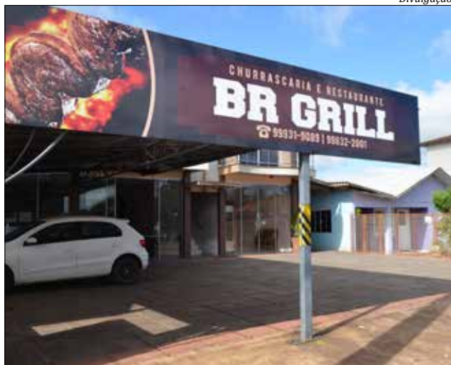
Novo restaurante está localizado na Rua Willy Barth, no Bairro Progresso